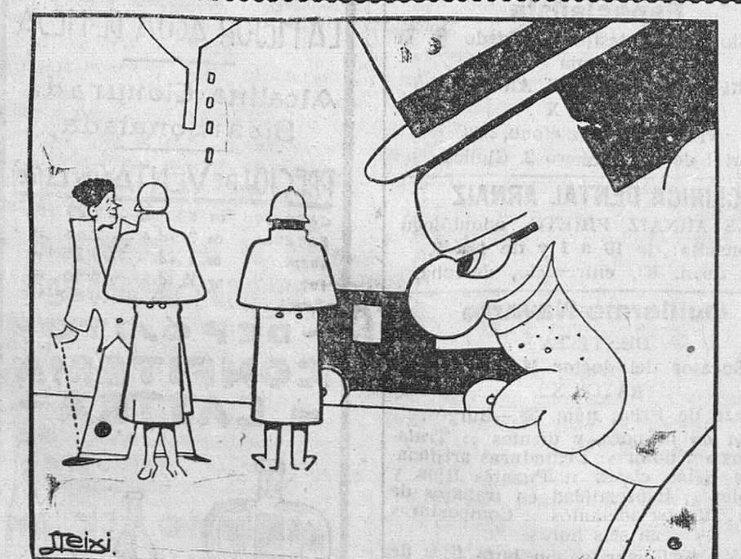
MODAS - ¡Pues señor, ya no sé cuál es el guardia.