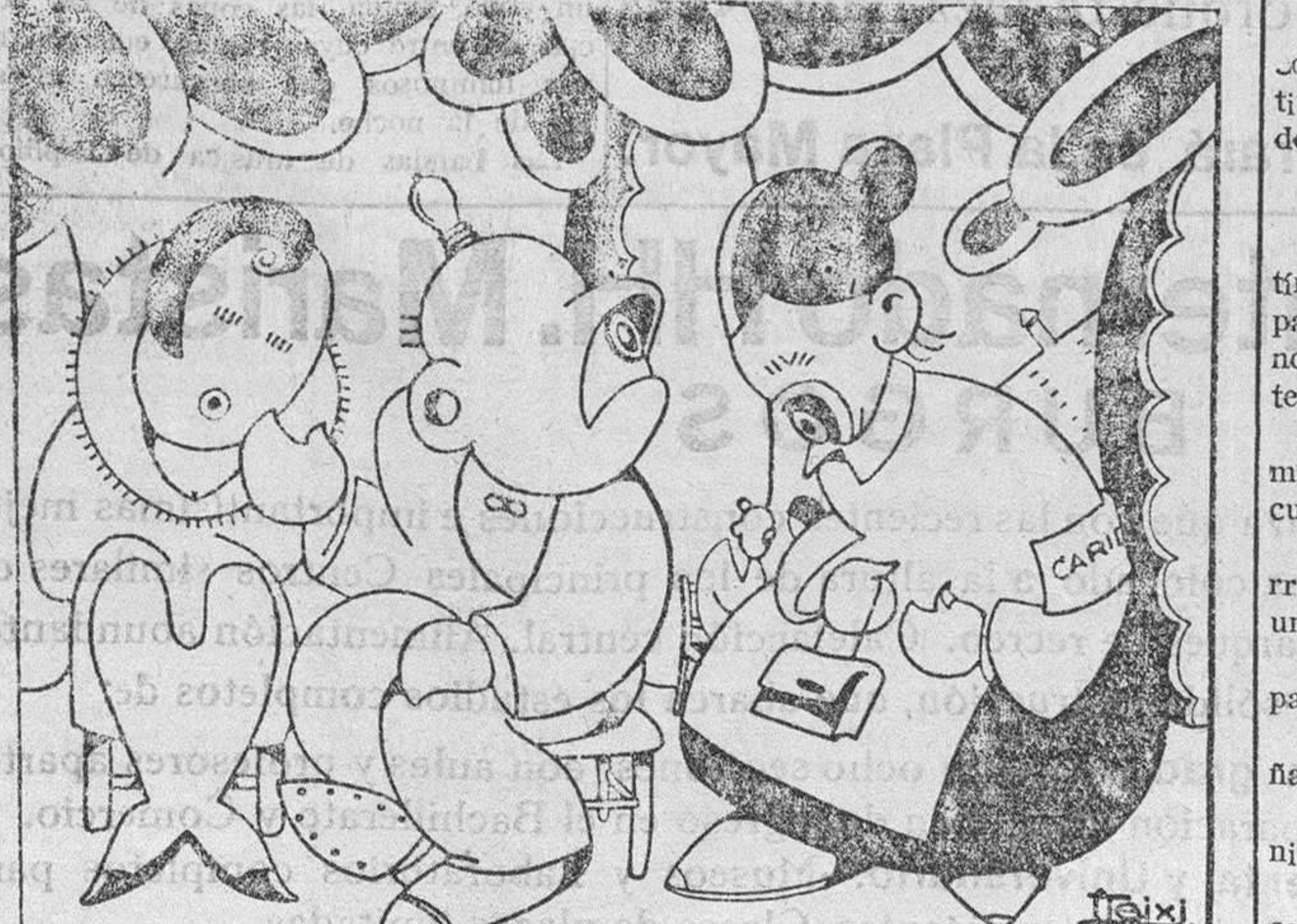
EN EL OTRO MUNDO

ESTE NUMERO HA SIDO VISADO POR LA CENSURA