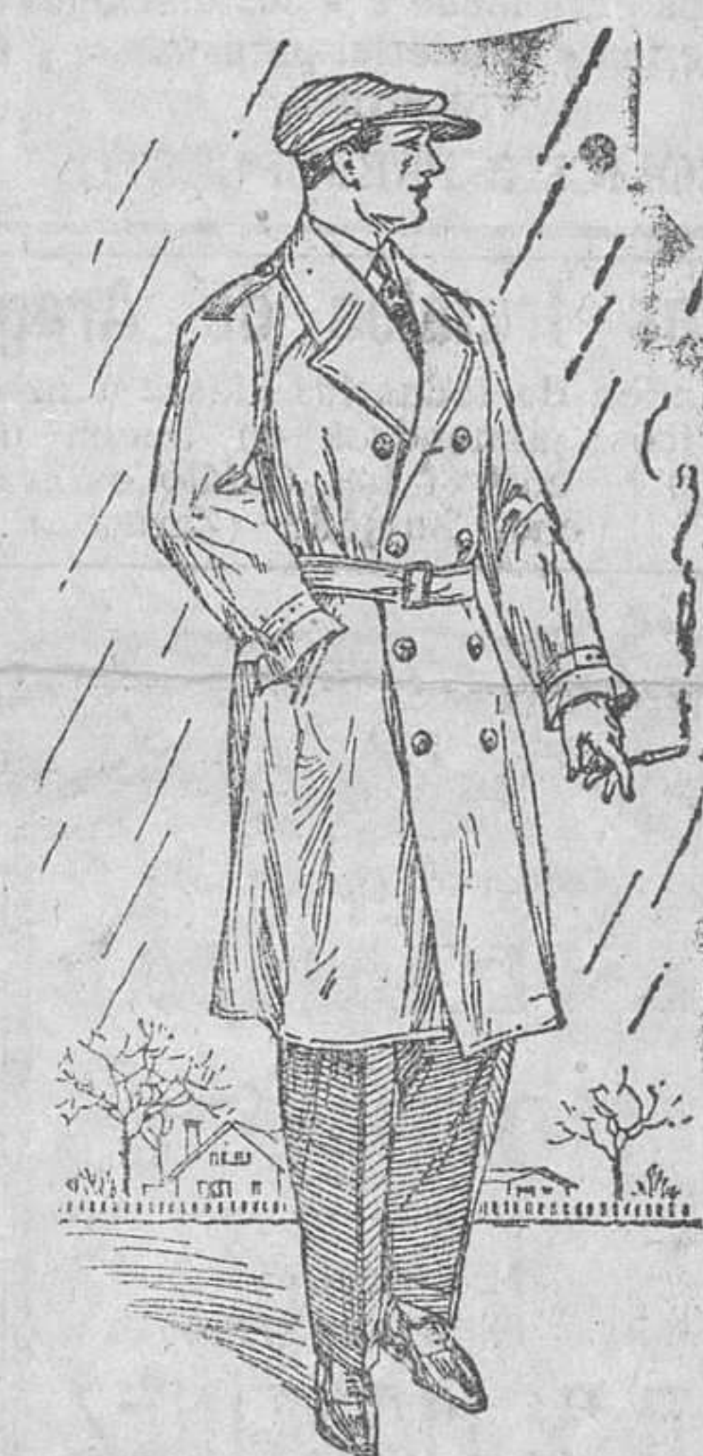
TRINCHERAS DE CALIDAD SUPERIOR tela engomada y botón cuero, desde 35 pesetas.

antes de comprar, ver la colección que de TRINCHERAS, PELLIZAS, ABRIGOS DE PAÑO Y CUERO y trajes de todas clases para caballero y niño presenta esta Casa