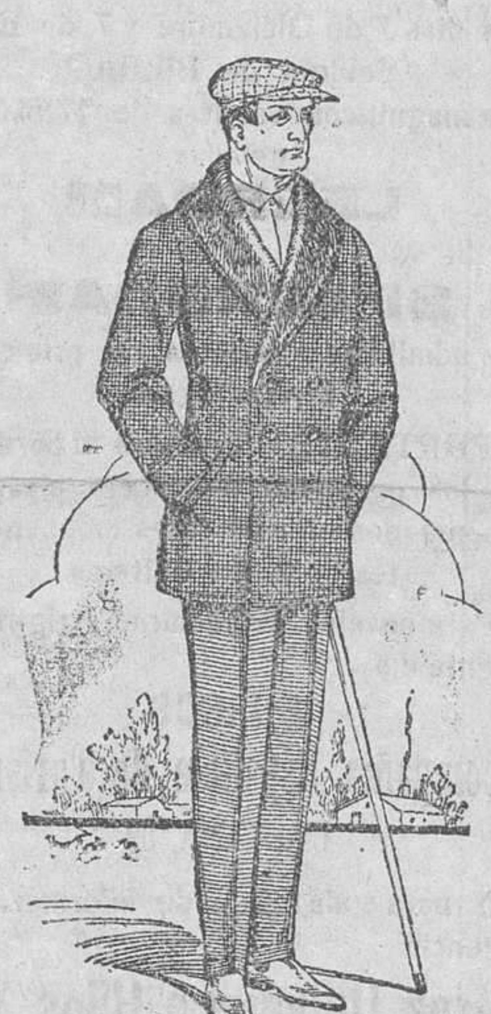
PELLIZAS gran surtido, desde 28 a 125 pesetas.

Gran surtido en bufandas, mantas de cama y géneros de punto a precios sumamente baratos