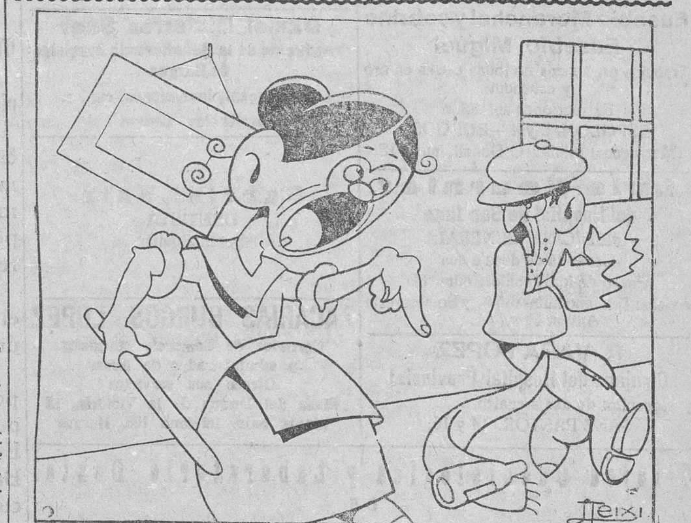
DEL BOLETIN METEOROLOGICO Siguen las tormentas en las regiones de «Cónjuges», por la parte del «Priven», a orillas del «Tasca».

A los colaboradores espontáneos SE LES ADVIERTE QUE NO SE DEVUELVEN LOS ORIGINALES NI SE SOSTIENE CORRESPONDENCIA