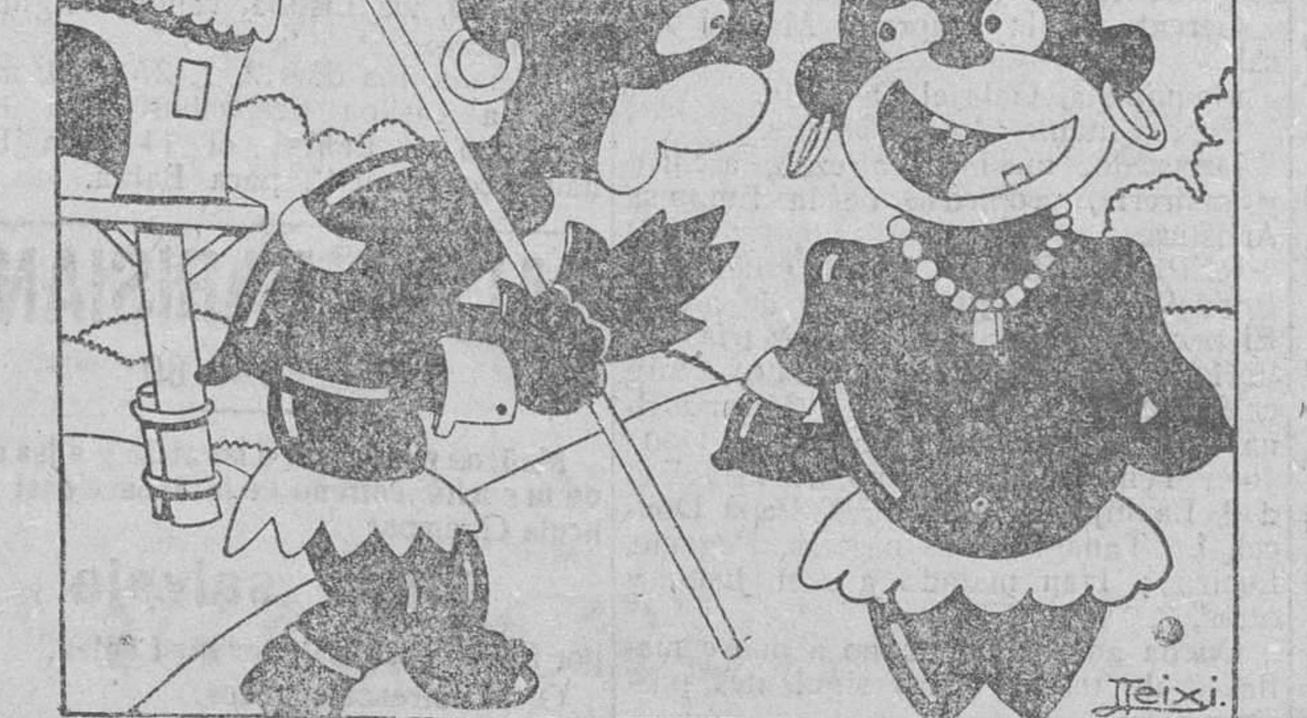
—Que no vuelva yo a saber qué tiras los bancos y rompes los faroles. Eso lo dejas para cuando vayas a Burgos.

Subasta Hasta el 30 del corriente mes se admiten proposiciones en sobre cerrado, para el suministro de carne, pan y vino, con destino al Hospital de San Juan y Casa Refugio.