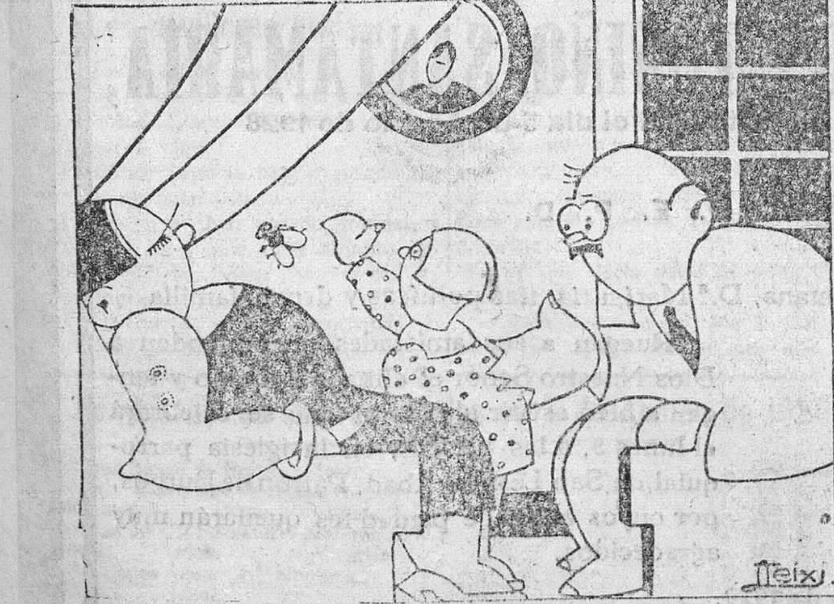
PROCURANDO EL PORVENIR —Si a propósito de lo que se dice por estudiar, con tus recomendaciones aún podría alcanzar un cargo elevado. —Y sin esculcar tan bien ¡Con m. t. se a escalatorer...!

EN MADRID: Kiosco de Las Calatravas.—Calle de Alcalá. EN BILBAO: Librería T. Cámara.—Alameda de Mazaredo y Alameda de Urquijo. EN SANTANDER: Librería de Fernández Hermanos.—Calle Blanca. EN SAN SEBASTIAN.—Romana Samaniego.—Garage Garnier. EN VALLADOLID: Librería de Laurentino de la Justicia.—Plaza Mayor. EN PALENCIA: En la librería de Santiago Morrono.—Mayor Principal. EN LAS ESTACIONES DE MIRANDA y Venta de Baños. EN LAS CABEZAS DE PARTIDO y pueblos importantes de la provincia.