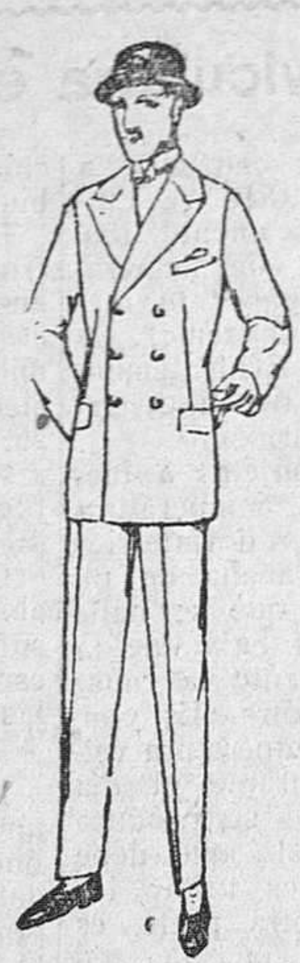
Trajes de paño, corte inglés. a 80, 90, 100 y 120 pts.