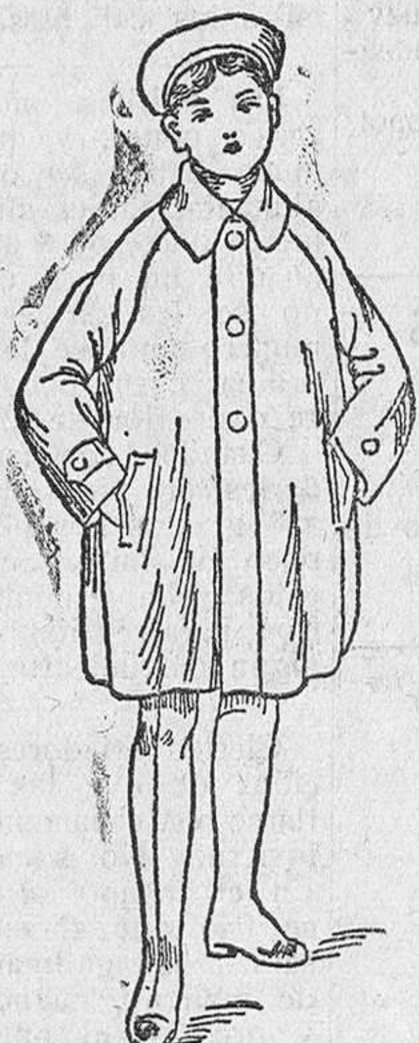
Trincheras y abrigos, a 30, 35, 40, y 50 pesetas.

Precio fijo verdad. Todos los artículos marcados.