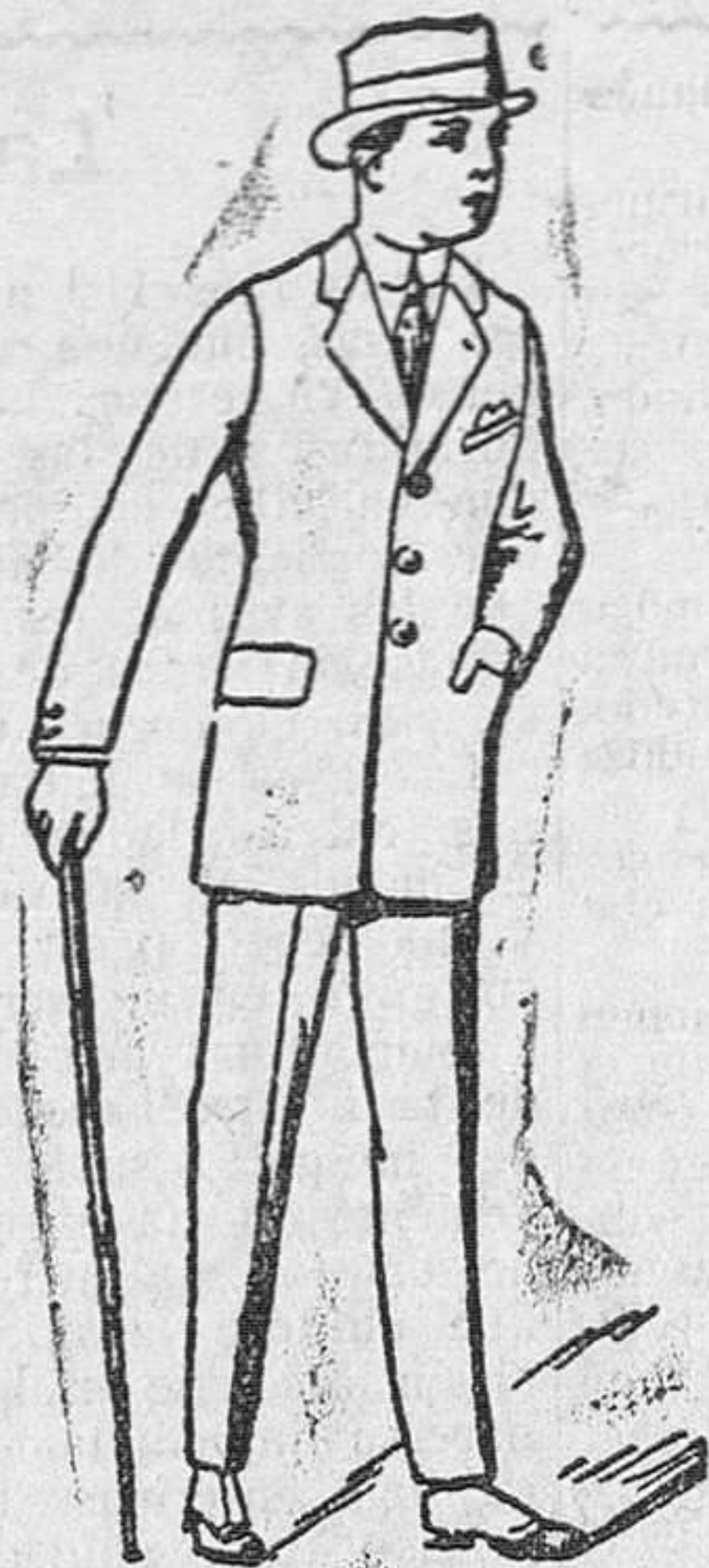
Trajes para caballero, ECONOMICOS a 35, 40, 45 y 50 pesetas