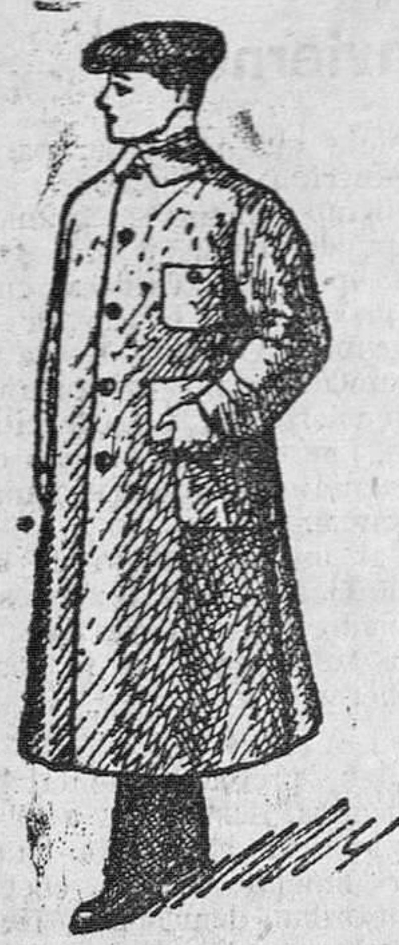
Guardapolvos en color gris y kaki. 11 a 8, 10, 12, 15 y 20 pesetas

Gran casa de tejidos, pañería y confecciones de caballero, señora y niños