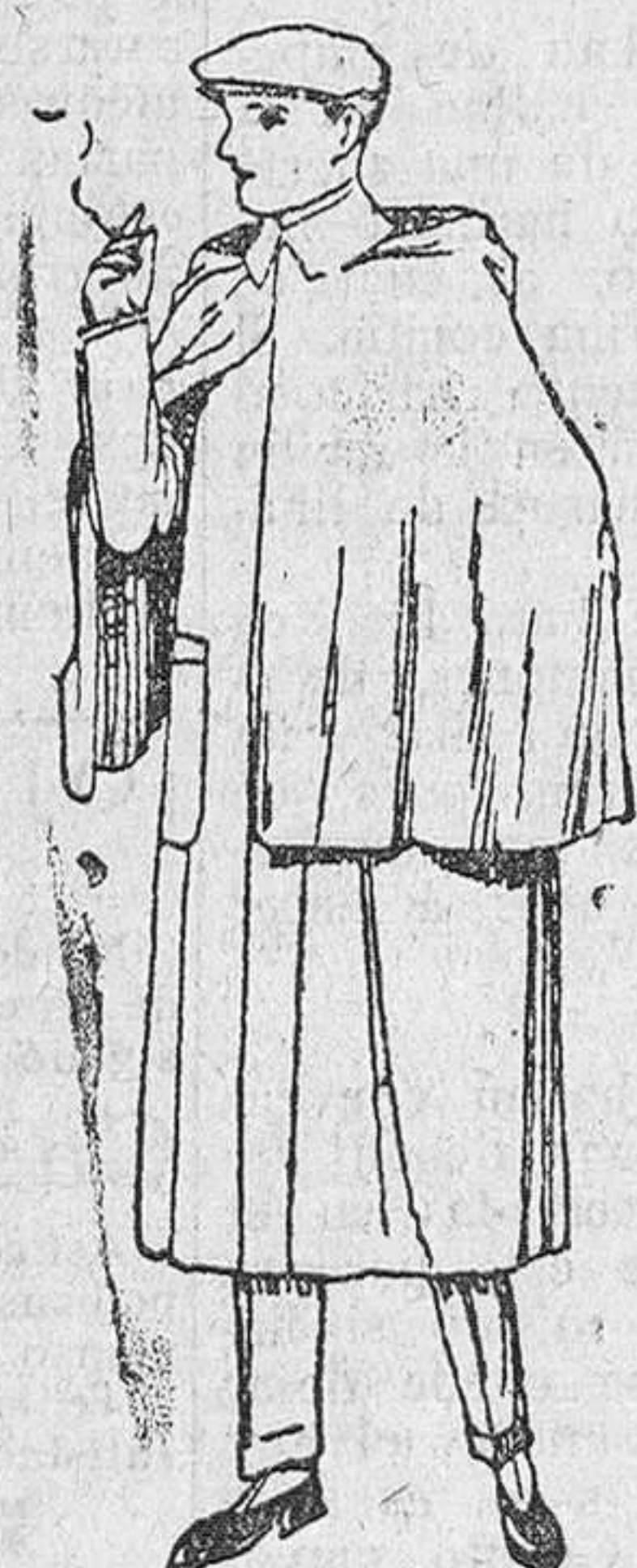
Impermeables, en negro y azul, a 100, 110, 120 y 130 pesetas.