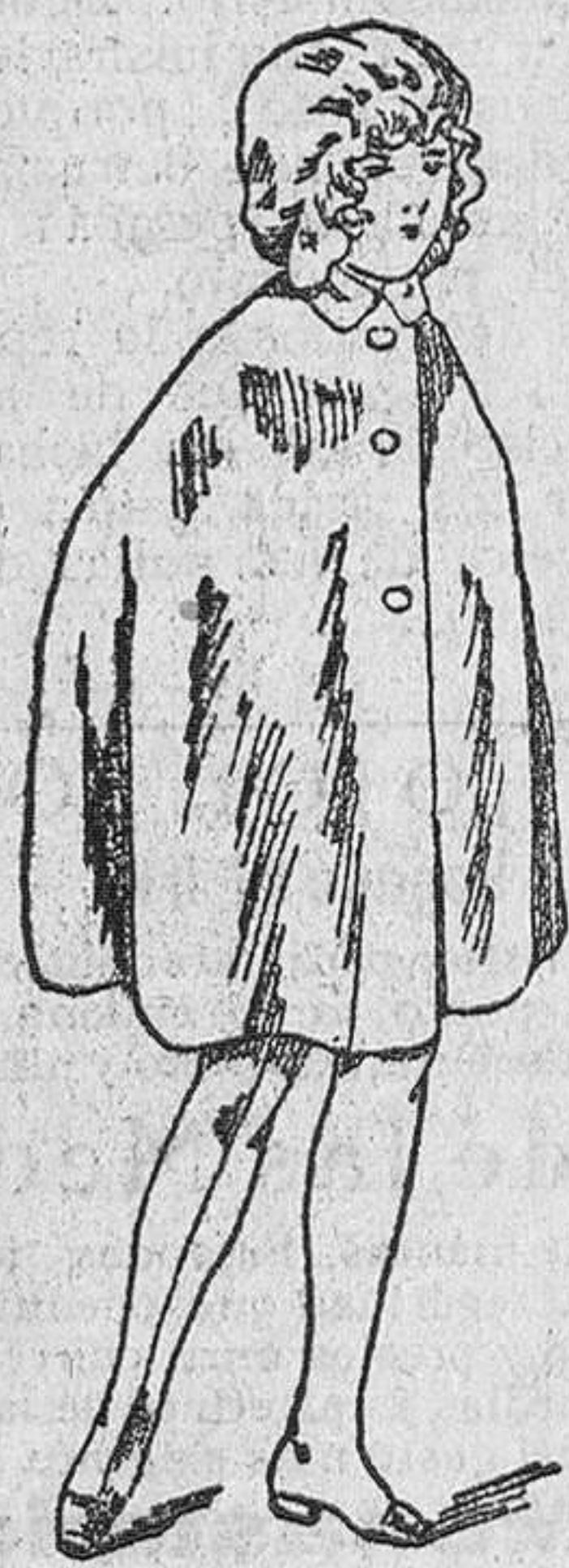
Capitas impermeables, de 8 a 20 pesetas, en negro y colores.