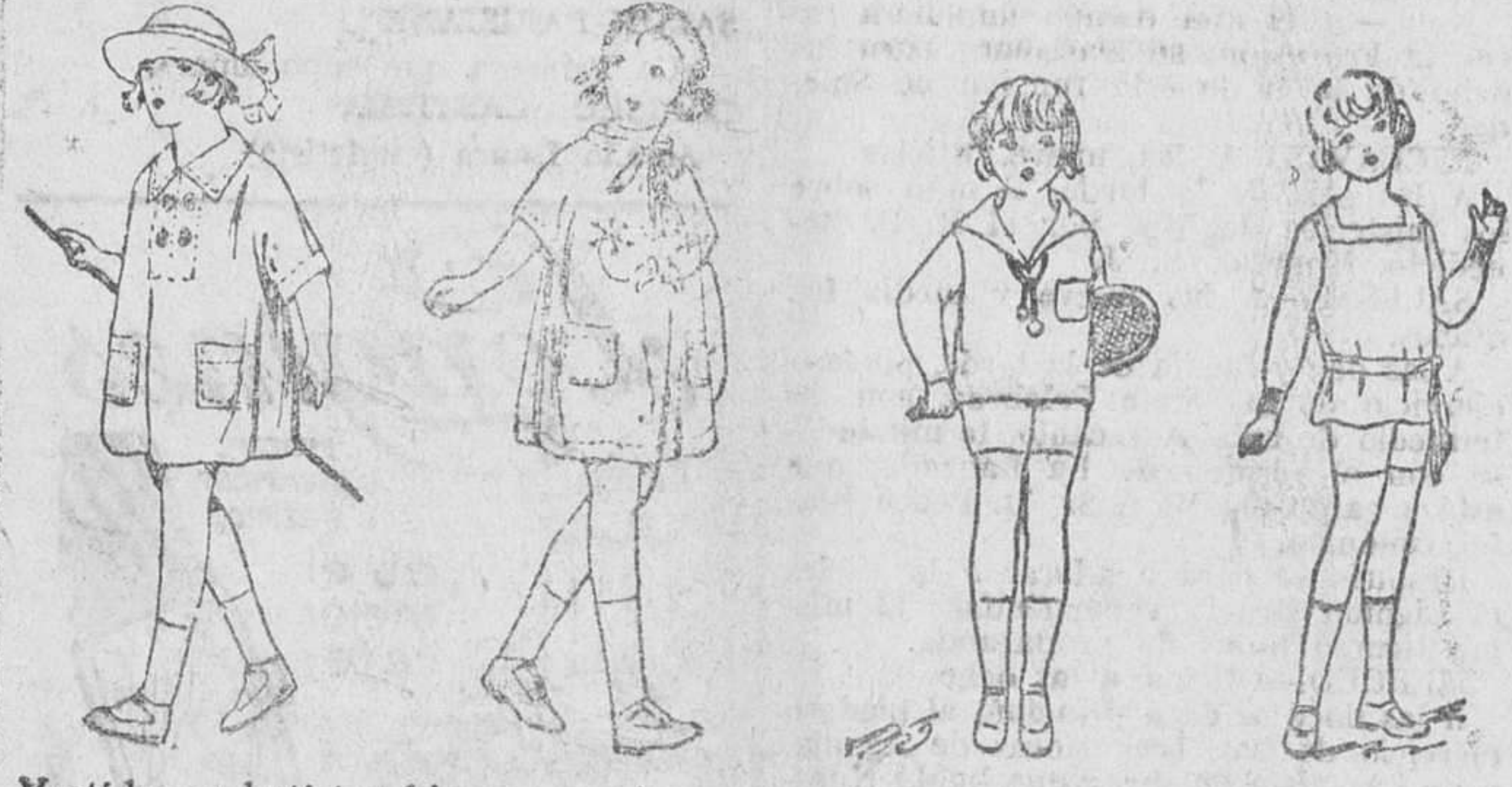
Vestidos en batistas blancas y colores, a 5, 6, 8 y 10 pesetas. Trajecitos de punto, gran novedad, a 8, 10 y 11 pesetas. Precio fijo verdad. Todos los artículos marcados