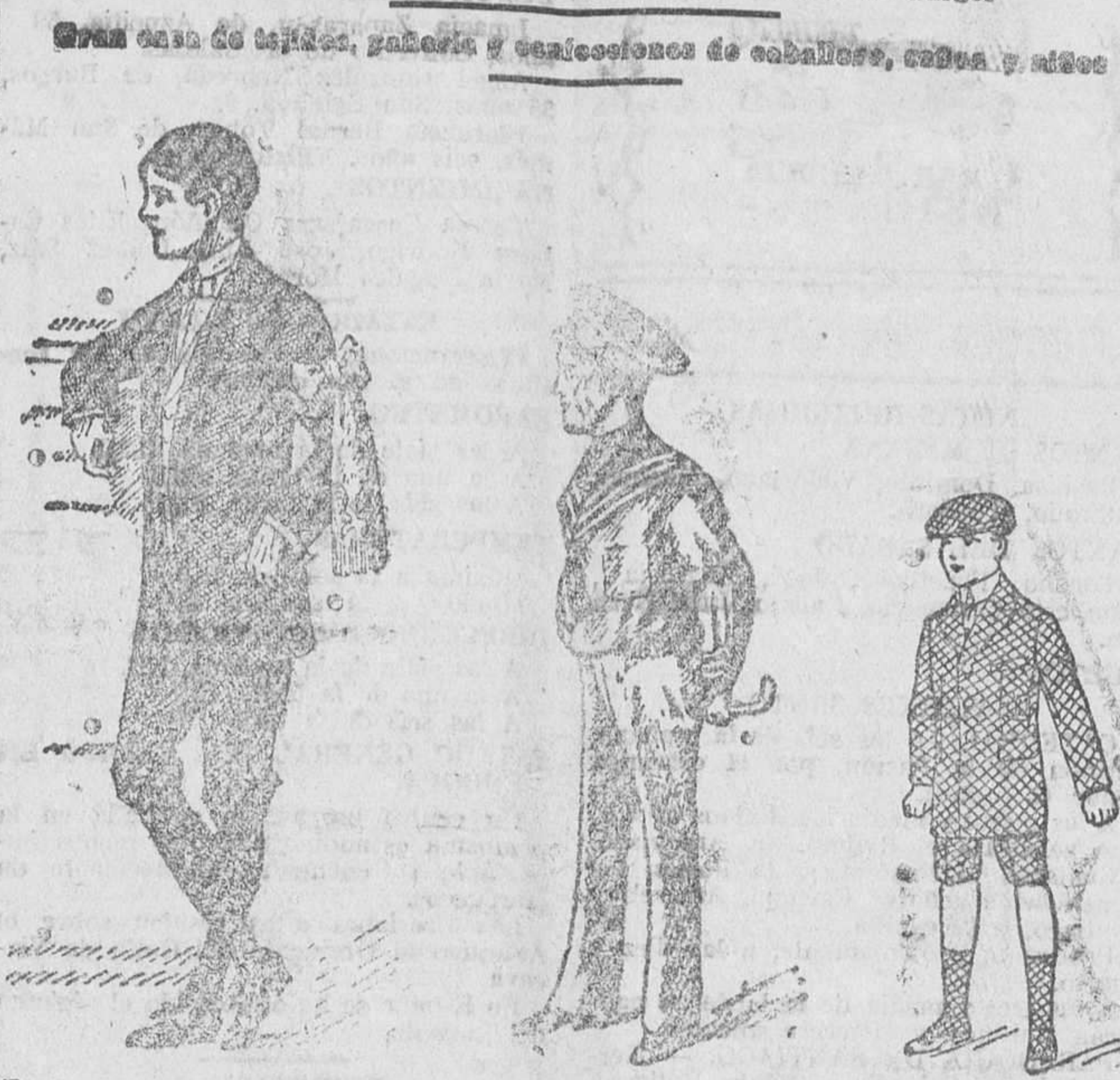
Trajes primera comunión, en dril blanco, alpaca y lana, de 30 a 60 pesetas. Trajecitos jerga azul, pantalón largo, de 30 a 50 pesetas. Trajecito cuadros a 15, 18 y 25 pesetas.