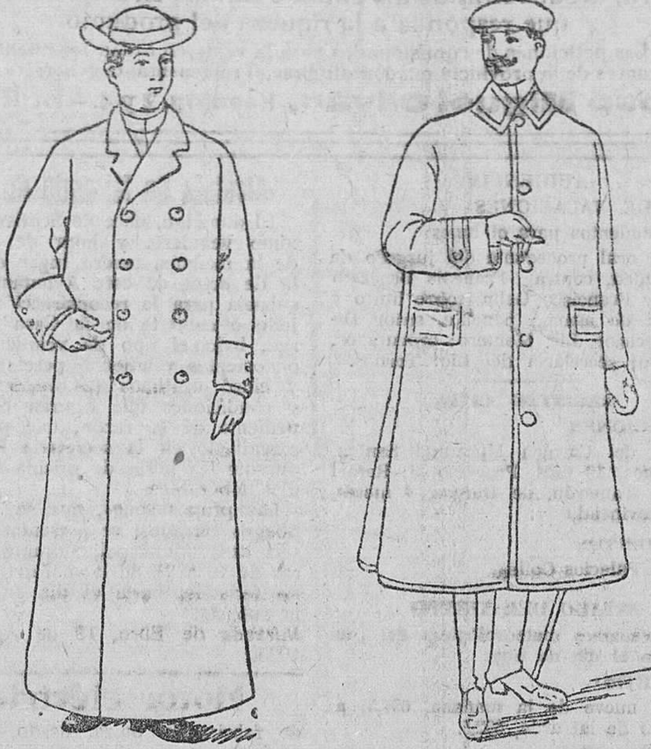
Guardapolvos a 7, 8 y 10 pesetas. Guardapolvos de satén y dril, de 15 a 25

Gran casa de tejidos, paños y confecciones de caballero, señora y niños