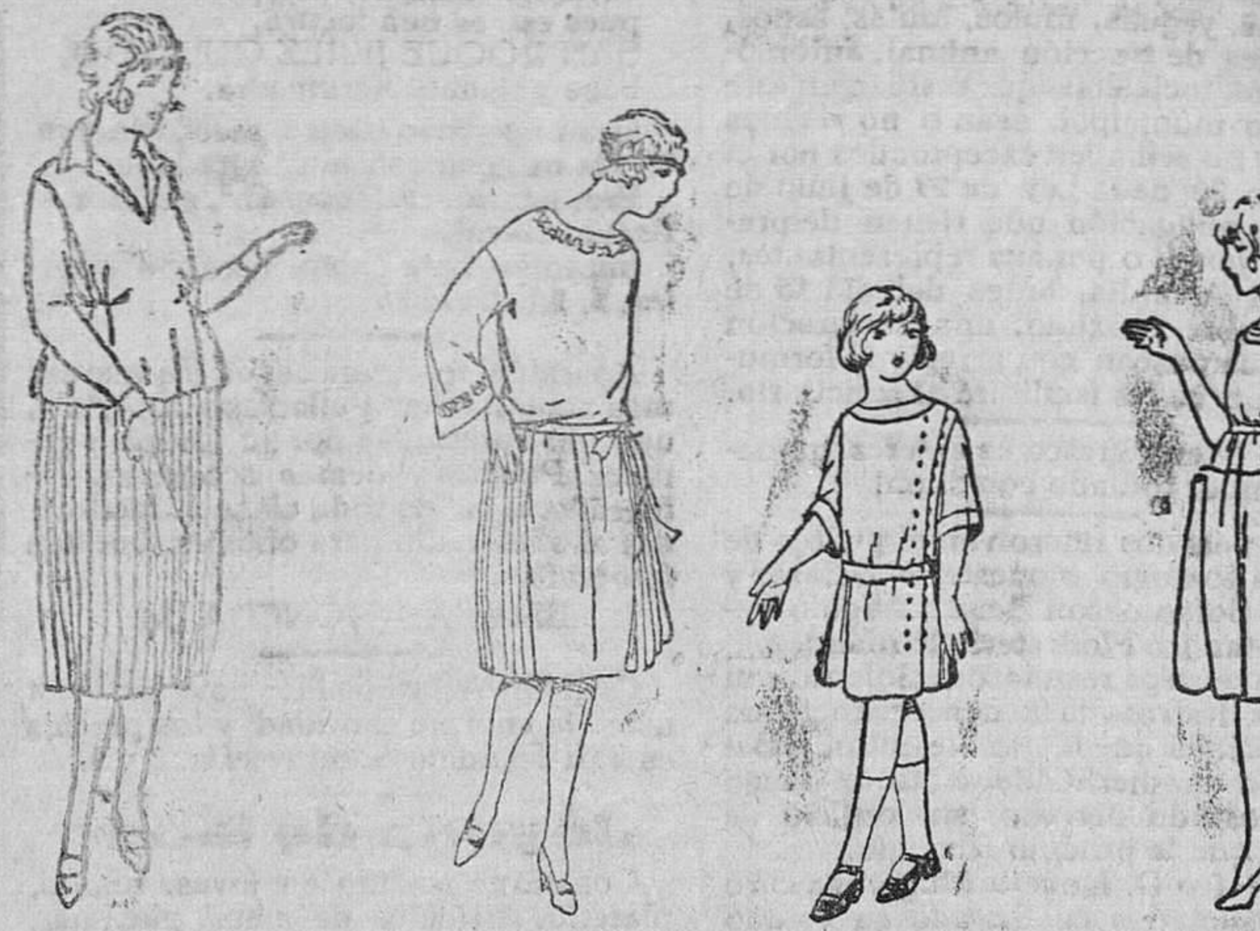
Faldas plisadas, de lana y crepon, a 20, 25 y 30 pesetas. Vestido lana otomán, plisado a los costados, 25, 30 y 35 pesetas. Vestiditos para niños, diversidad de modelos, en lana y algodón. Precios: de 10 a 25 pesetas.

Gran casa de modas, paños y confecciones de caballero, señora y niños