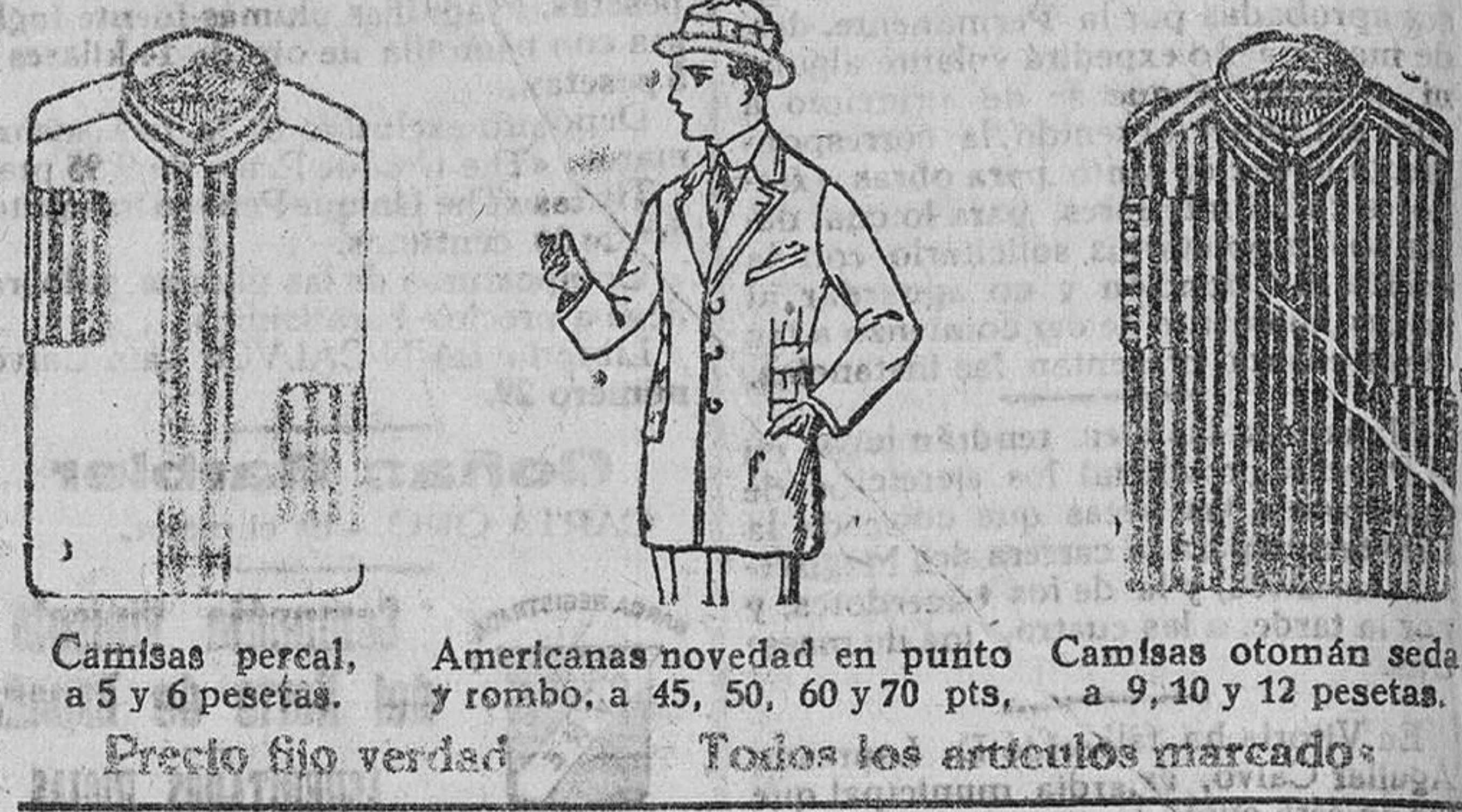
Camisas percal, a 5 y 6 pesetas. Americanas novedad en punto y rombo, a 45, 50, 60 y 70 pts., a 9, 10 y 12 pesetas. Camisas otomán seda, a 9, 10 y 12 pesetas.