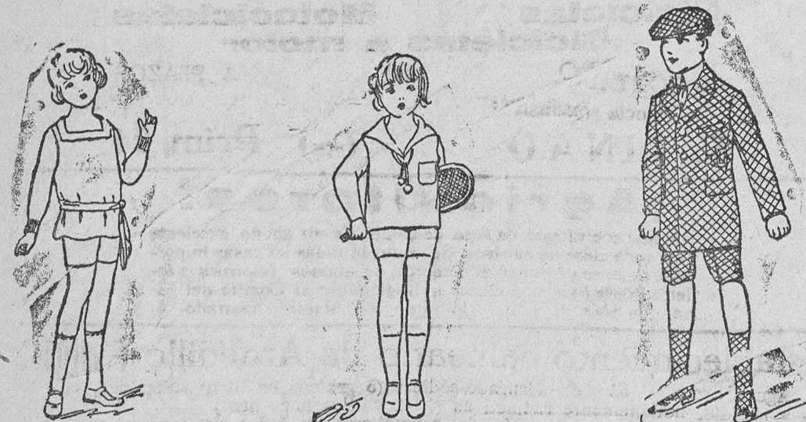
Trajecitos punto a 9, 10, 12 y 15 ptas. Trajecitos dril, en blanco y color, a 12, 15, 18 y 20 pts. Trajecito cuadros, gran novedad, a 20, 25 y 30 pesetas

Precio fijo verdad. Todos los artículos marcados.