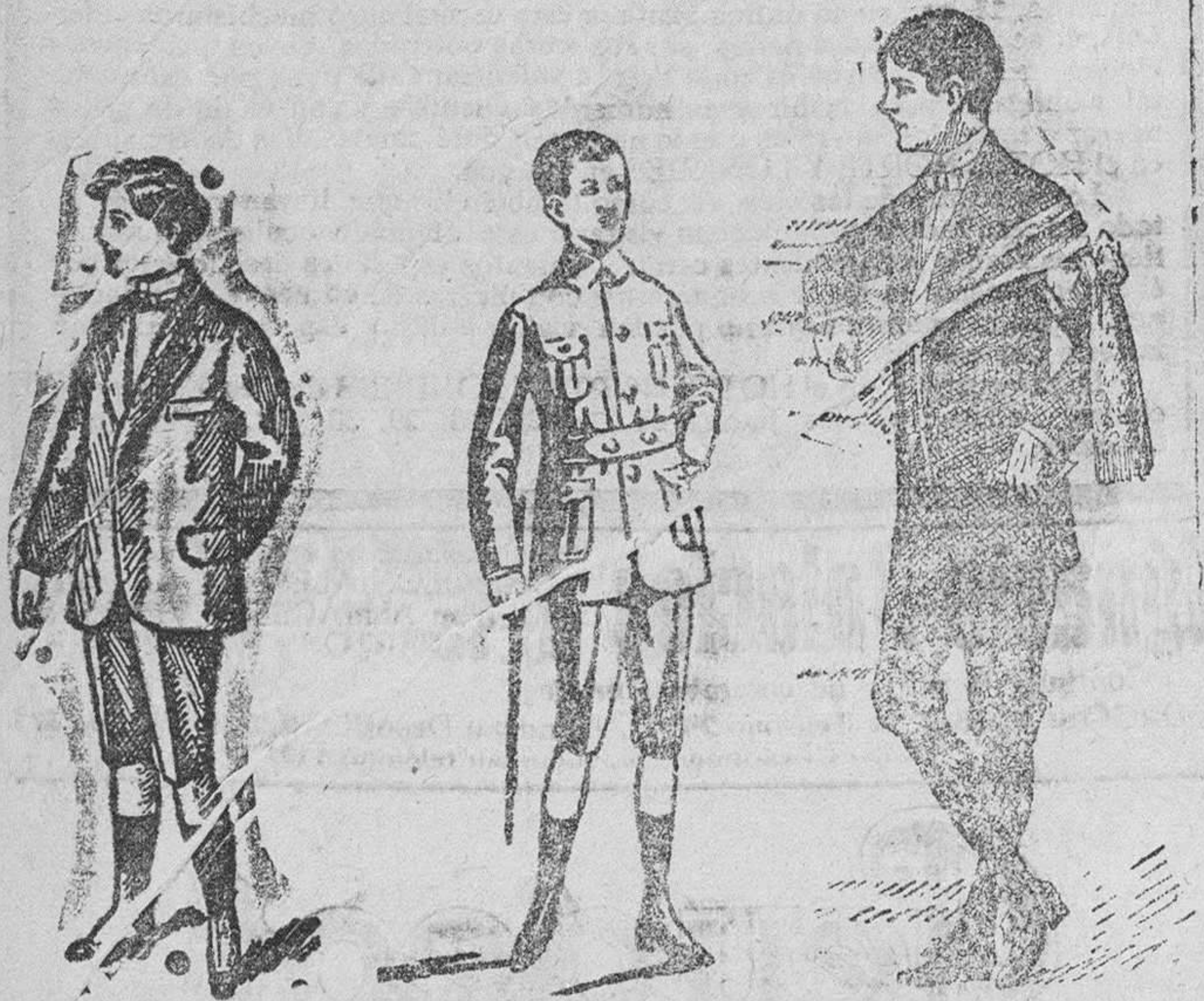
Trajes de paño dril, Para jovencitos, a 25, 30, 35 y 40 pesetas Trajecitos de dril a 8, 10, 15 y 20 pesetas Trajes blancos para primera comunión, de alpaca, lana y gerga. - Precios según clase.

Gran casa de tejidos, pañería y confecciones de caballero, señora y niños