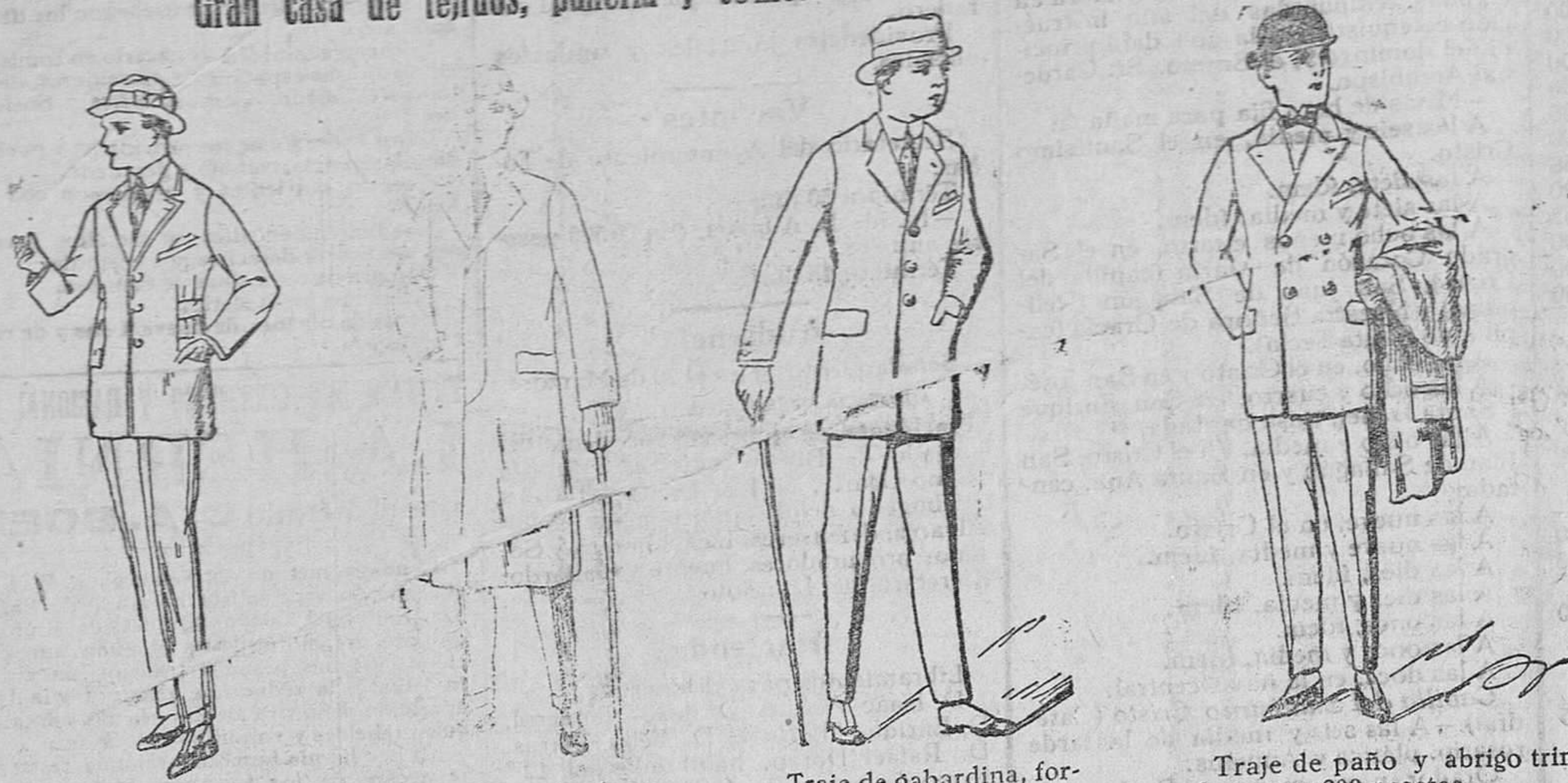
Gabardinas impermeables a 90, 100, 110 y 125 pesetas.

Gran casa de tejidos, pañería y confecciones de caballero, señora y niños