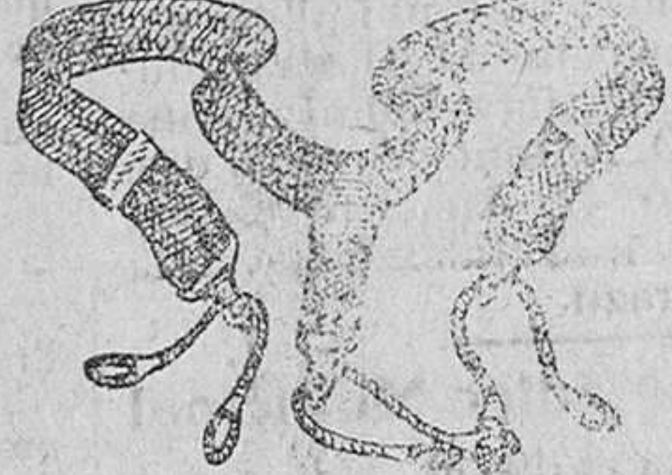
Tirantes a 1. 1'25, 2'50 y 3 pesetas.