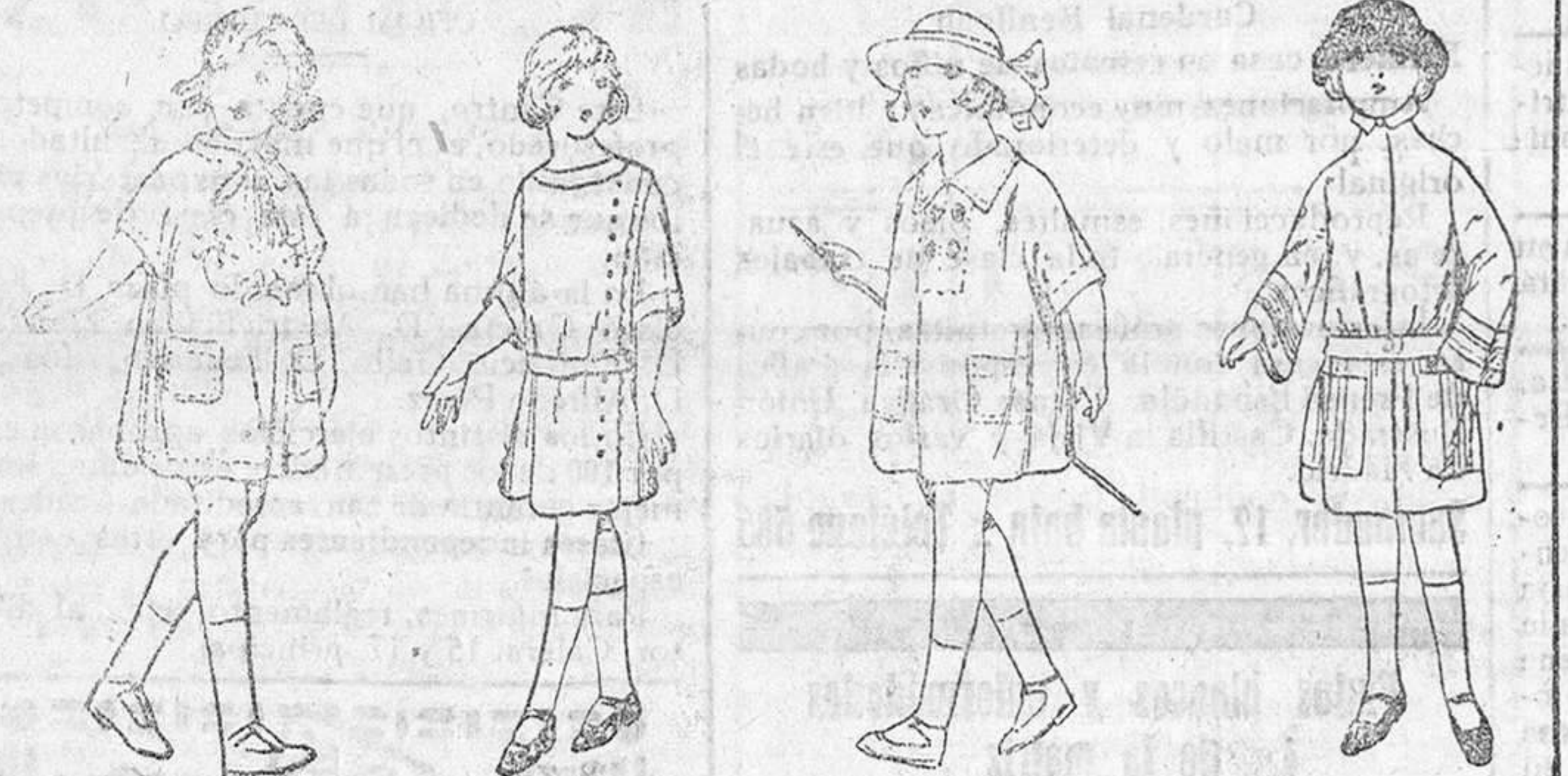
Vestiditos percal para niñas de 2 á 5 años, á 4, 5 y 6 pta. Vestiditos de crepón seda, á 20, 25, 30 y 35 pesetas. Delantalitos de batista, á 5 y 6 pta. Abriguitos, de 15, 18 y 20 pta.

Precio fijo verdad. Todos los artículos marcados.