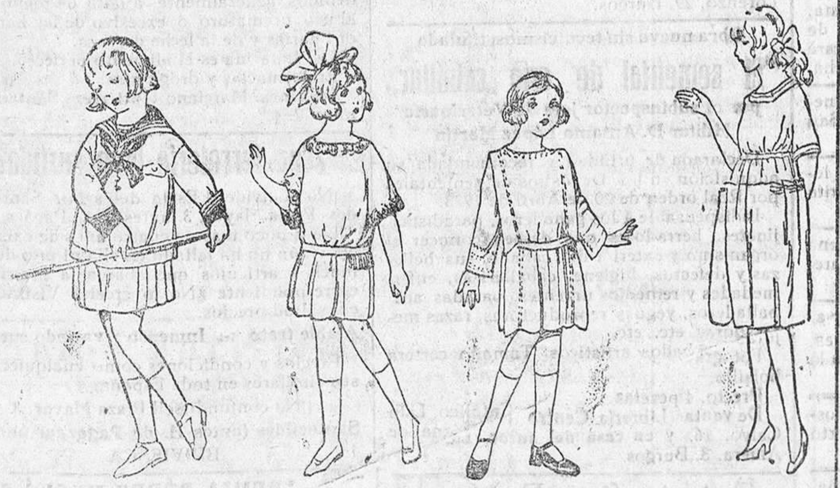
Trajecitos jerga y vicuña, 23, 30, 35 y 40 pesetas. Vestidito lana, diversidad de colores, á 12, 15, 18 y 25 pta. Vestiditos algodón, desde 8 á 15 pta. Batas novedad, en esponjas, á 10, 12 y 15 pesetas.