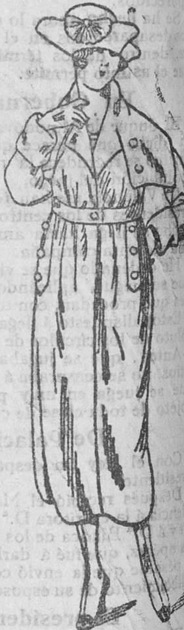
Grandes novedades en abrigos de paño, desde 30 á 175 pesetas Capas novedad, desde 60 á 150 pesetas.