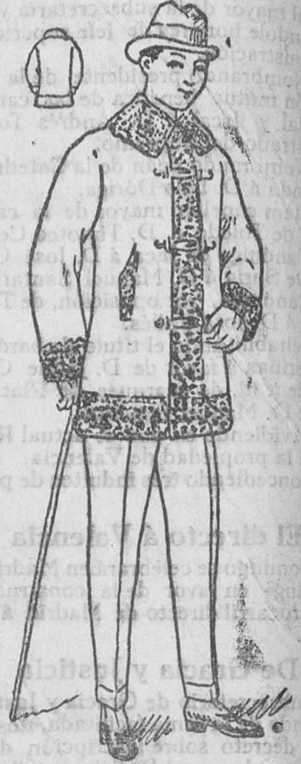
Pelizas de paño arrasado, cuello y mangas de rizo, desde 30 á 75 pesetas