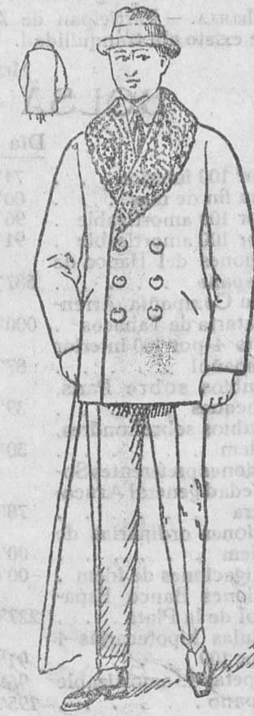
Pelizas paño pluma, rizo al cuello, de 25 á 100 pesetas

Gran casa de tejidos, pañería y confecciones de caballero, señora y niños