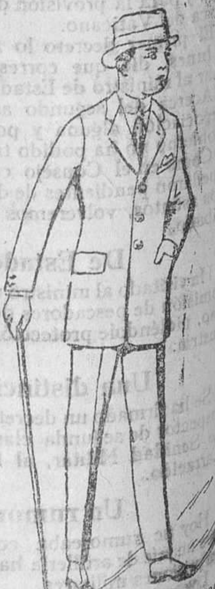
Gabanes de caballero de 60 á 120 pesetas Abriguitos de niños desde 20 á 60 ptas. Trajes caballero, esmerado confección, de 45 á 150 ptas.

Siempre en esta casa encontrarán grandes surtidos en toda clase de prendas hechas á mano.