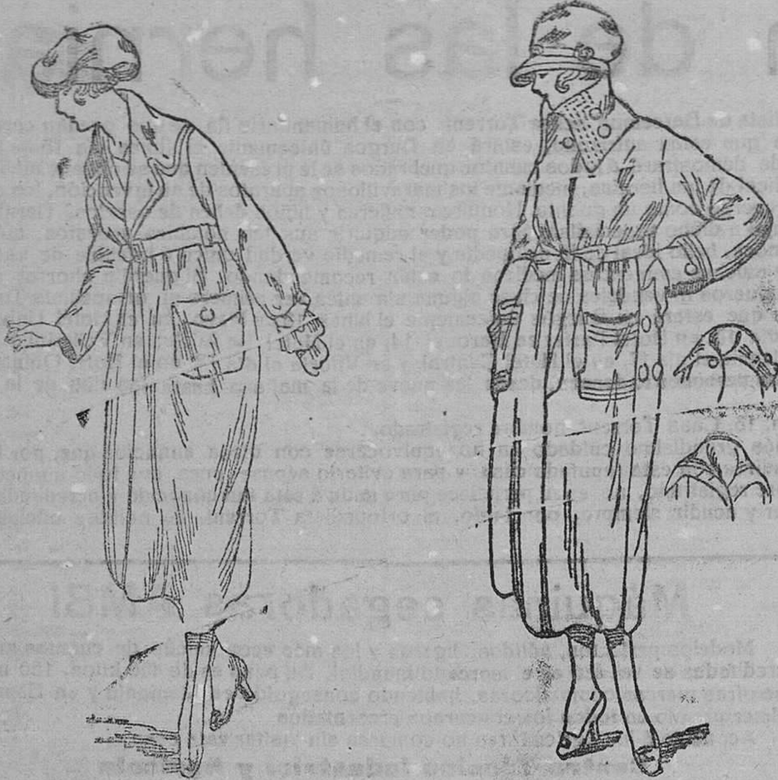
Abrigos de señora, en paños gamuzas, á 35, 40, 45, 50, 60 y 70 pesetas. Abriguitos de niñas á 10, 12, 15, 18, 20 y 25 pesetas.

Gran ocasión, como fin de temporada, en abrigos de señora y niñas