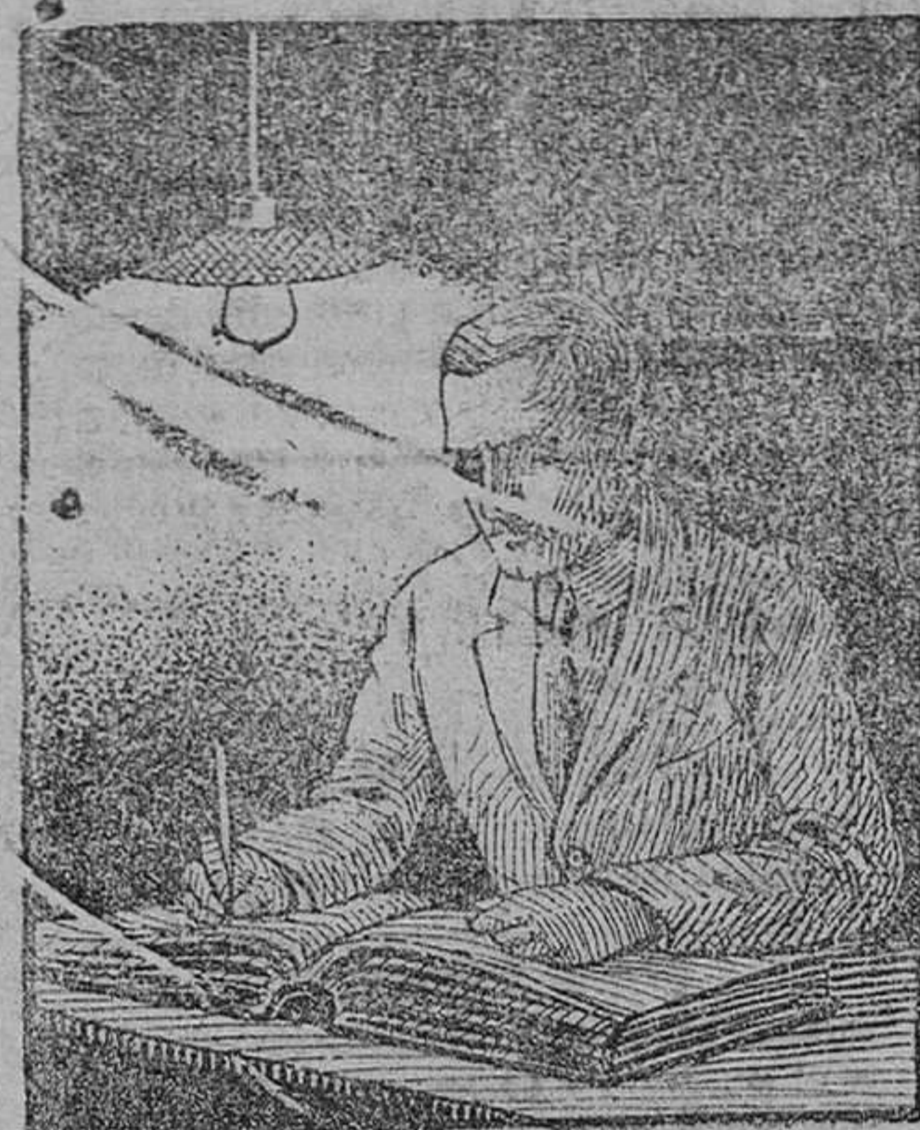
TRABAJANDO CON LÁMPARA DE FILAMENTO METÁLICO

LLENA DE GAS ARGON Con la lámpara "PHILIPS ARG A" trabajo como si fuese de día. DOBLE LUZ A MITAD DE COSTE