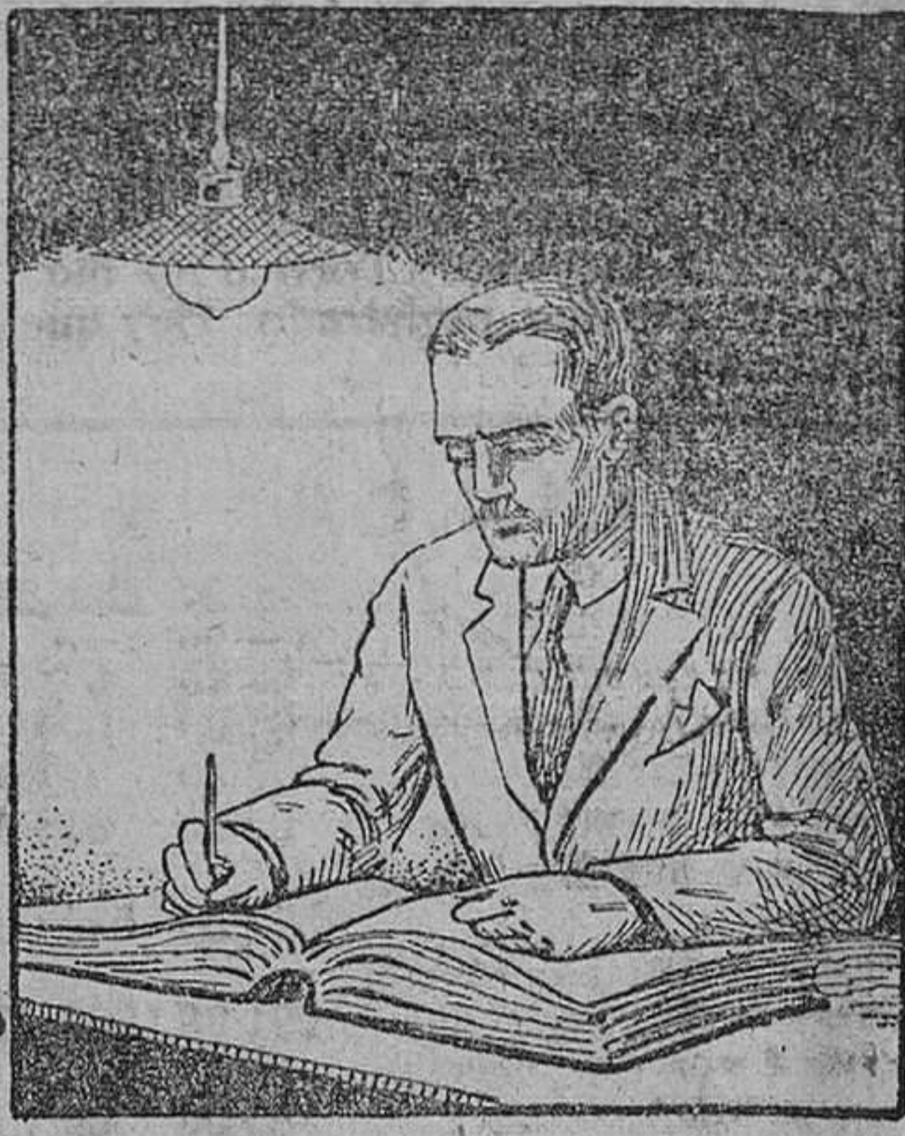
TRABAJANDO CON "PHILIPS ARG A" LLENA DE GAS ARGON

LLENA DE GAS ARGON Con la lámpara "PHILIPS ARG A" trabajo como si fuese de día. DOBLE LUZ A MITAD DE COSTE