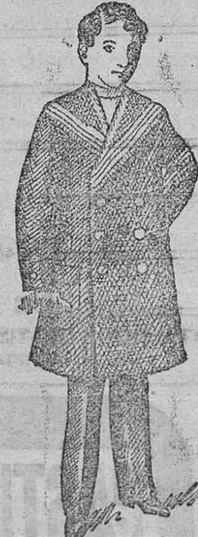
Mateles para niños, en vicuñas azul y negro, desde 25 á 50 pts.