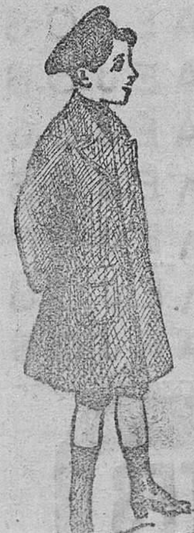
Abrigos de paño para niñas, desde 20 á 50 pesetas.