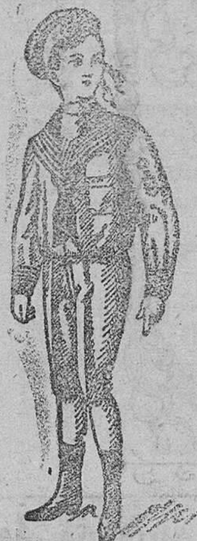
Trajecitos vicuña azul á 15, 17 y 20 pesetas.

Fabrica casa en confecciones de caballeros, señoras, niños y niñas