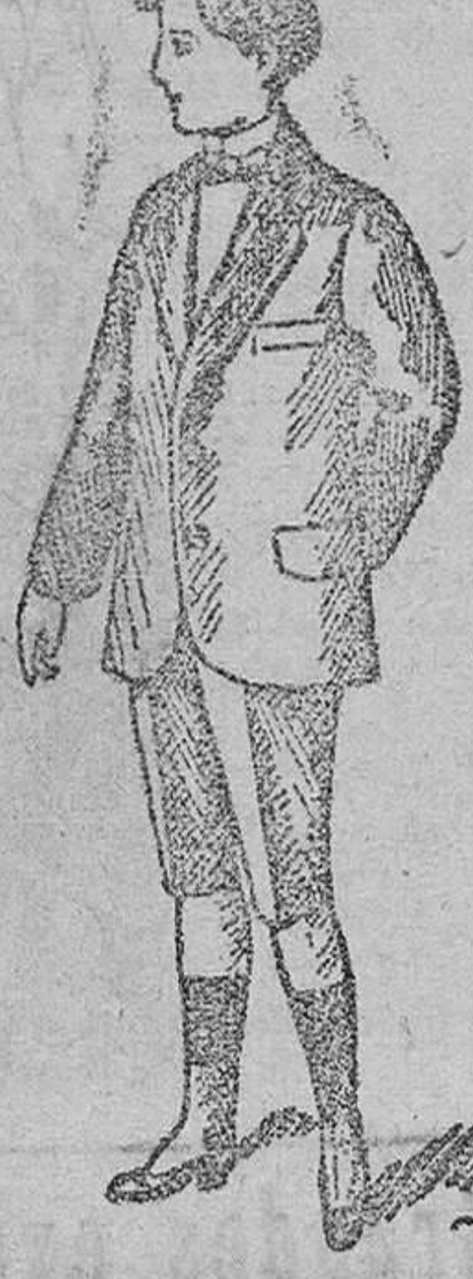
Trajecitos para juvenicos desde 25 á 50 pesetas.