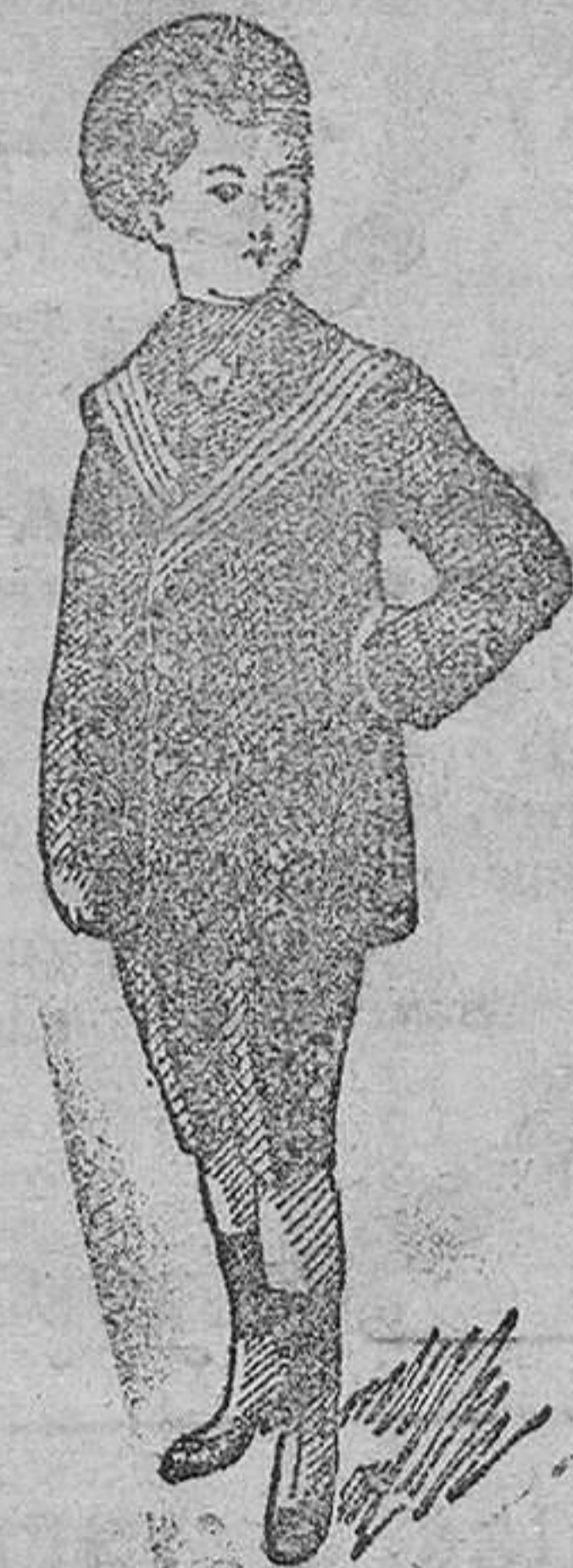
Trajés azules, ca-saca, desde 20 á 35 pesetas.