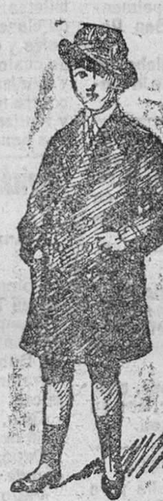
Gabancitos para jóvenes, forma novedad, desde 40 á 90 pesetas.