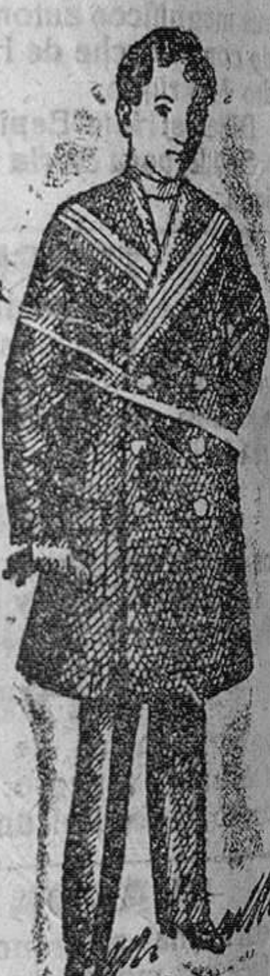
Mateos para niños, en vicuñas azul y negro, desde 25 á 50 pts.

LA CASA más surtida y que más barato vende en Burgos las camas y muebles es sin duda alguna