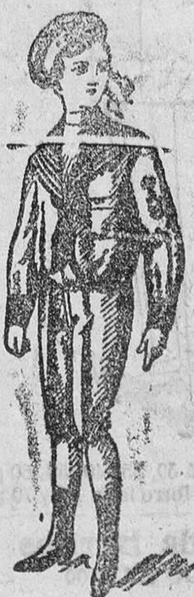
Trejeitos vicuña azul á 15, 17 y 20 pesetas.

Primera casa en confecciones de caballero, señora, niños y niñas