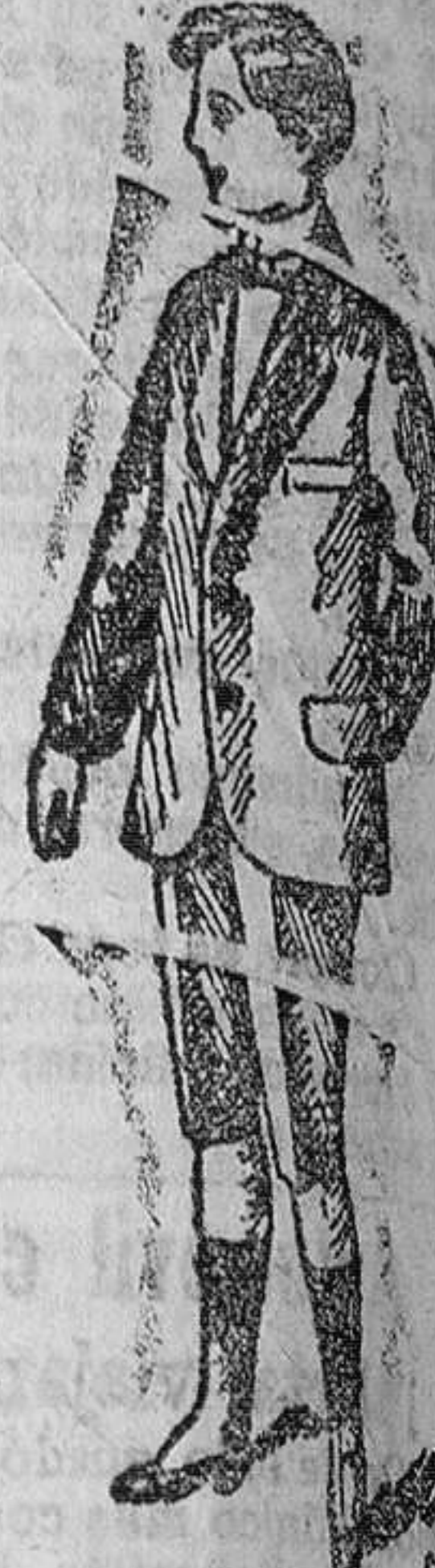
Trejeitos para jóvenes desde 25 á 30 pesetas.