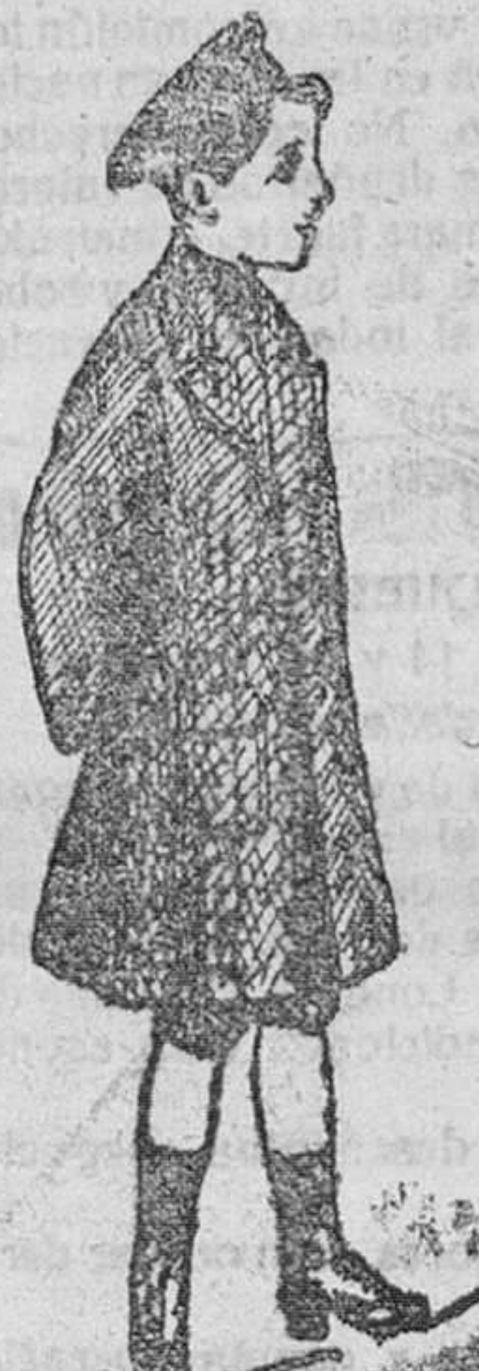
Abrigos de paño para niños, desde 20 á 50 pesetas.