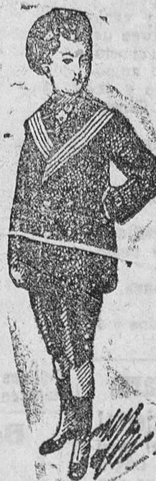
Trajes azules, casaca, desde 20 á 35 pesetas.