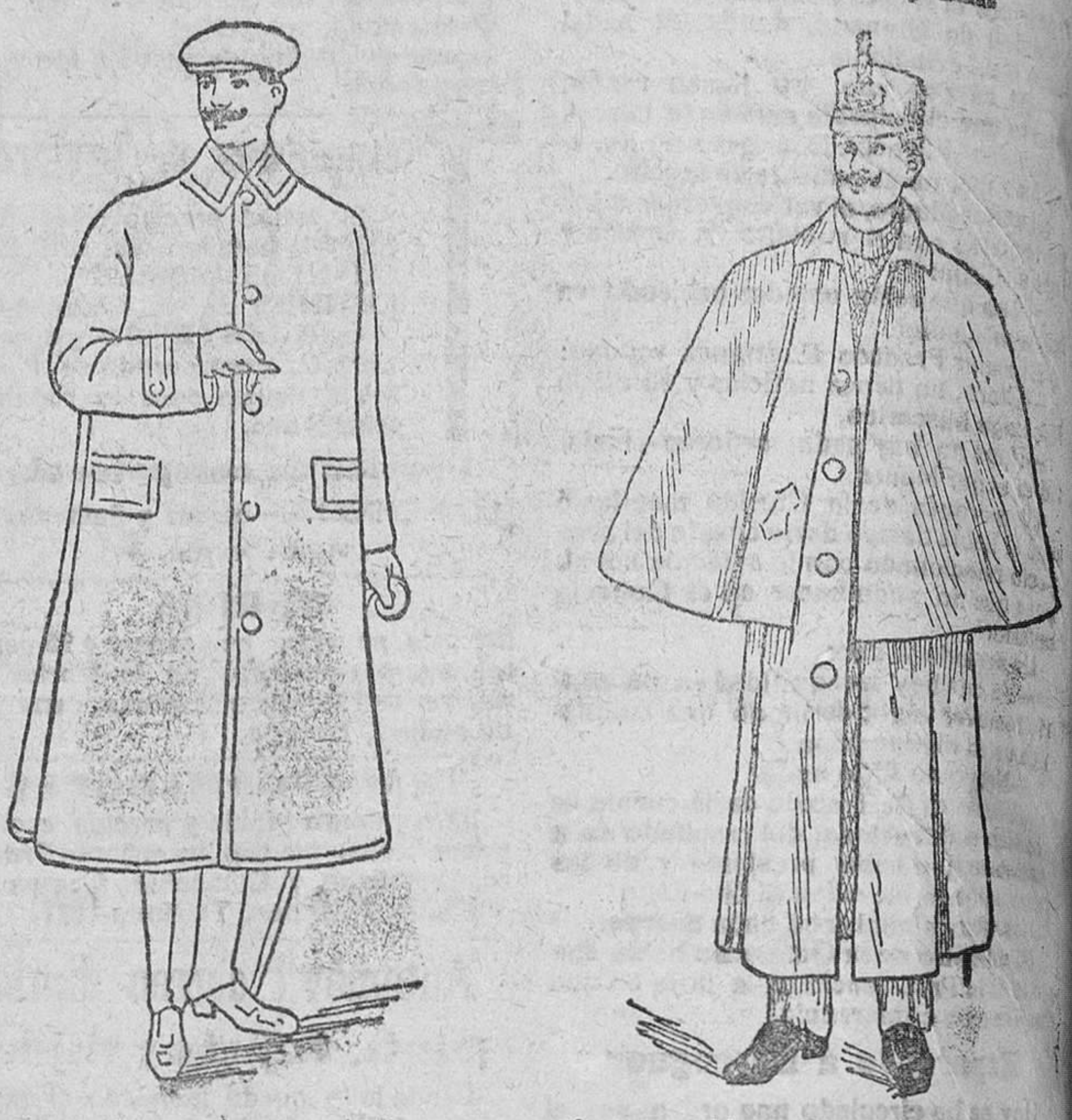
Impermeables ingleses y alemanes á 45, 50, 60, 70, 80, 90, 110, 120 y 125 pesetas.

Primera casa en confecciones de caballero, señora, niños y niñas