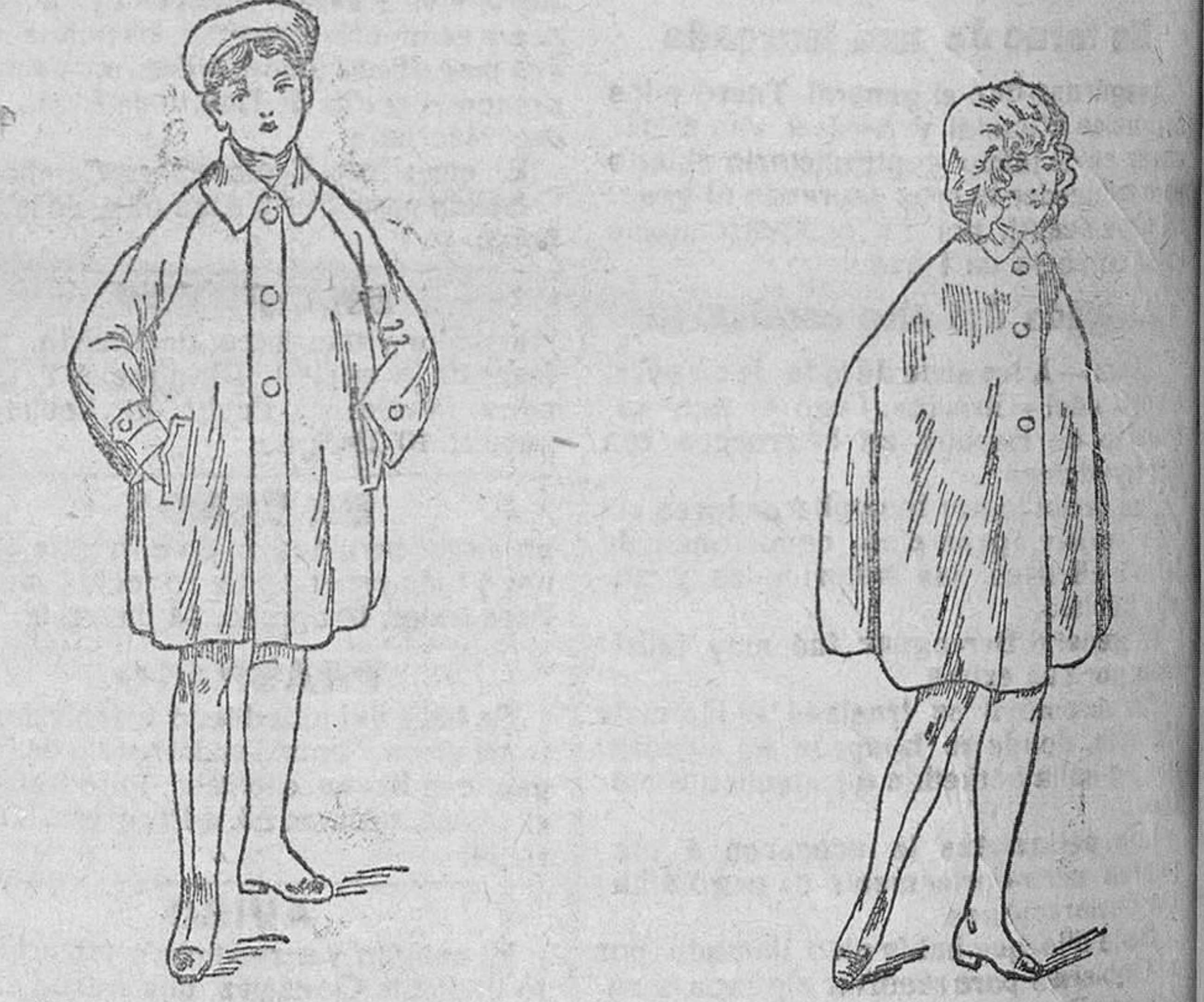
Abrigos impermeables para niños, desde 25 á 50 pesetas.