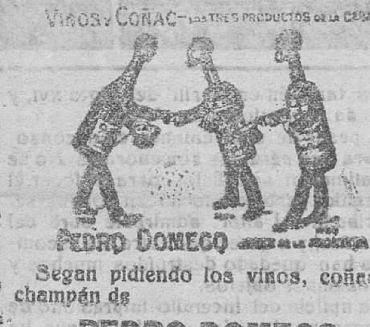
Según pidiendo los vinos, coñacs y champán de PEDRO DOMECO.

Dirección del viento.—A las ocho de la mañana, S; á las cuatro de la tarde, SO.