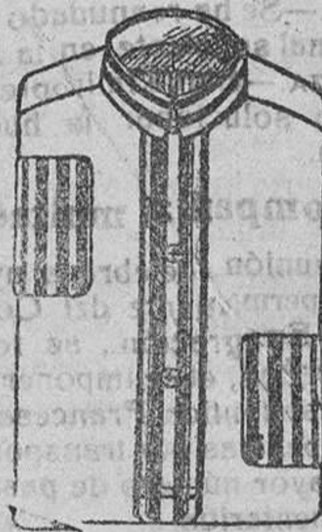
Camisas percal, á 8, 9 y 10 pesetas.

Depósito de las sandalias «Paco», con piso de goma, propias para invierno, y de las máquinas de escribir NOISELESS, completamente silenciosas.