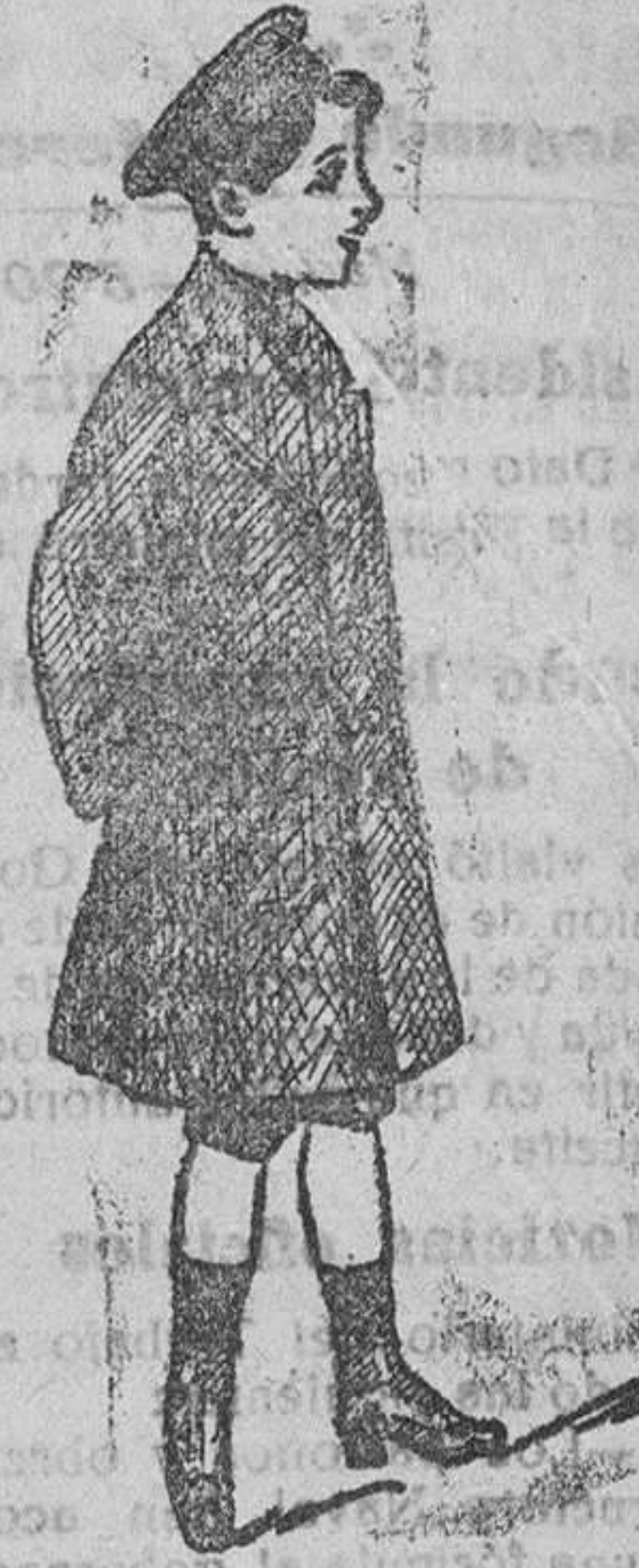
Gabén de paño melton á 25, 30, 40 y 50 ptas.