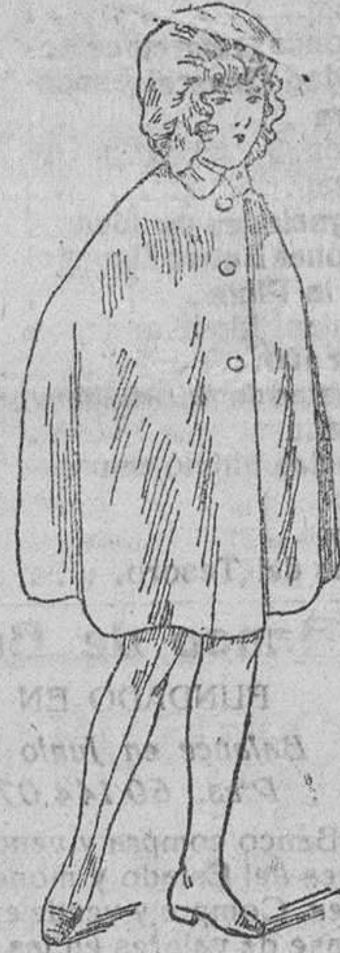
Capites impermeables, á 10, 12, 15, 20 y 30 ptas.

Plaza Mayor, 42, y Lala-Calvo, 9. Teléfono núm. 88. - Burgos PRIMERA CASA EN CONFECCIONES