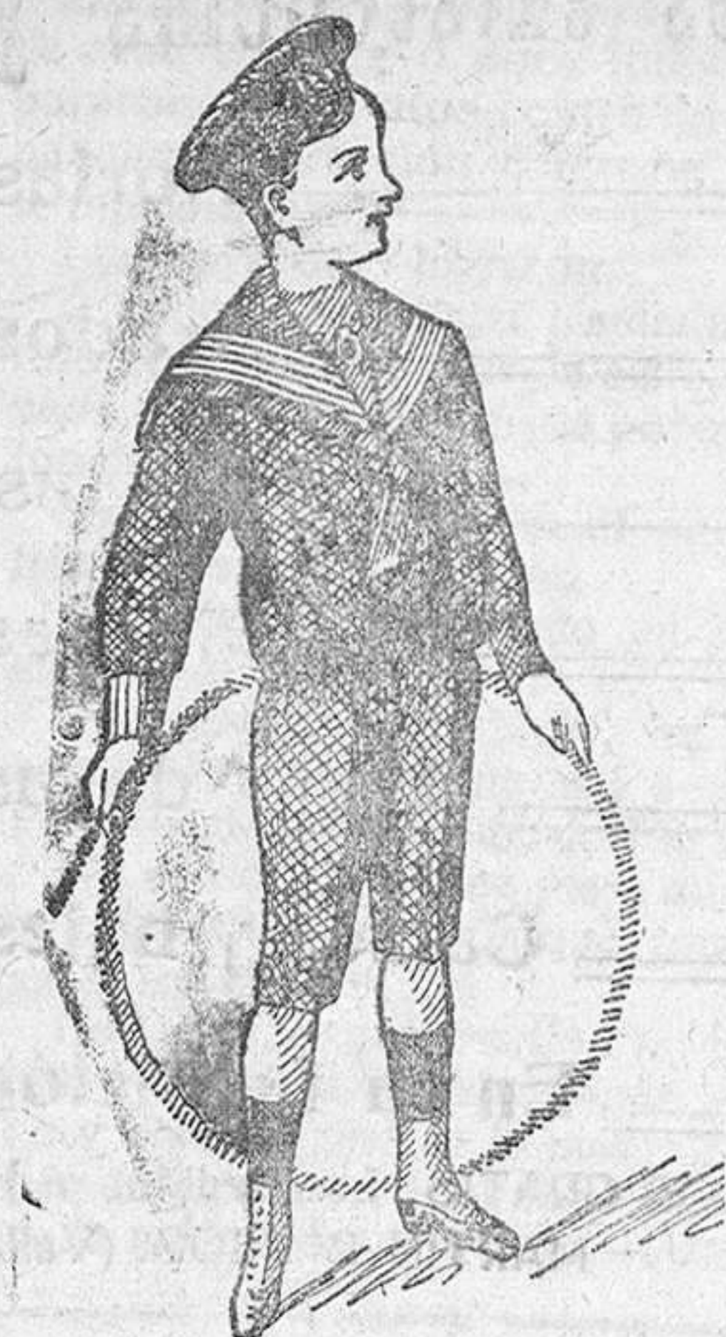
50 modelos diferentes en trajes-citos de niños, en paño, jergas, vicuñas y panas.