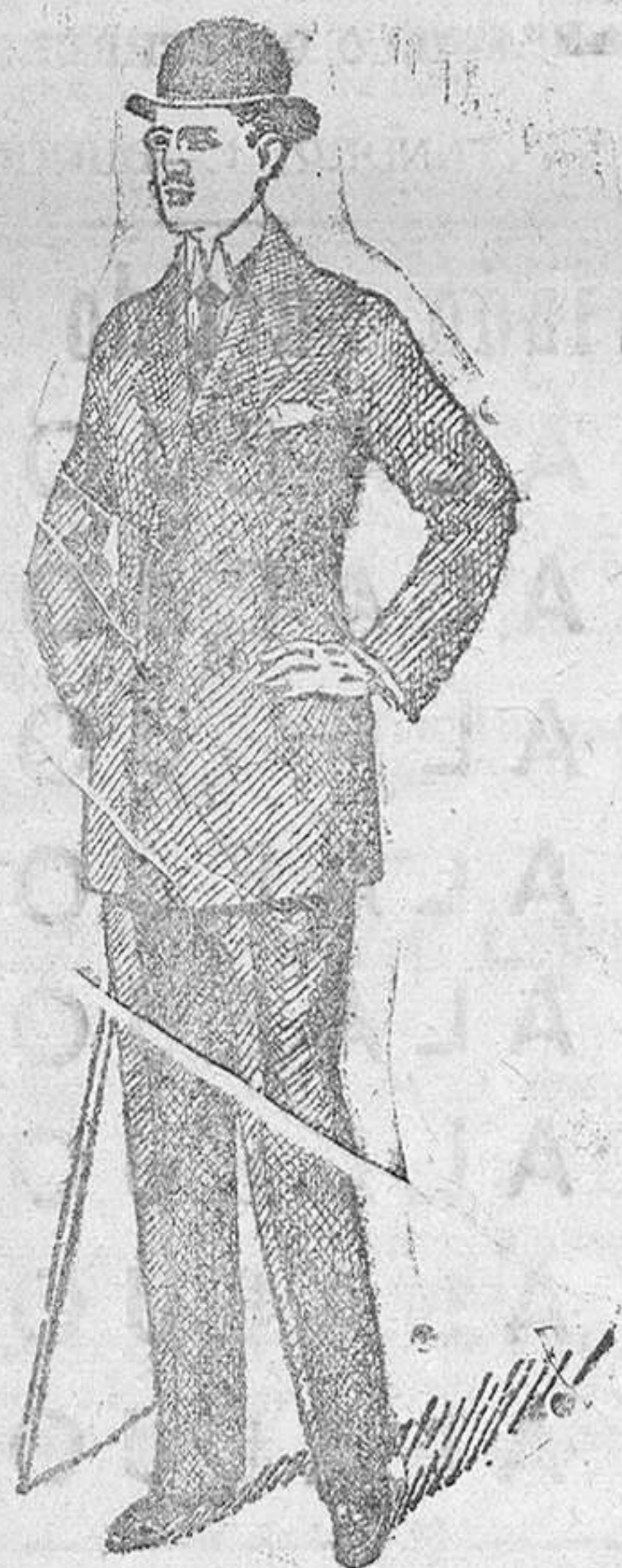
Trajes paño de 30 á 70 ptas. pana de 25 á 60 dril de 20 á 35

Esta casa es la única que presenta siempre grandes surtidos en tejidos y ropas confeccionadas de caballero, señora, jovencitos, niños y niñas.