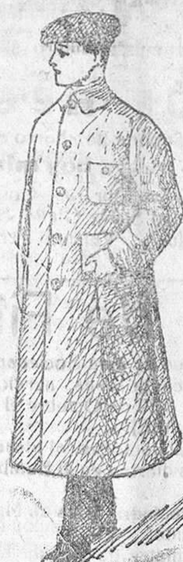
Guardapolvos de caballero, señora, jóvenes y niños á 6, 7, 8, 10 y 15 pesetas.