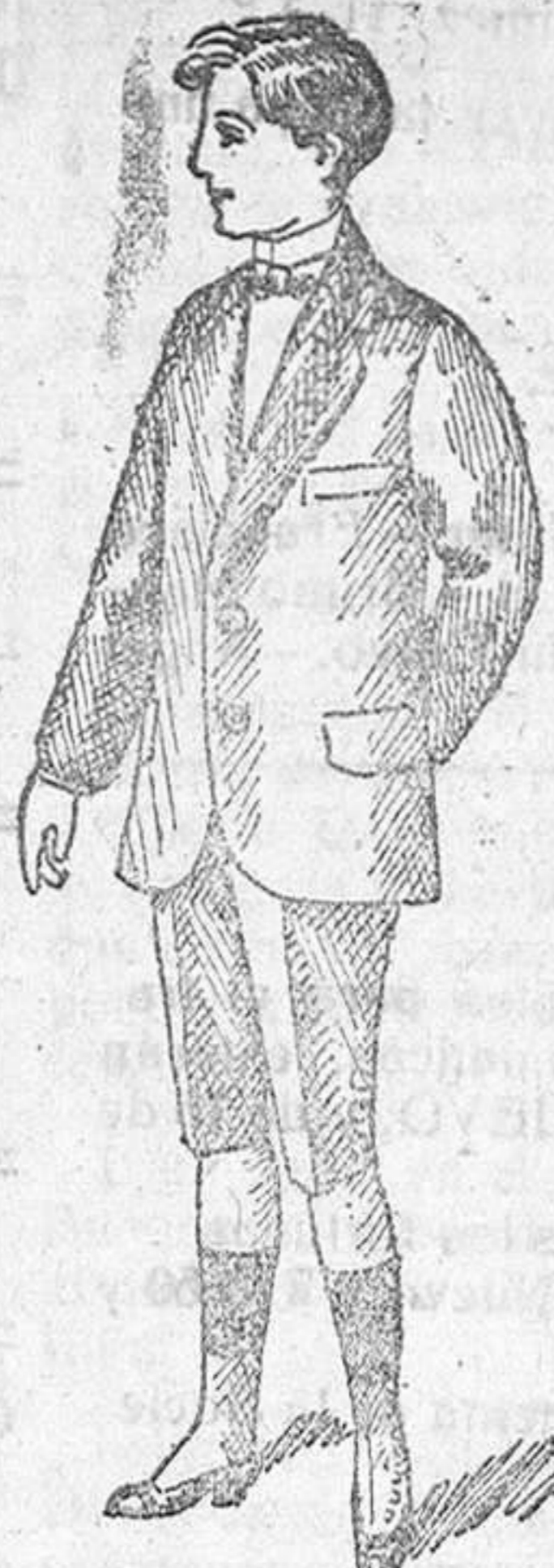
Trajecitos para jóvenes, en americana cruzada y sin cruzar, á 20, 25, 30, 35 y 40 pts.