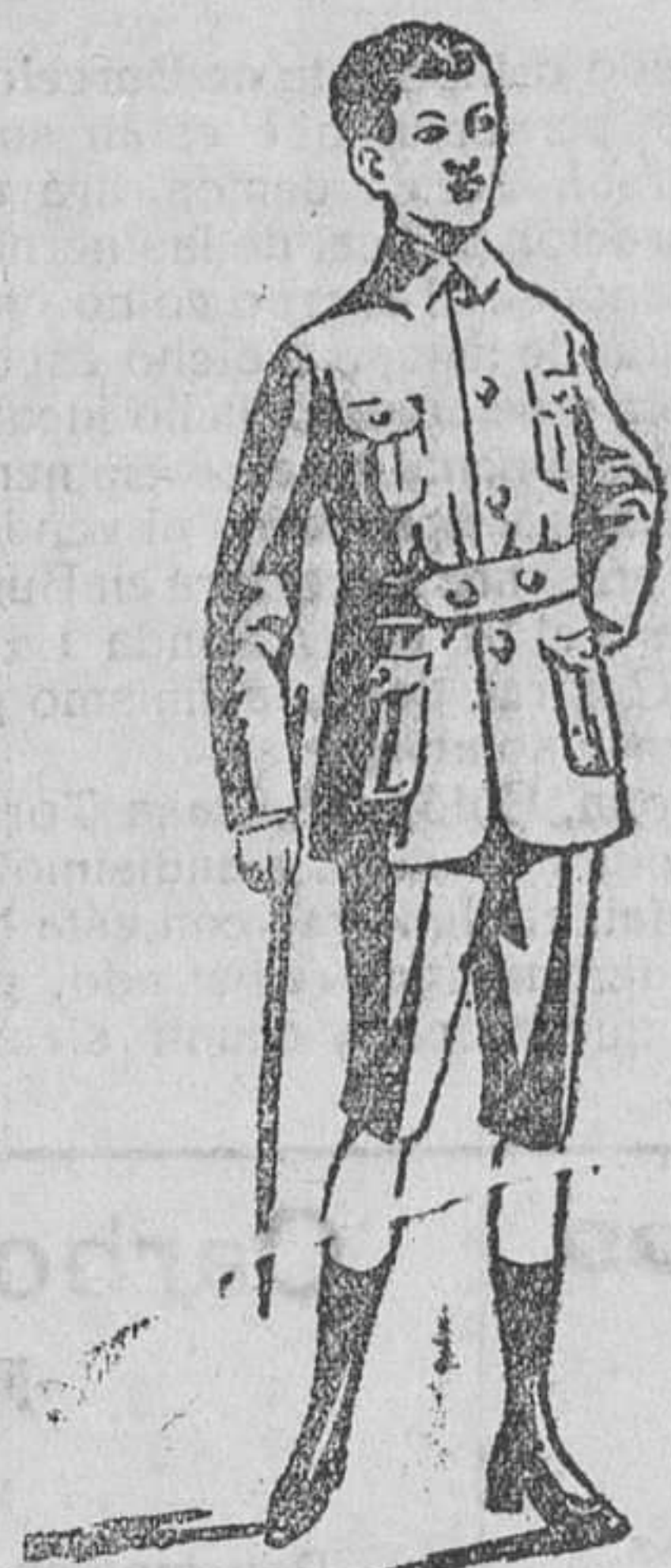
Trajecitos sport, en paño y pana

Trajes para jovencitos, en paño y pana, á precios muy baratos.