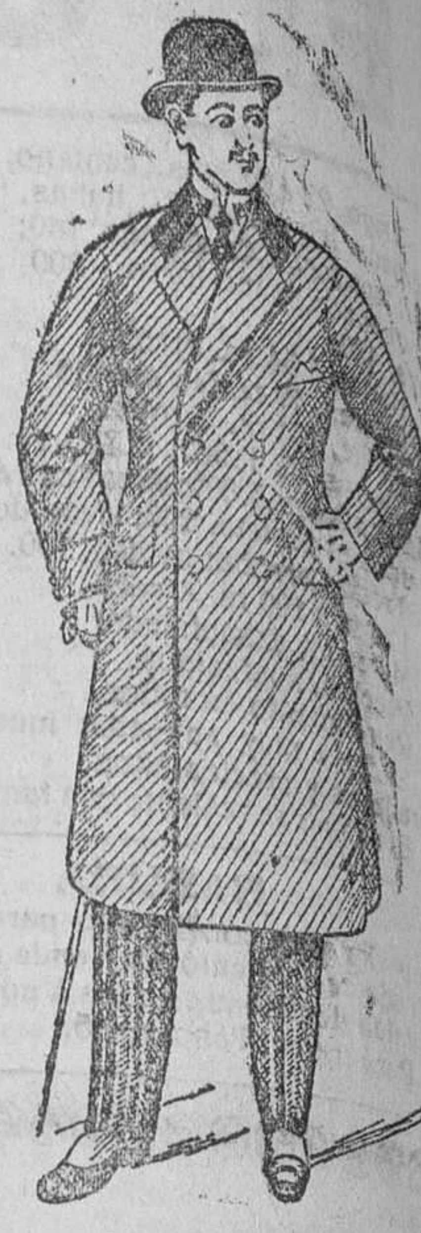
Gabanes desde pesetas 30 á 125

En forma entallada, hay seis modelos diferentes, á 80 ptas.