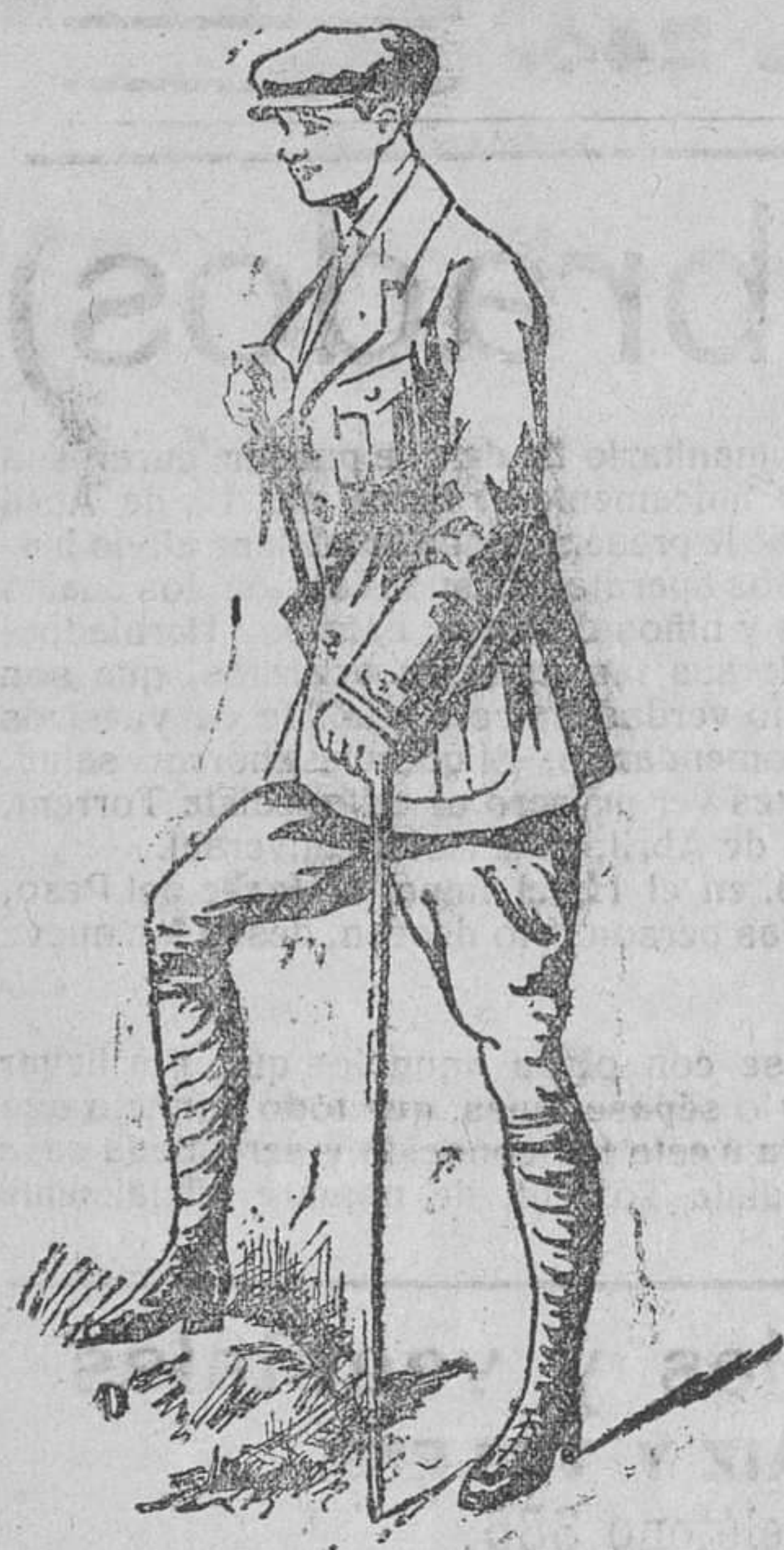
Traje sport, en paño y pana

Unica casa que presenta grandes surtidos en tejidos y ropas confeccionadas de caballero, señora y niños