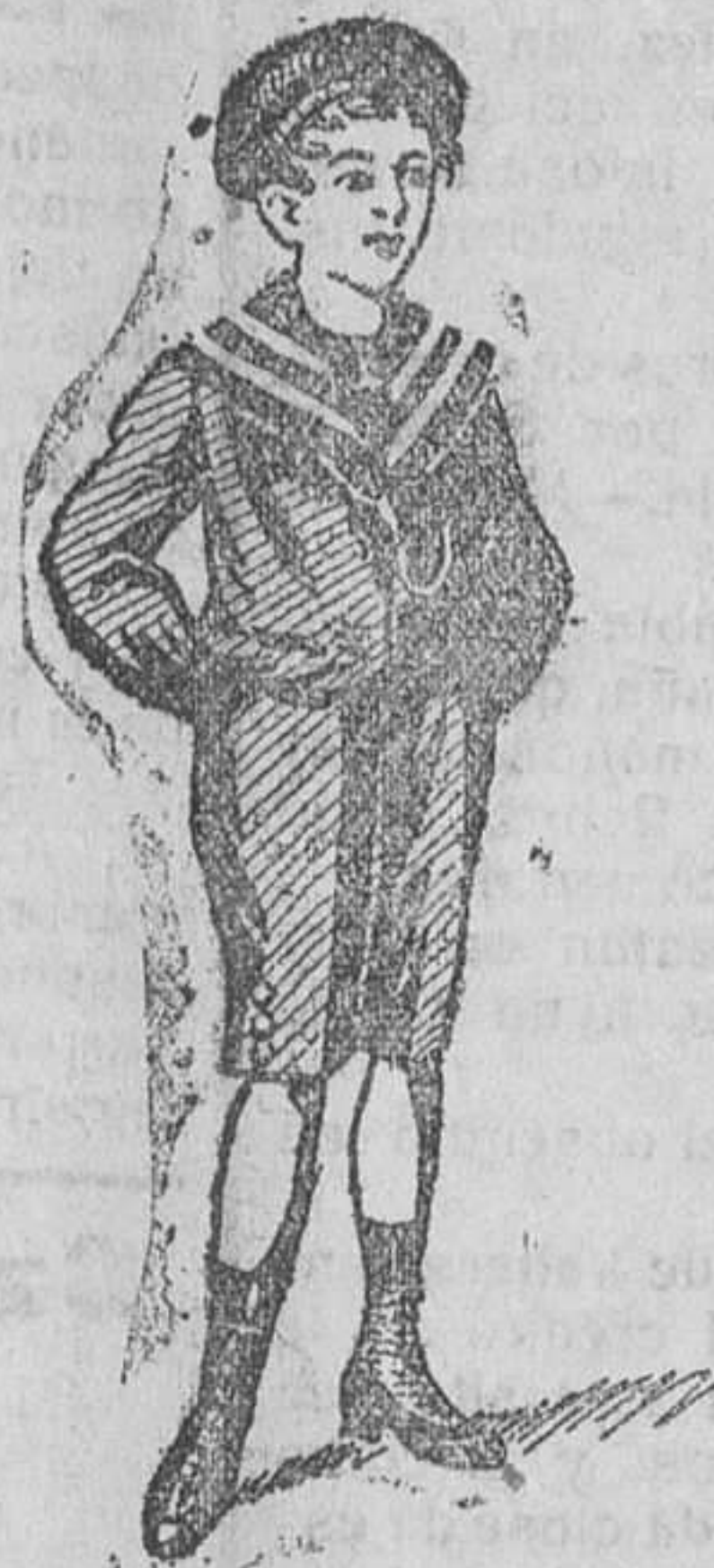
Trajecitos en paño, pana, gerga y dril

Abrigos niña, con cuello piel, á 15 y 25 pesetas.