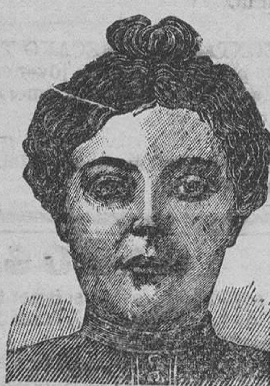
A los 15 días de tratamiento