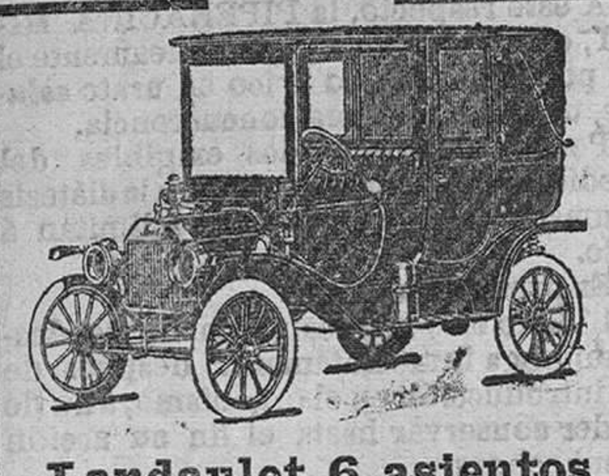
Landulet 6 asientos

De venta en todos los buenos establecimientos y centrales de electricidad. A. E. G. Thomson Houston Ibérica, S. A.—Bilbao.