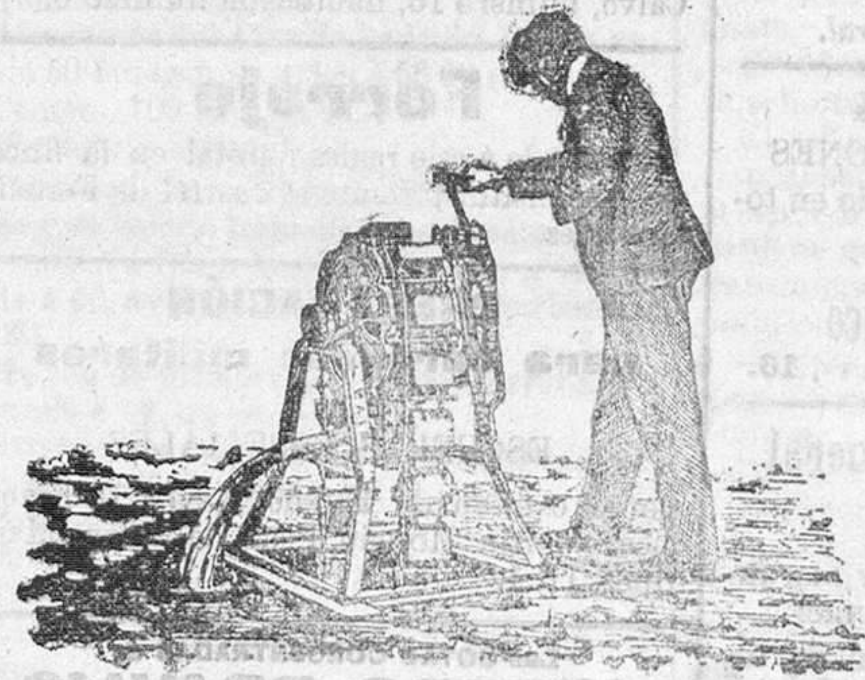
Noria de mano