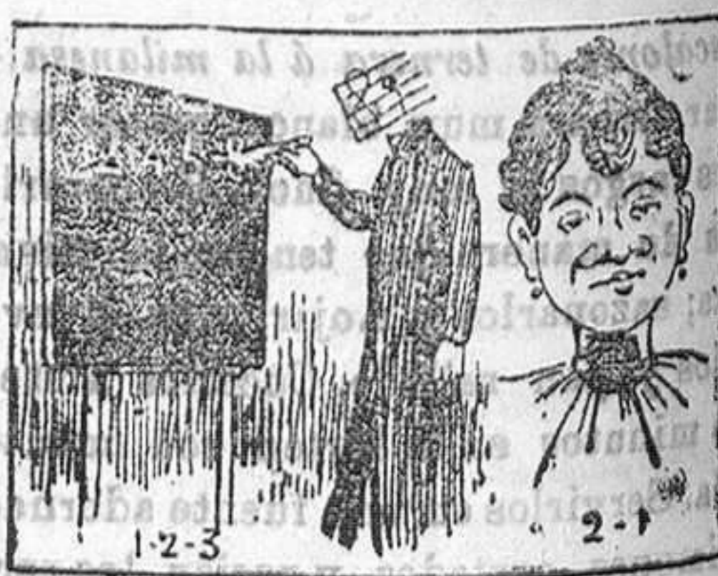
Solución á la anterior: Carrioché