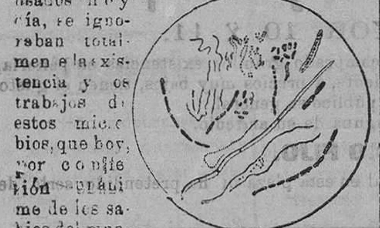
Varias formas de bacterias de la boca reconocidas como causantes de la descomposición y de la caries de los dientes.

El frasco (expulsador) de Olool cuesta pesetas 3,50, bastando su contenido para el consumo diario por espacio de algunos meses. Se halla de venta en todas las farmacias, perfumerías y droguerías. Único importador: Muller Hermanos, Barcelona.