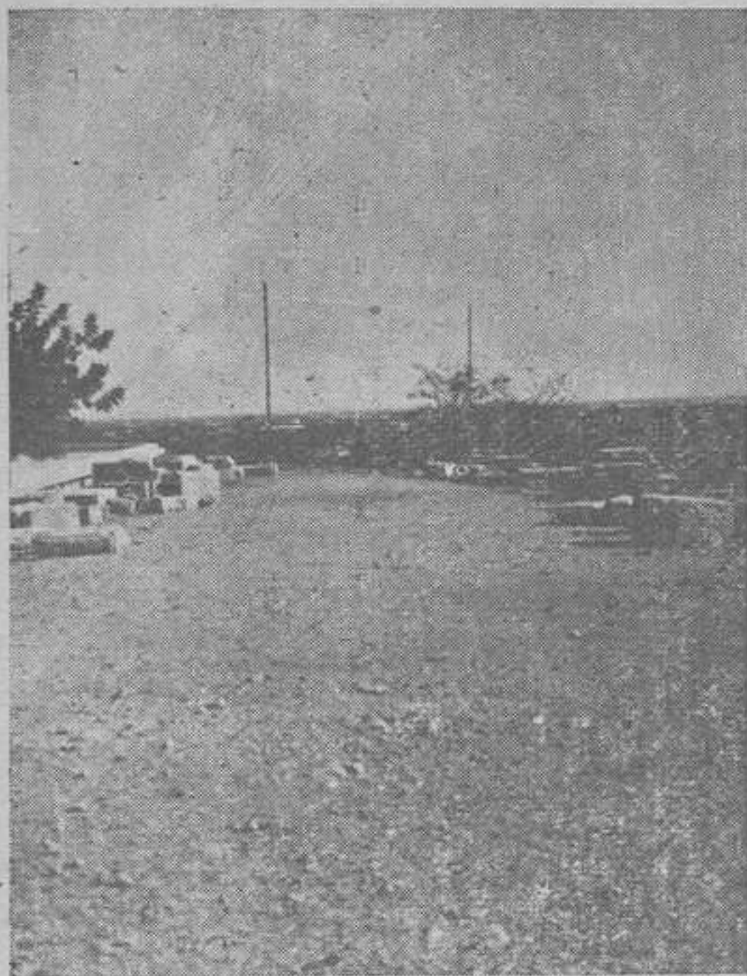
Restos del Calvario volado por los rojos los días 6 y 7 de agosto 1936