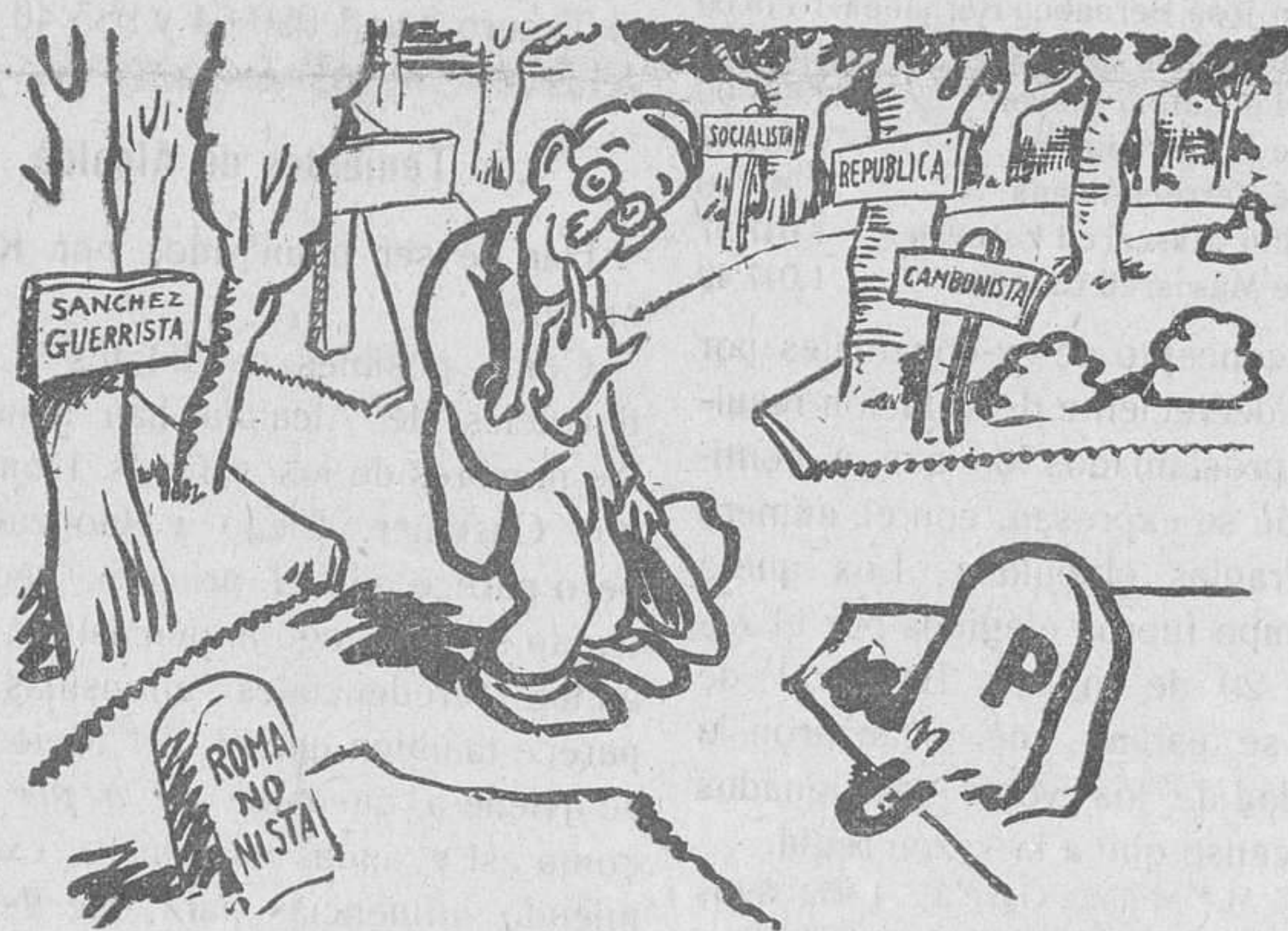
EL DE LA U. P.—¿Que por qué camino iré? Ya sé: por el camino de los que ganan.

Queremos que el país sepa cómo administraban los upistas y para llegar a esas informaciones hay que suprimir el obstáculo de que puedan mediatizarlas los mismos interesados cuya conducta deseamos enjuiciar.