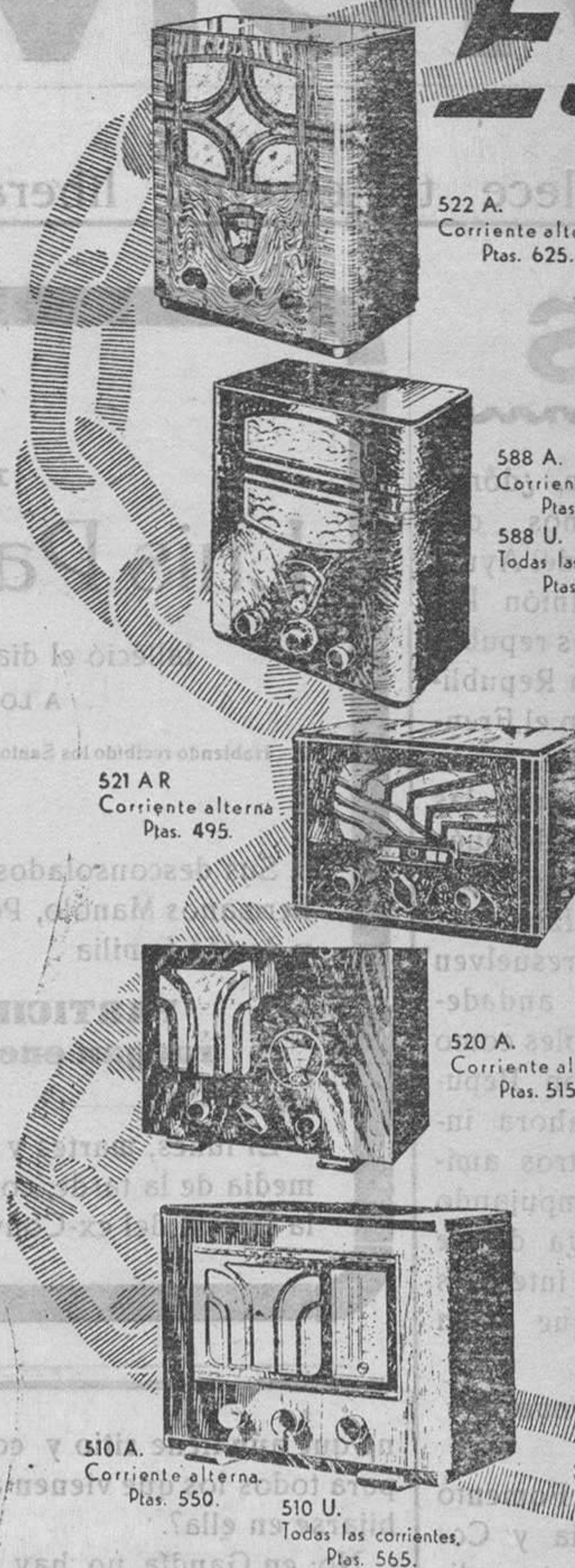
522 A. Corriente alterna Ptas. 625.