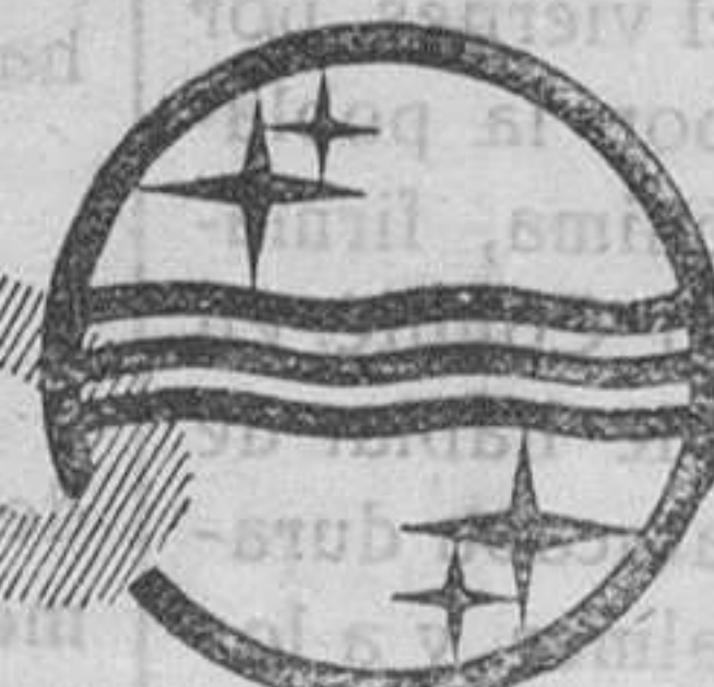
510 U. Todas las corrientes. Ptas. 565.