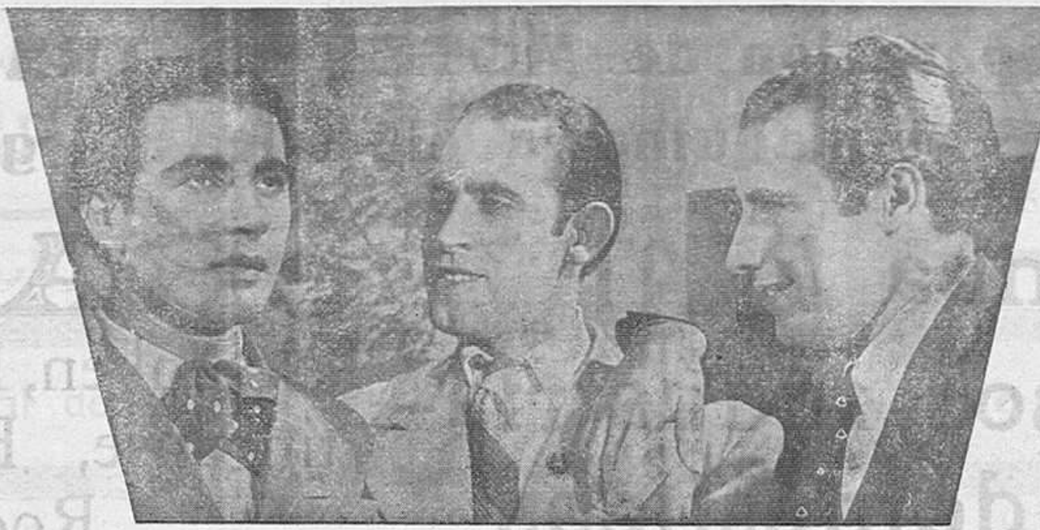
Una película española interpretada y musicada por el famoso TRIO.