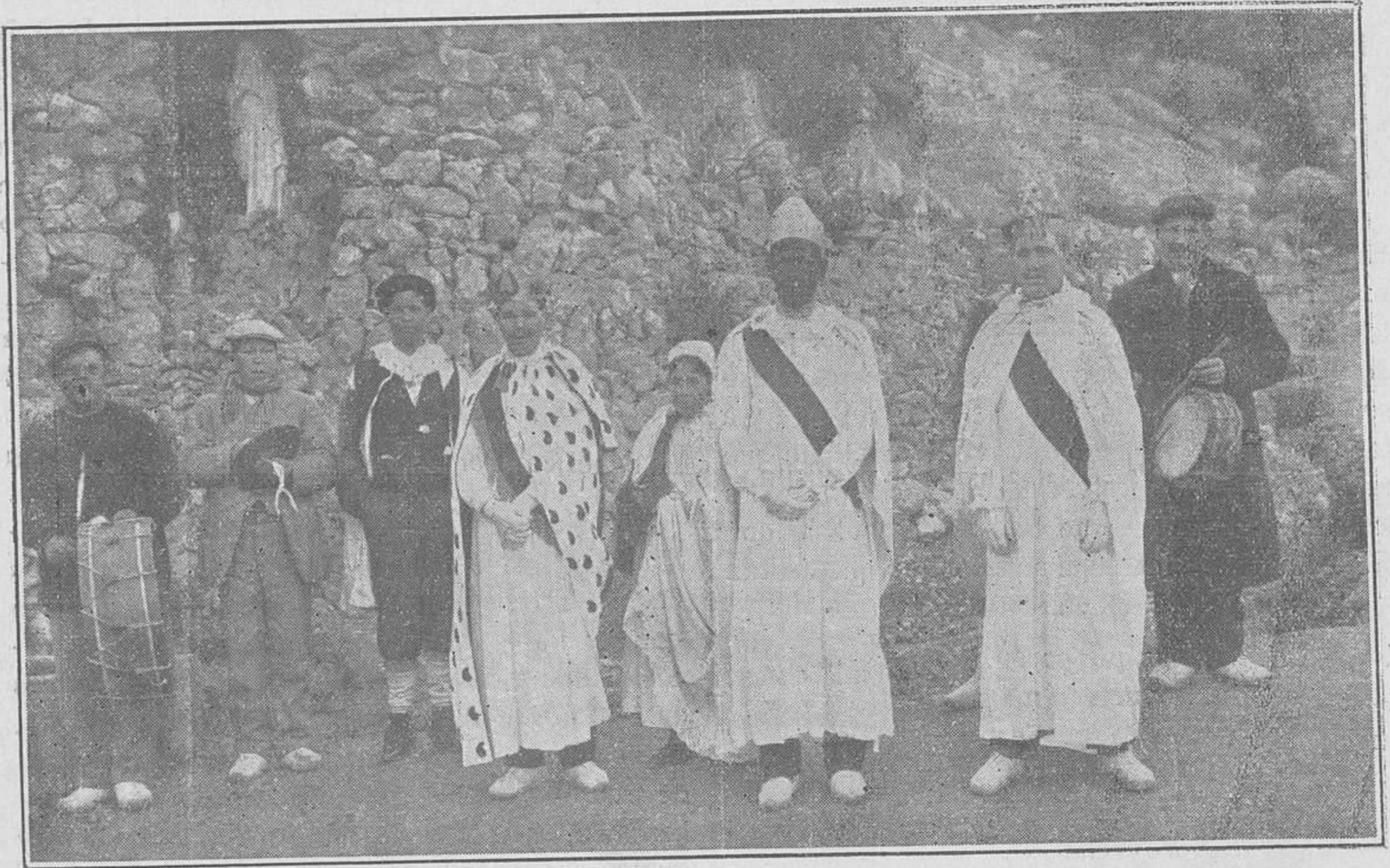
Los Reyes Magos de Fontilles con sus Pajes y la música que les acompaña

El día de San Antonio, 17 del corriente, hubo algún viso de fiesta; pues aunque no hubo en la Iglesia nada de particular, como era nuestro deseo de hacer fiesta, para conmemorar el día que se abrió el Sanatorio; sin embargo, los pobres enfermos no pudieron dejar pasar dicho día sin hacer ninguna demostración de alegría y regocijo. Y cogiendo los instrumentos, hicieron sus pasacalles. Por la noche, juntando el combustible que pudieron, hicieron una hoguera y estuvieron alrededor, tocando y divirtiéndose cuanto pudieron. Por lo demás, gracias que aún quedaba turrón de Navidad, para poderles dar postre. Y con ésto, tuvieron los pobrecitos un poco de alegría.