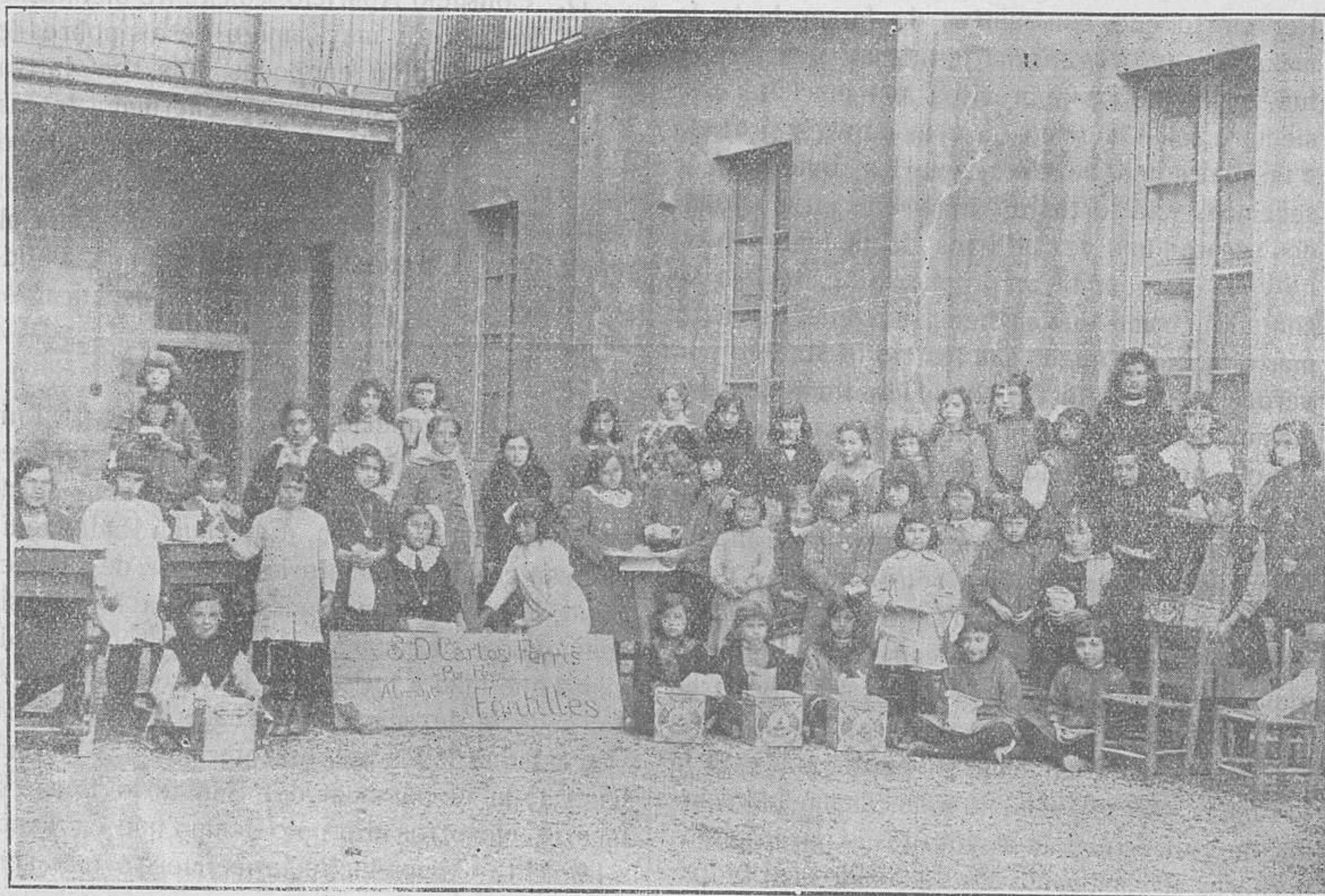
Las "parvulitas" del Colegio de la Casa de la Caridad, de Manresa, preparando el aguinaldo para sus queridos amigos los leprosos de Fontilles

Pues ¿qué diré del día de San Antonio? En este día se cumplía el sexto aniversario de la inauguración del Sanatorio, es decir, del día que llegaron aquí las Hermanas y los primeros enfermos, los cuales se iban confesando a medida que llegaban, y al día siguiente oímos todos misa y recibimos juntos la Sagrada Comunión des-