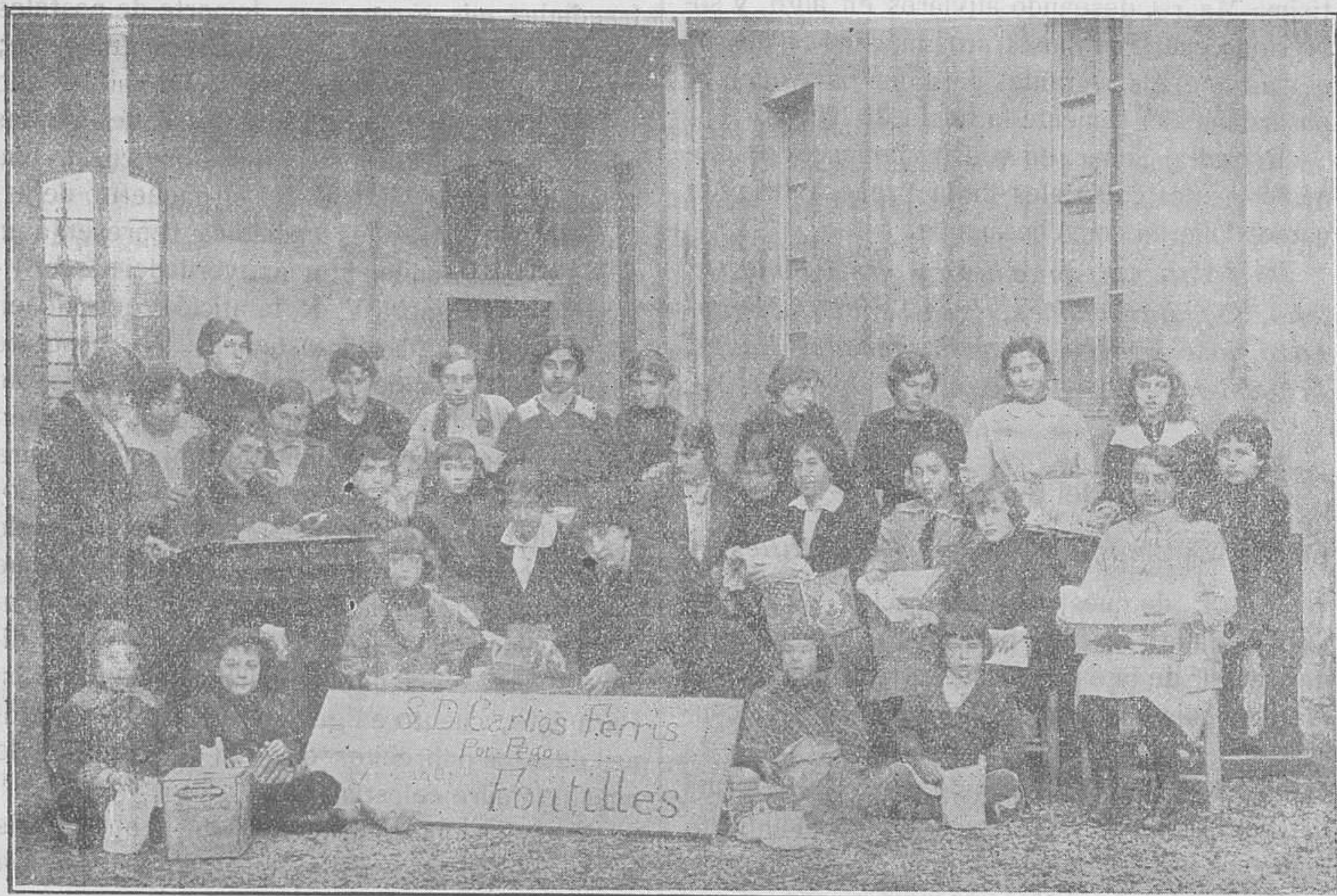
Las alumnas del Colegio de la Casa de Caridad, de Manresa, preparando el aguinaldo para sus queridos amigos los leprosos de Fontilles

las cuales junto con las cajas de los objetos, nos han enviado dos grandes fotografías donde están todas ellas, sacadas en el momento mismo de arreglar el cajón; ¡qué cuadro más tierno y hermoso! ¡Madre y hermanas! nos dijimos unos a otros, al descubrirlo: ¡qué cosa tan graciosa! Todas las niñas aparecen con sus regalitos en las manos, esperando que les toque el turno para depositarlos en la caja, mientras algunas mayores los están arreglando con sumo cuidado y extraordinario interés, y están todas tan graciosas que ya no les cabe más.