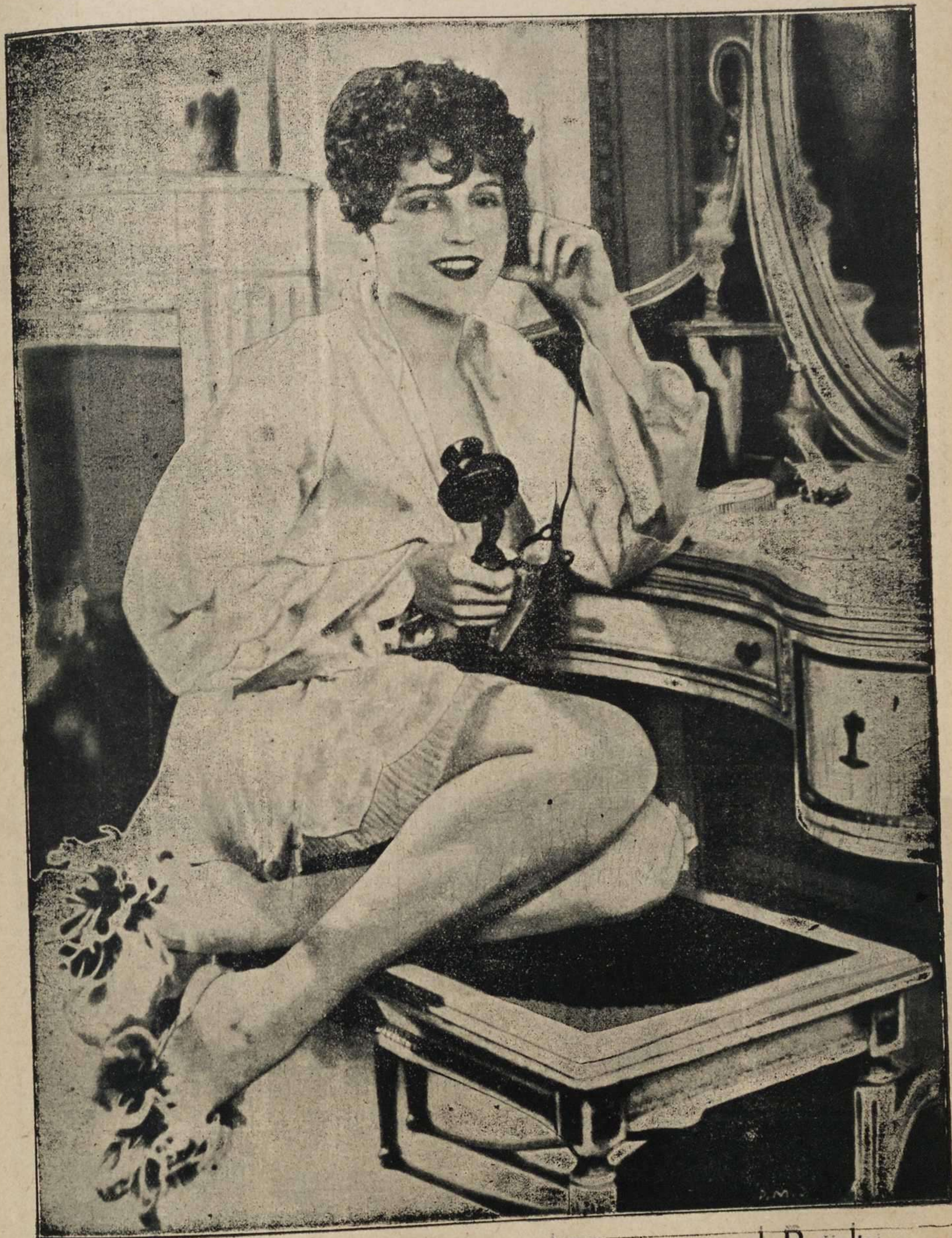
SUE CAROL.-Famosa artista que admiraremos en el Royalty, en la próxima temporada.