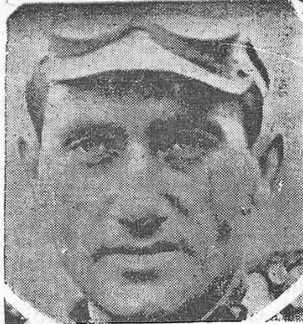
HENRI PELISSIER Ganador de la Vuelta a Francia en 1923.