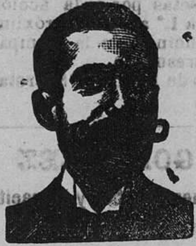
A. SALVATI COSTANZI Calle Diputación, 435

ó inyección antivenérea COSTANZI y Roob antisifilítico