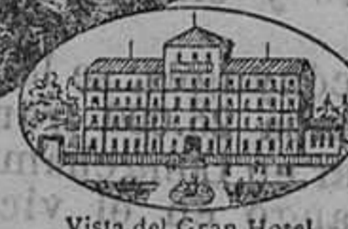
Vista del Gran Hotel

ALCEDA PROVINCIA DE SANTANDER - ESTACION DE RENEDO