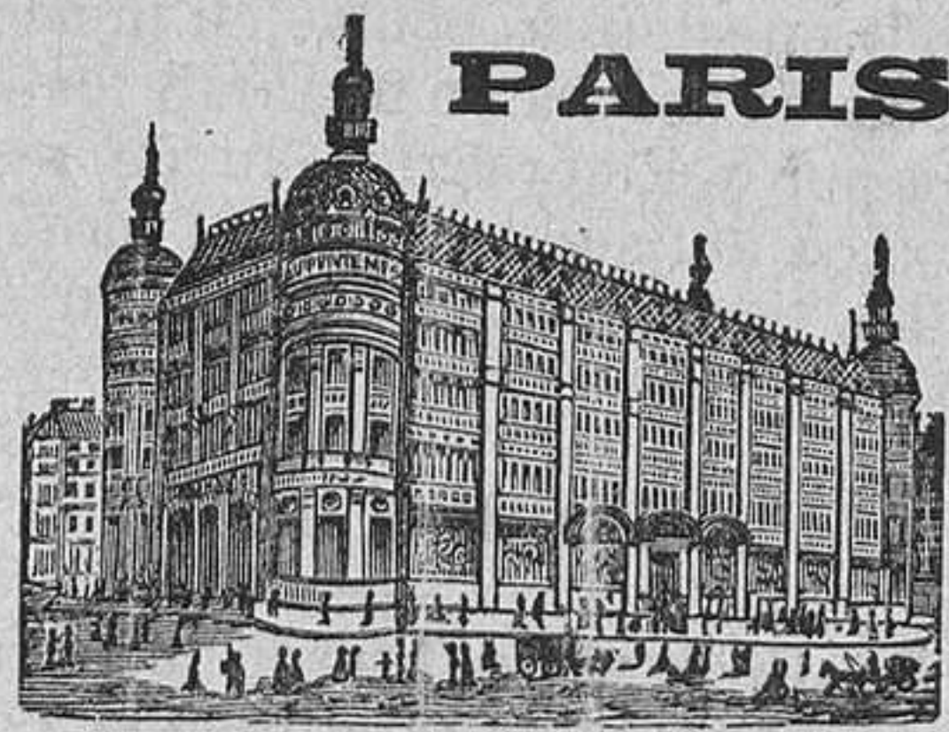
GRANDES ALMACENES DEL

EN VENTA: Al por mayor, Farmacia del Autor, PLAZA DEL PINO, núm. 6 Barcelona, en Santander; Dionisio Erasun, y en todas las principales Farmacias de España y Américas.