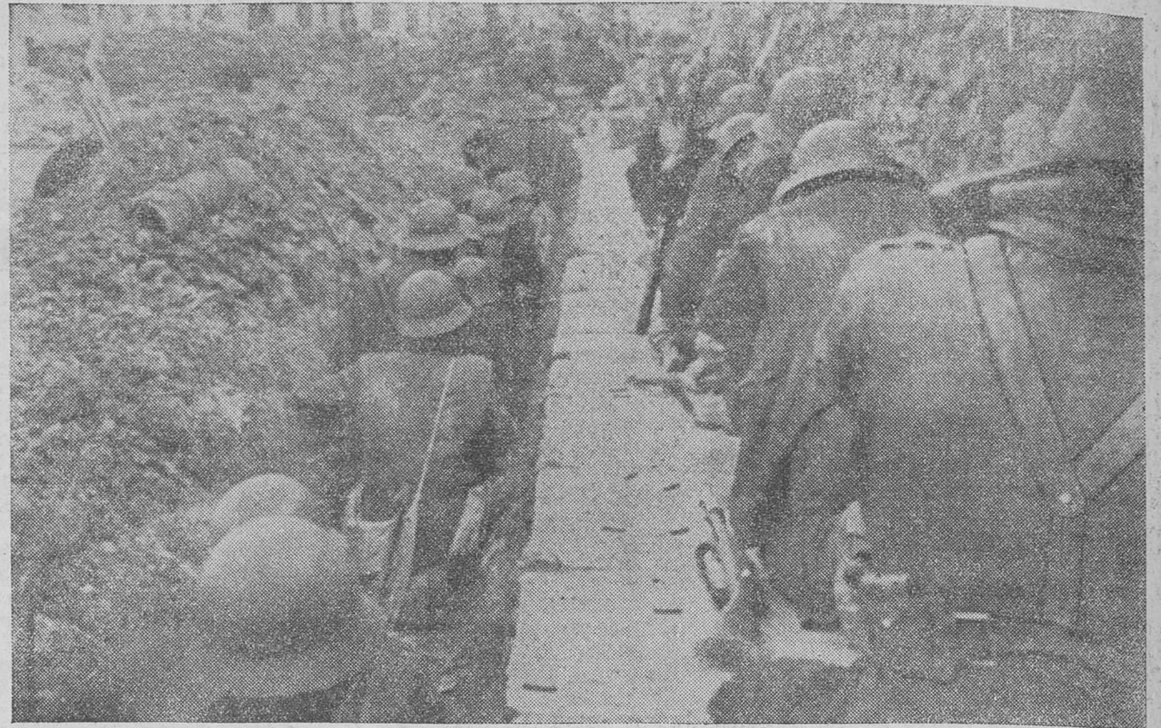
LA OFENSIVA EN OVIEDO. — Los soldados republicanos, con el arma calada a la bayoneta, avanzan por las trincheras, dispuestas las bombas de mano para asaltar unas posiciones.