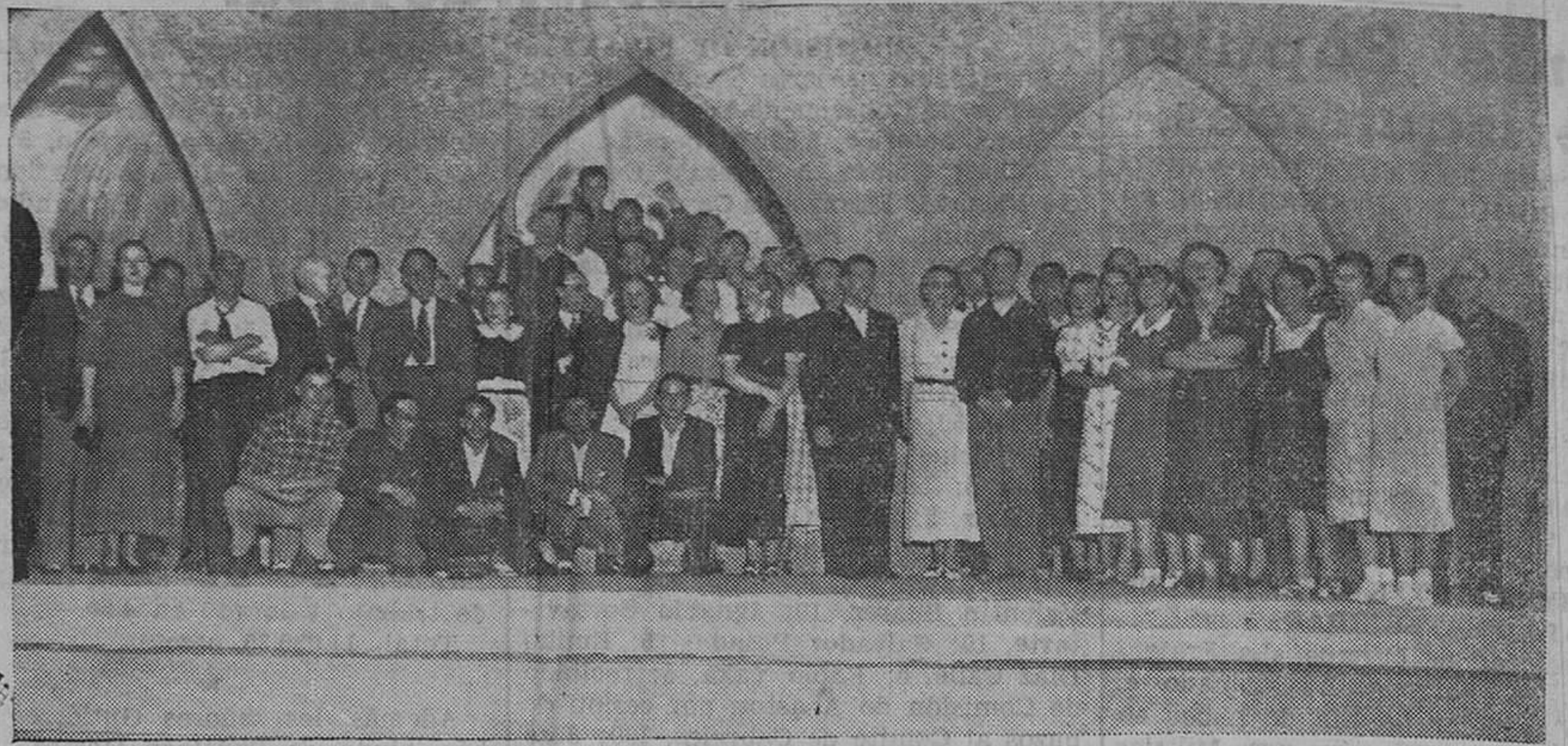
DE UNA FUNCION A BENEFICIO DE LAS MILICIAS. — La compañía de Artigas-Collado con la Junta directiva de la Agrupación de Trabajadores del Municipio y otros elementos organizadores de la brillante velada que con ese plausible fin se representó en el Coliseo María Luarda con un éxito sin precedentes.

El lunes, 7 de septiembre, según nos dijo el señor Castillo Bordenabe, empezará el derribo de la casa donde es-