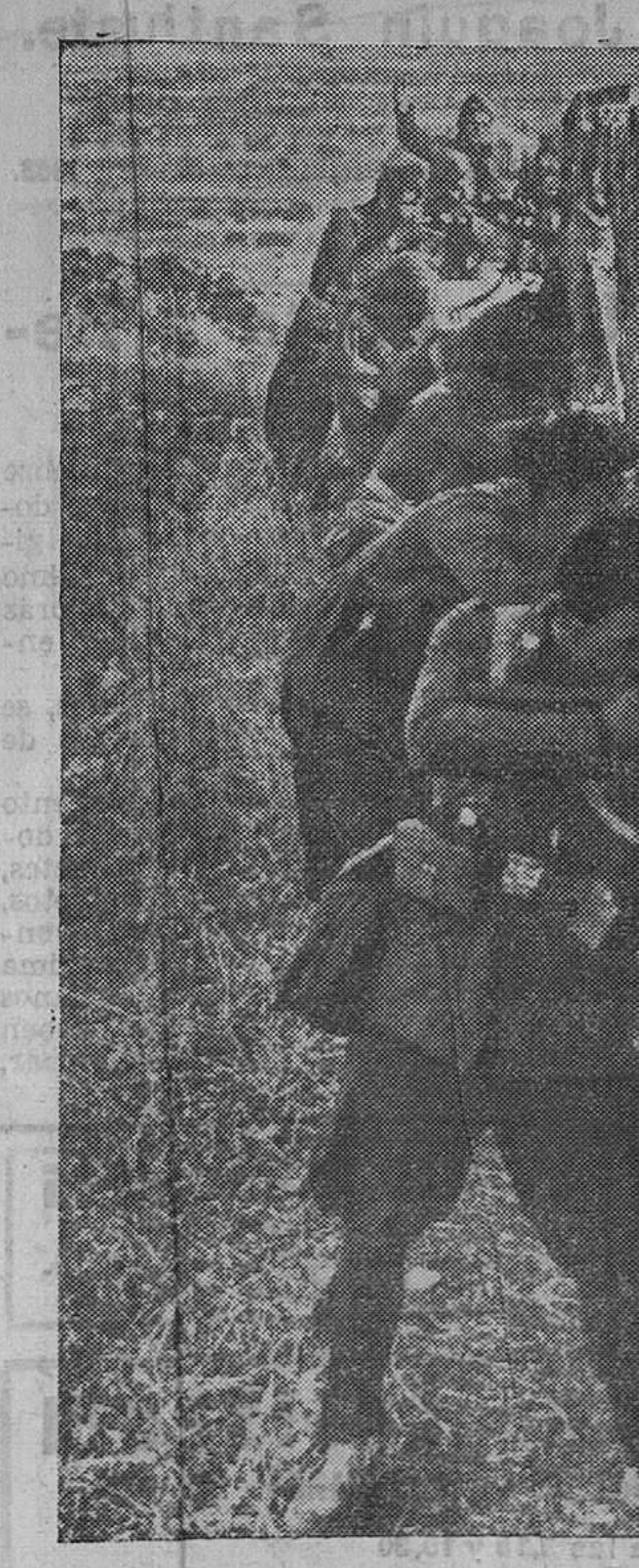
EXTREMADURA, ESCENARIO DE LOS TRAIADORES A LA PATRIA. Ruta elegida como salida de su encierro por los militares y fascistas de Andalucía ha sido Extremadura, por donde querían establecer contacto con supuestas columnas que su desesperada situación les hacía suponer bajaban de la zona Norte. Las fuerzas auxiliaadoras con que contaban están sitiadas en sus reducidos y en plan avanzado de sumisión. Pero aun así, estas tropas enviadas, de las que eran principal conjunto los rifeños y legionarios, han sufrido una tremenda derrota, y sus restos andan dispersos y perseguidos, sin esperanza posible de salvación. He aquí a un grupo de leales disparando tras las murallas del castillo de Medellín contra las partidas en fuga.