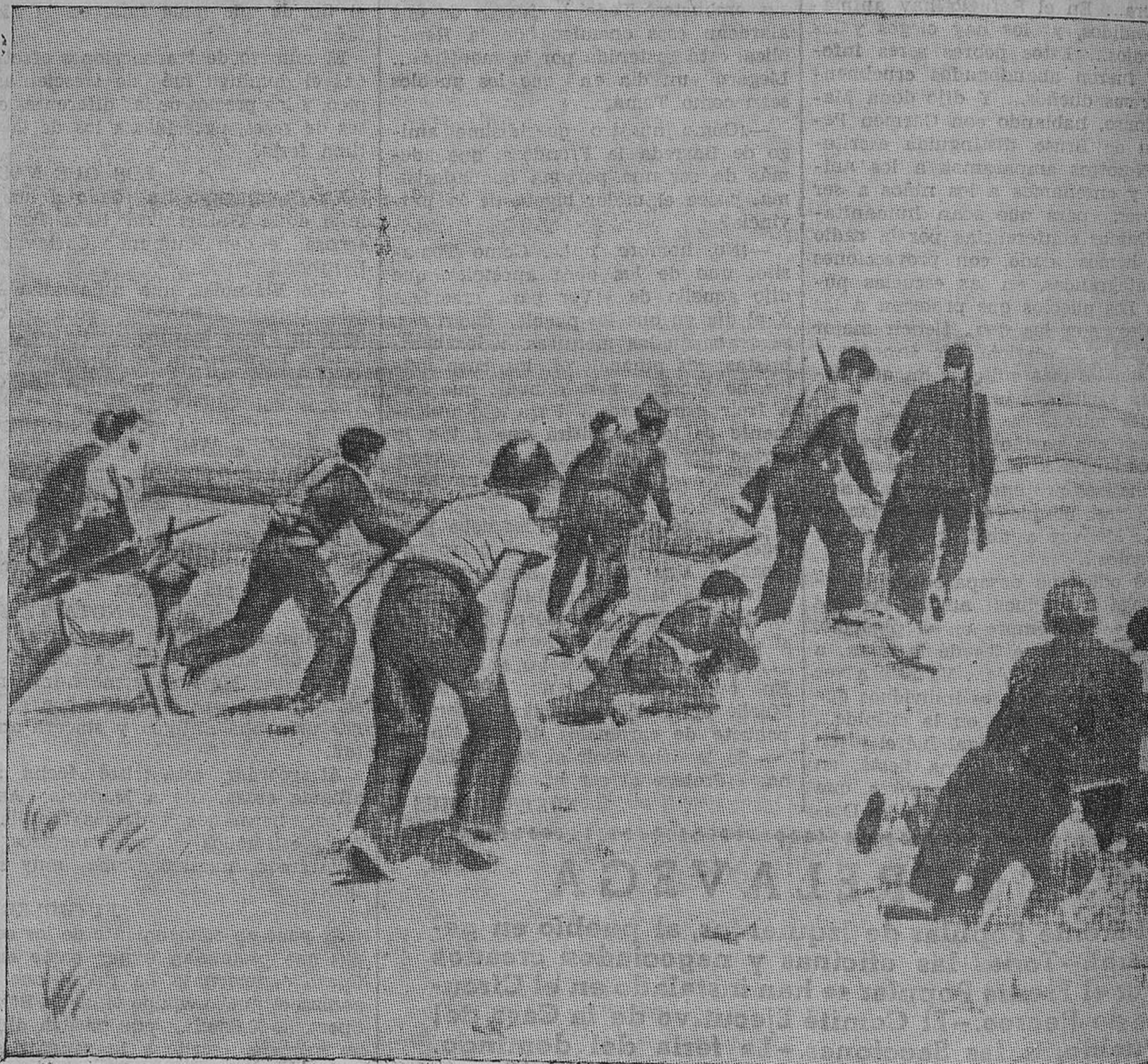
Al abrigo de una cresta, un grupo de valientes milicianos avanza con objeto de reforzar estratégicamente la línea de fuego.