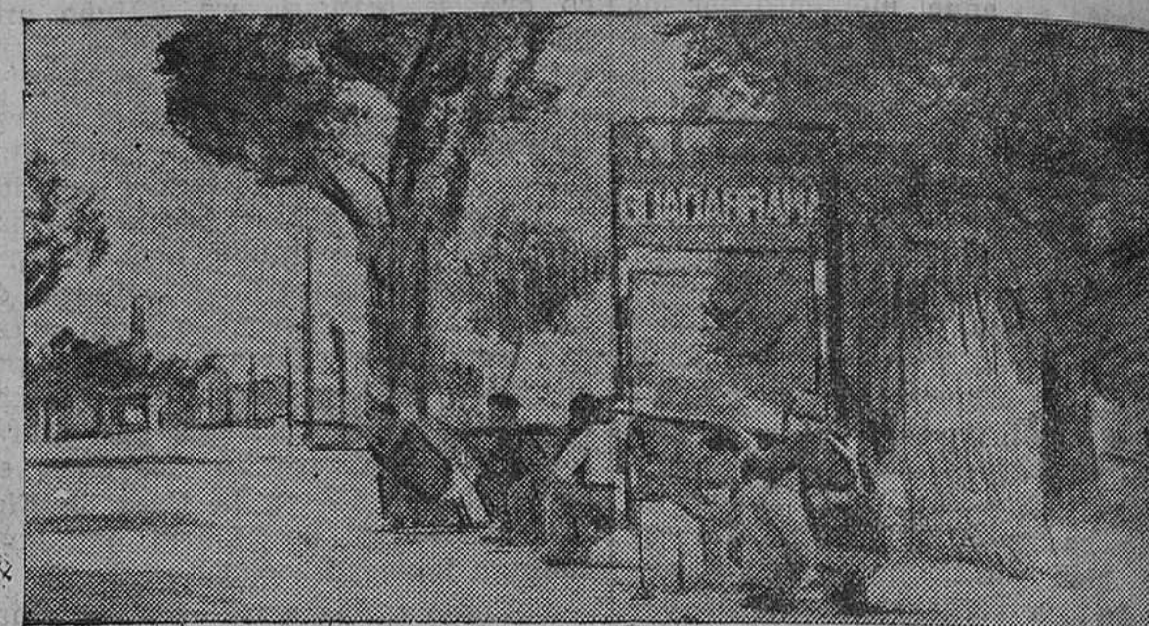
A la salida del Guadarrama, los bravos milicianos tiran sobre los rebeldes, que se batan en retirada.