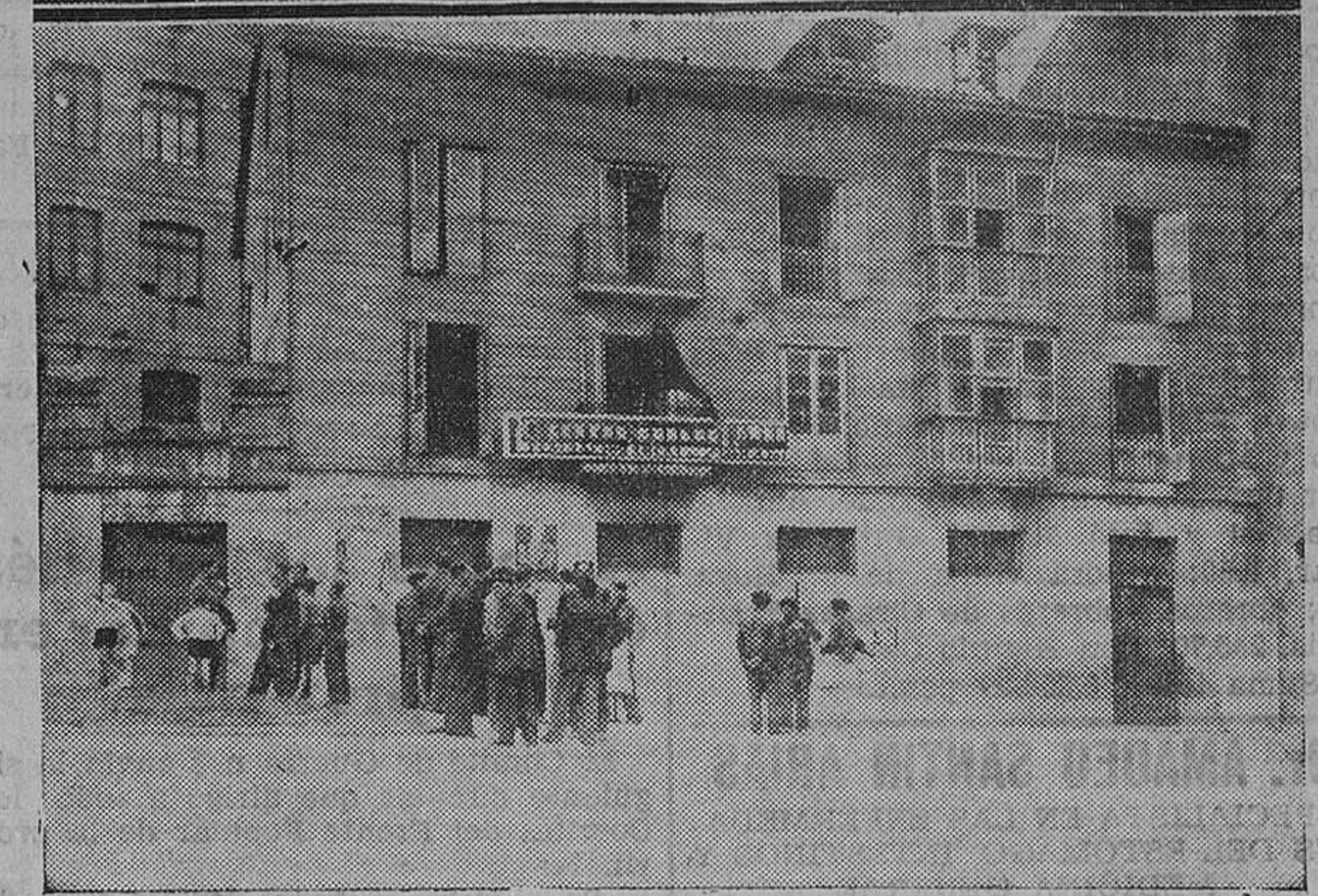
Edificios requisados. — El Frente Popular ha requisado los conventos de las Trinitarias y de los Agustinos, donde han quedado establecidos los domicilios sociales de la Casa del Pueblo y del Centro Obrero.

Los numerosos servicios que estos días, en defensa de la República, están realizando los elementos de la Unión General de Trabajadores y de la Confederación Nacional del Trabajo, no podían desarrollarse cómodamente por lo reducido de los locales en que, en proporción con los millares de afiliados con que cuentan, actúan aquellas organizaciones sindicales.