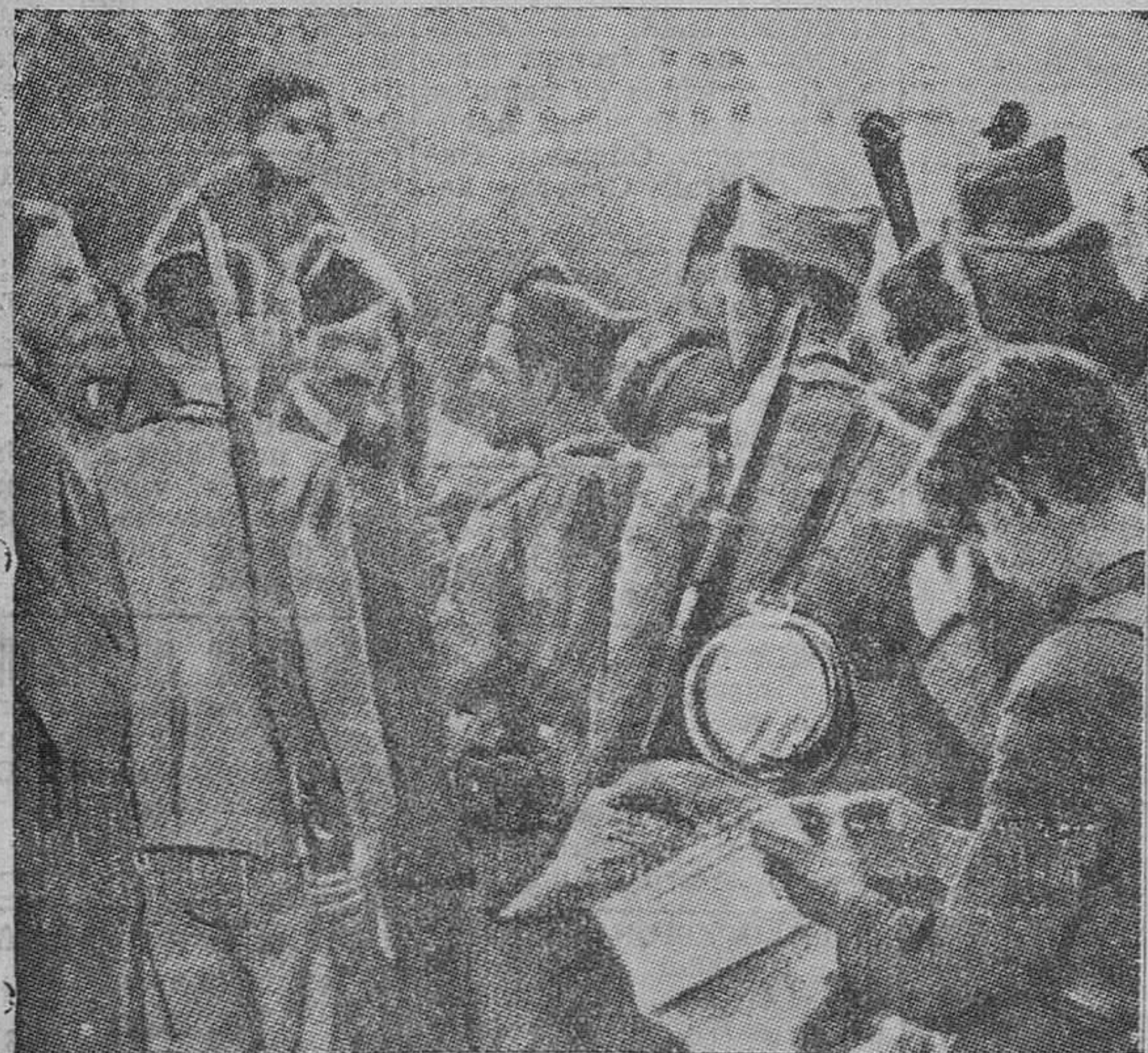
Un puesto de observación. — Un grupo de leales observa atentamente las posiciones del adversario para empezar el ataque