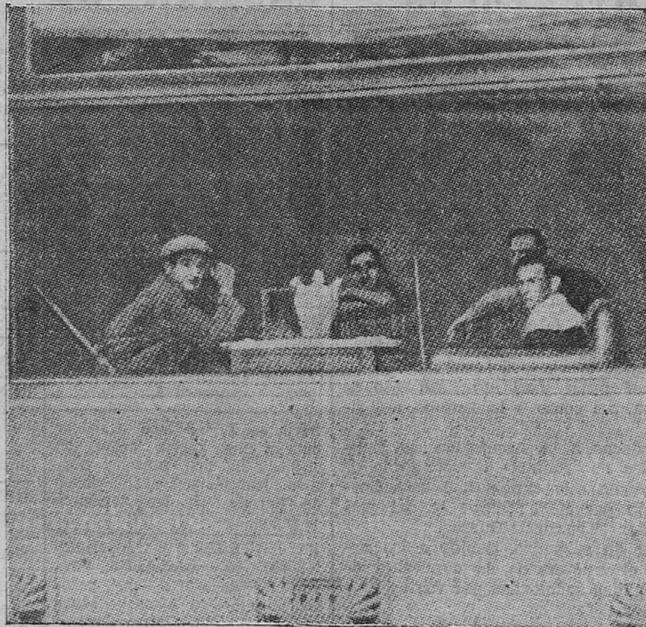
En el Circolo de Bellas Artes. — Este edificio, como se sabe, ha sido ocupado por los bravos milicianos del Frente Popular