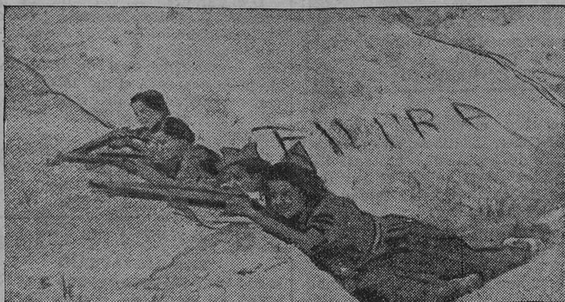
Grupo de heroicas mujeres milicianas que han participado valerosamente en los combates del Guadarrama.