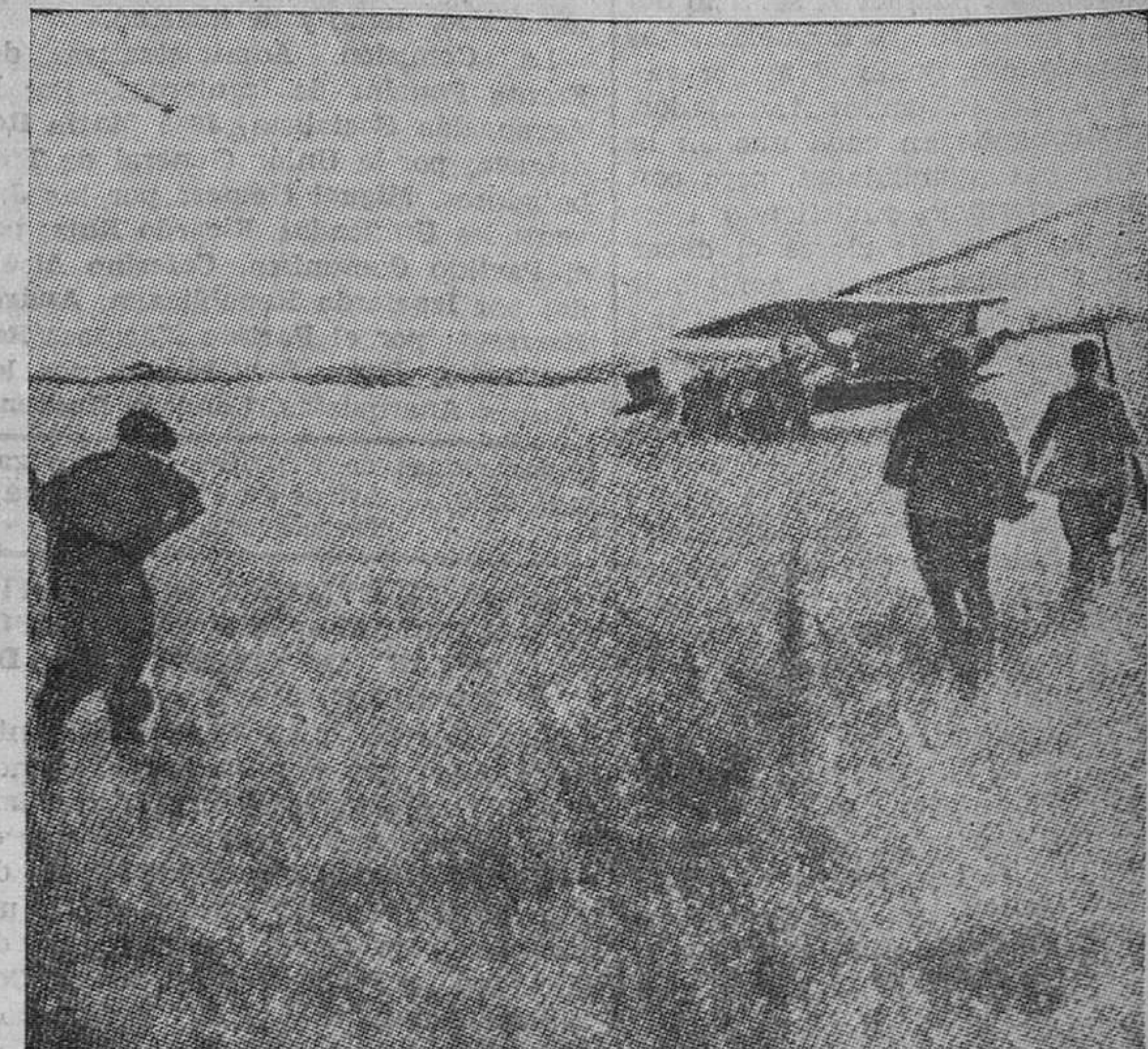
En el aeródromo de Madrid. — Un aeroplano del Gobierno aterriza después de haber efectuado con éxito un bombardeo