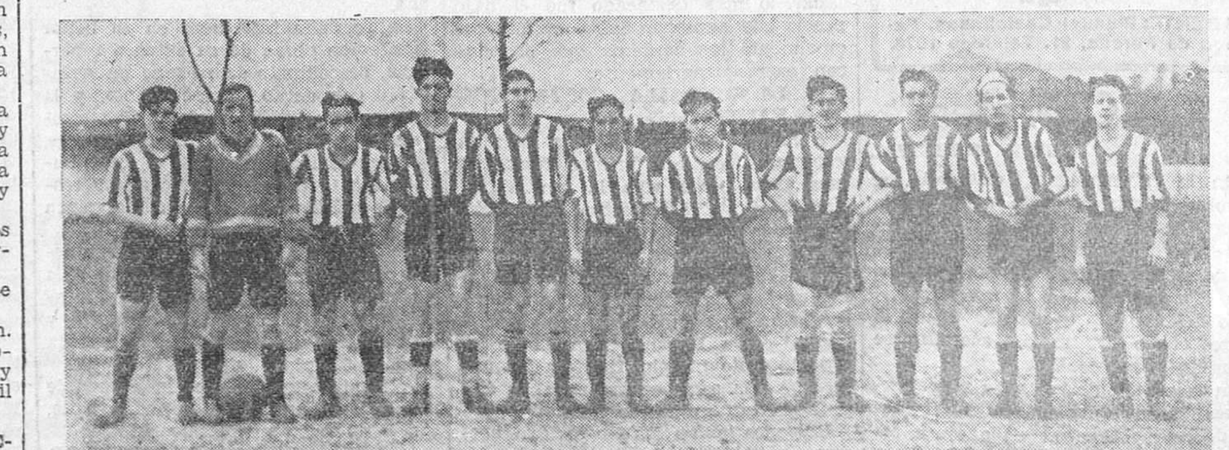
El Deportivo Miranda, uno de los más destacados de los clubs modestos.

RESFRIADOS EL DOLOR DE CABEZA LA CONGESTION DEL APARATO RESPIRATORIO Y EL LAGRIMEO SE CURAN RAPIDAMENTE CON ALGODON FORMAR PRECIO UNA PESETA