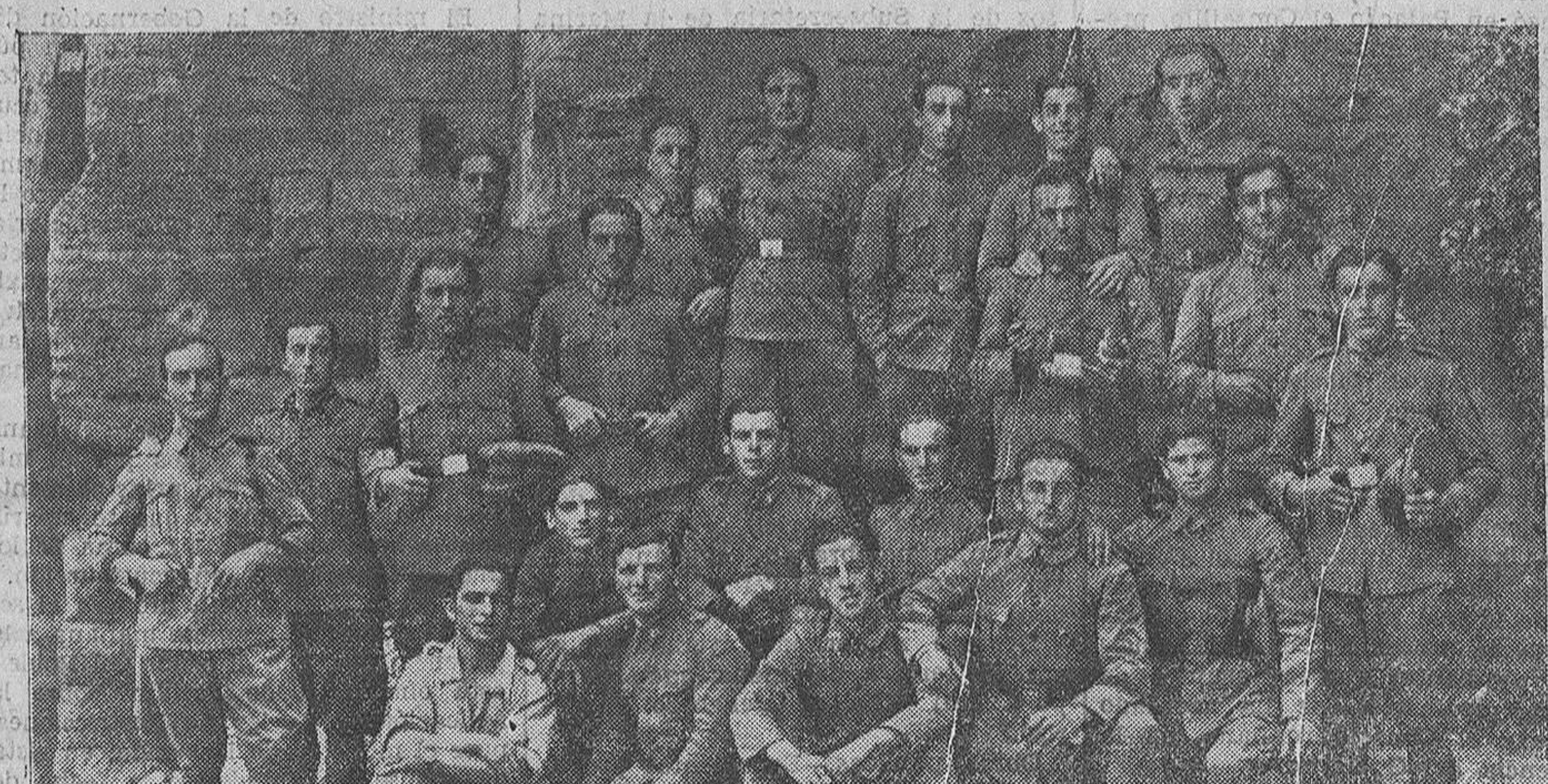
Un grupo de simpáticos soldados montañeses que están prestando el servicio militar en Lérida quieren, por mediación de EL CANTÁBRICO, ofrecer el recuerdo de esta fotografía a sus familiares.

El Comité ejecutivo a que aludimos ha celebrado varias sesiones en estos últimos días, estando al habla con los diputados por Santander.