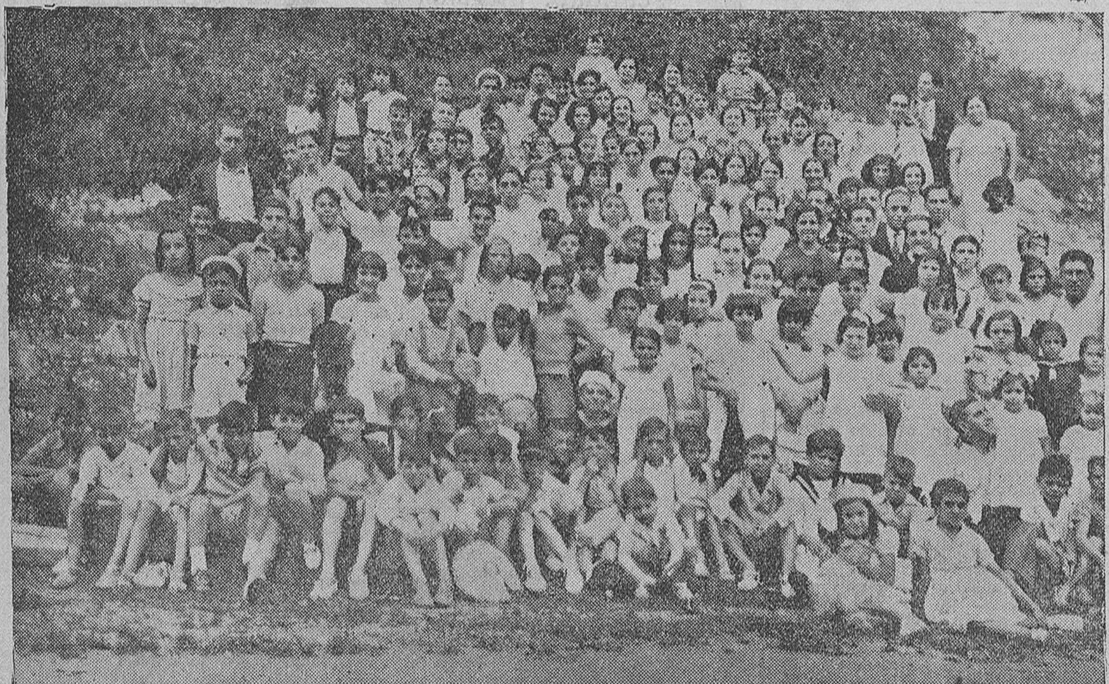
Grupo de alumnos y directivos del Centro de Enseñanza Integral y Laica de la calle de Magallanes, que realizaron el pasado domingo una excursión escolar a Solares y Hornayo.

El Ministerio, que oyó el dictamen y propuesta de la sección de Fundaciones y la Asesoría jurídica, acordó: