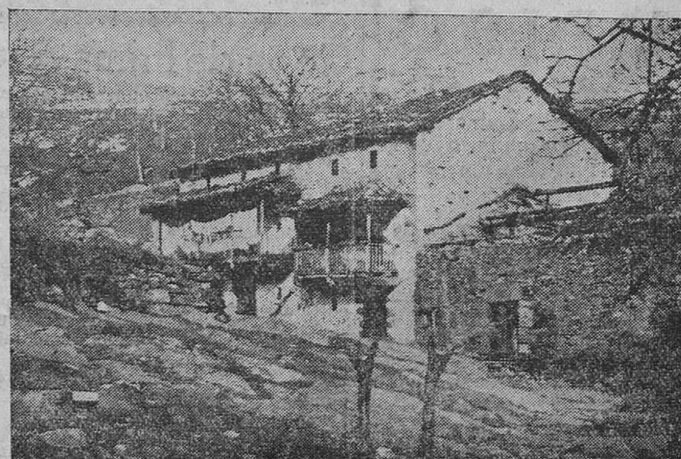
FAISAJES MONTANESES. — Dos casucas del pueblo de Soba. Ampliada solana, el huertuco y las montañas detrás.