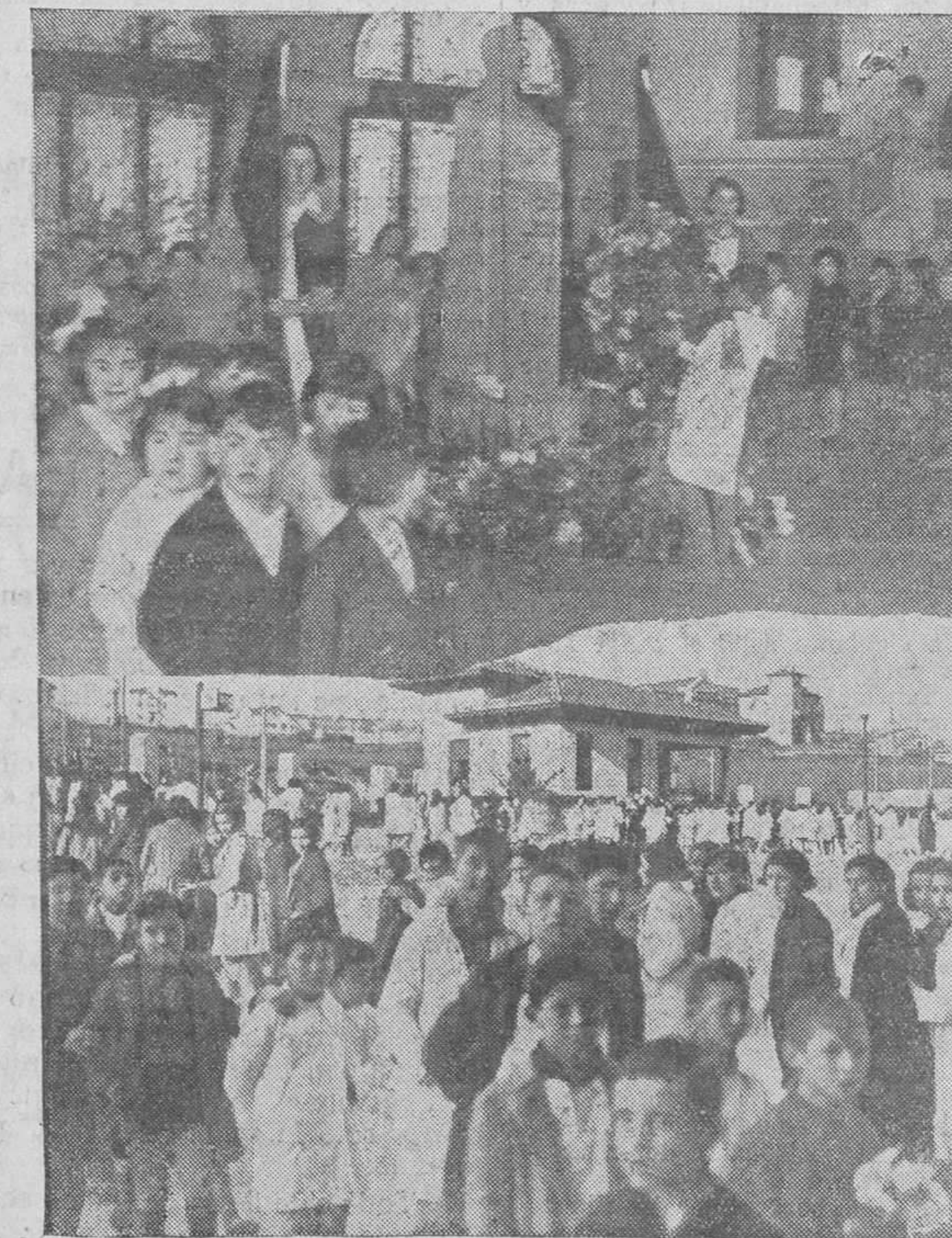
Los niños del grupo escolar Ramón Pelayo, que depositaron flores ante la estatua del marqués, desfilando por el «chall» de la Casa de Salud Valdecilla.

También visitaron al alcalde las operarias de la fábrica de tabacos,