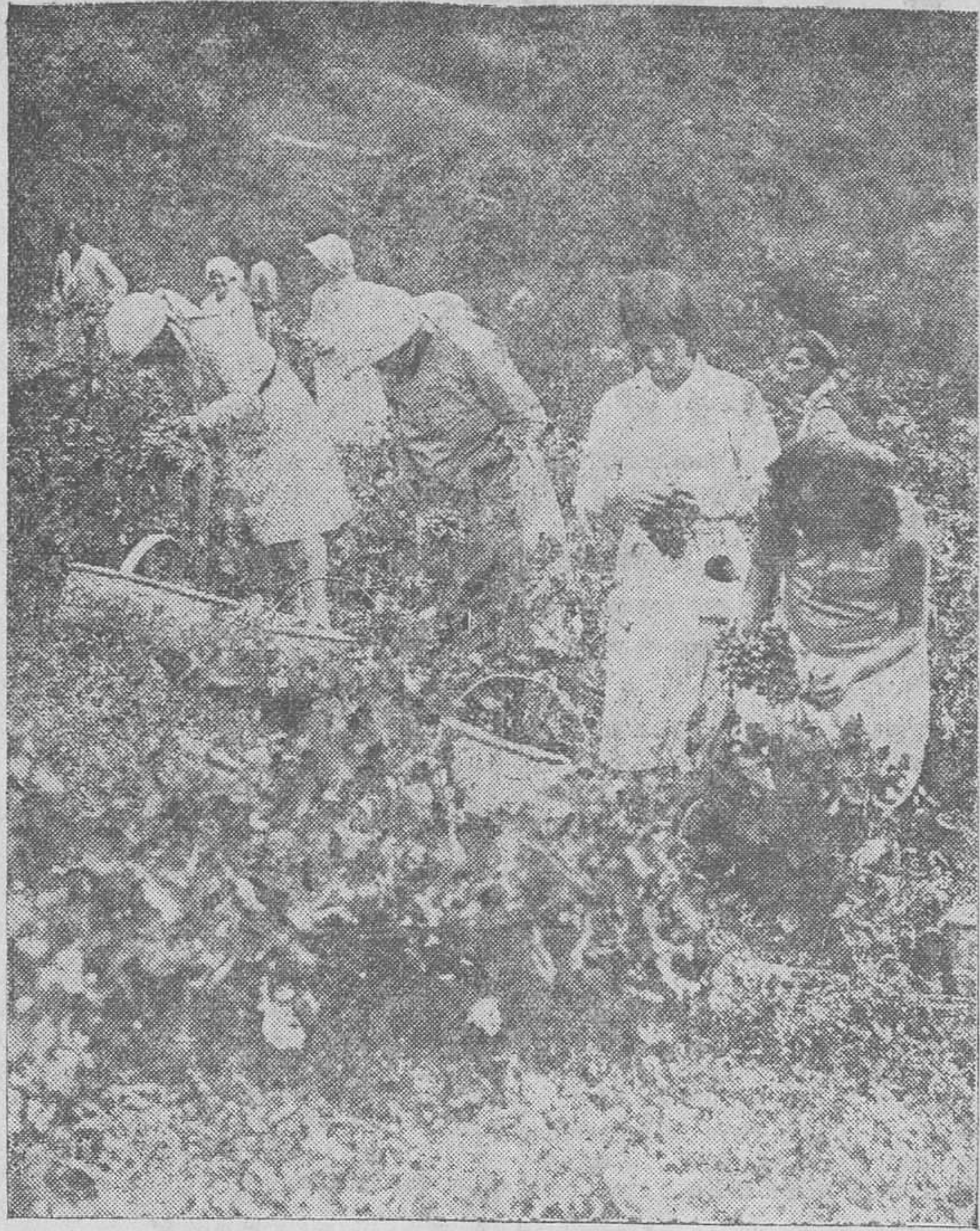
LA VENDIMIA EN LA PROVINCIA. — Pocos son los sitios de la provincia ricos en vinos, pero entre ellos hay que poner en primera línea a la región lebaniega, de donde sale ese vino que tan admirado es en las mesas de los grandes restaurantes por su color de rubí y su sabor exquisito. La foto representa una escena de la vendimia en aquella región donde las muchachas, con la llegada de septiembre, ponen entre los viñedos una encantadora nota de actividad y de color.

Existe gran animación por presenciar la labor de estos aficionados, y a juzgar por la fama de que viene precedida, no dudamos que hemos de pasar una velada agradable.