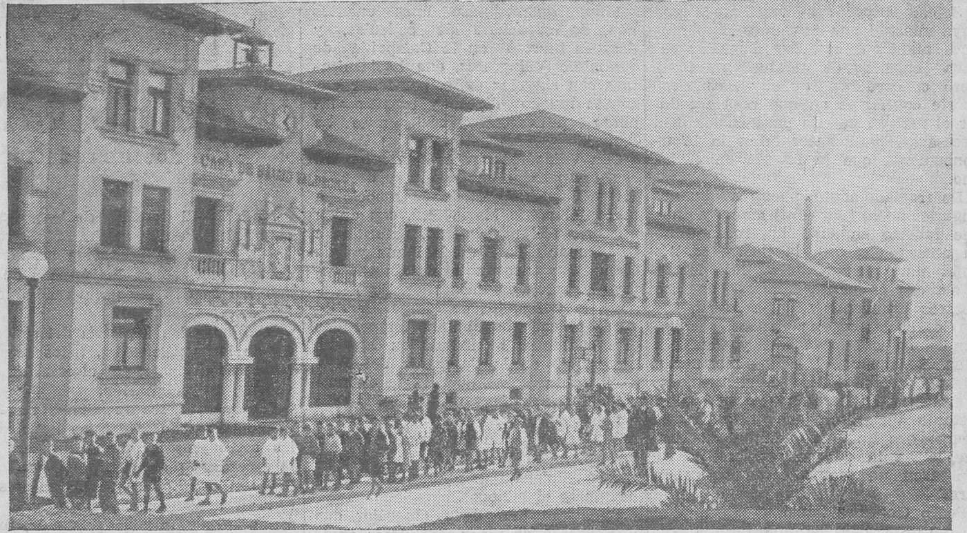
EN LA CASA DE SALUD VALDECILLA. — Desfile infantil ante uno de los pabellones de Valdecilla por los niños de las escuelas de Ramón Pelayo.