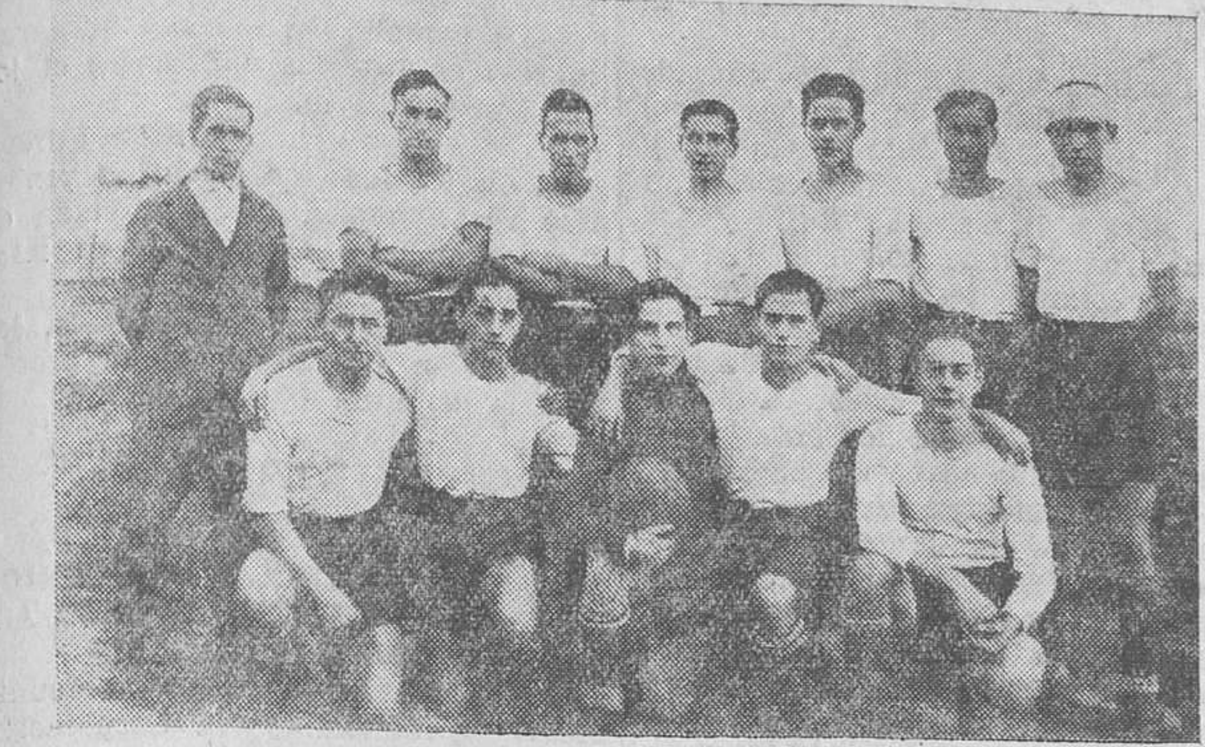
LOS CLUBS MODESTOS. — Los peques que forman el equipo Arsenal F. C., de la serie B, del Campeonato de los Clubs Modestos.