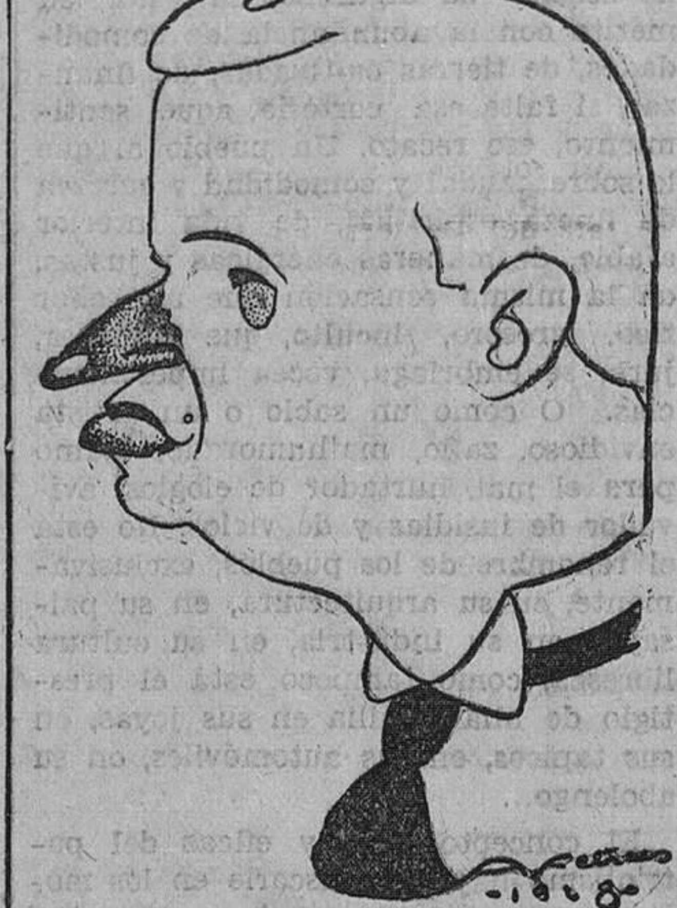
El pintor Gutiérrez Solana, visto por Felices.

numeroso y selecto público que acudió al acto examinó con recoleta atención. La obra de Solana obsesiona y causa profunda emoción artística. Atrean sus cuadros y dejan profunda huella en el espíritu. Se los ha visto una vez y se siente el deseo de volver a contemplarlos.