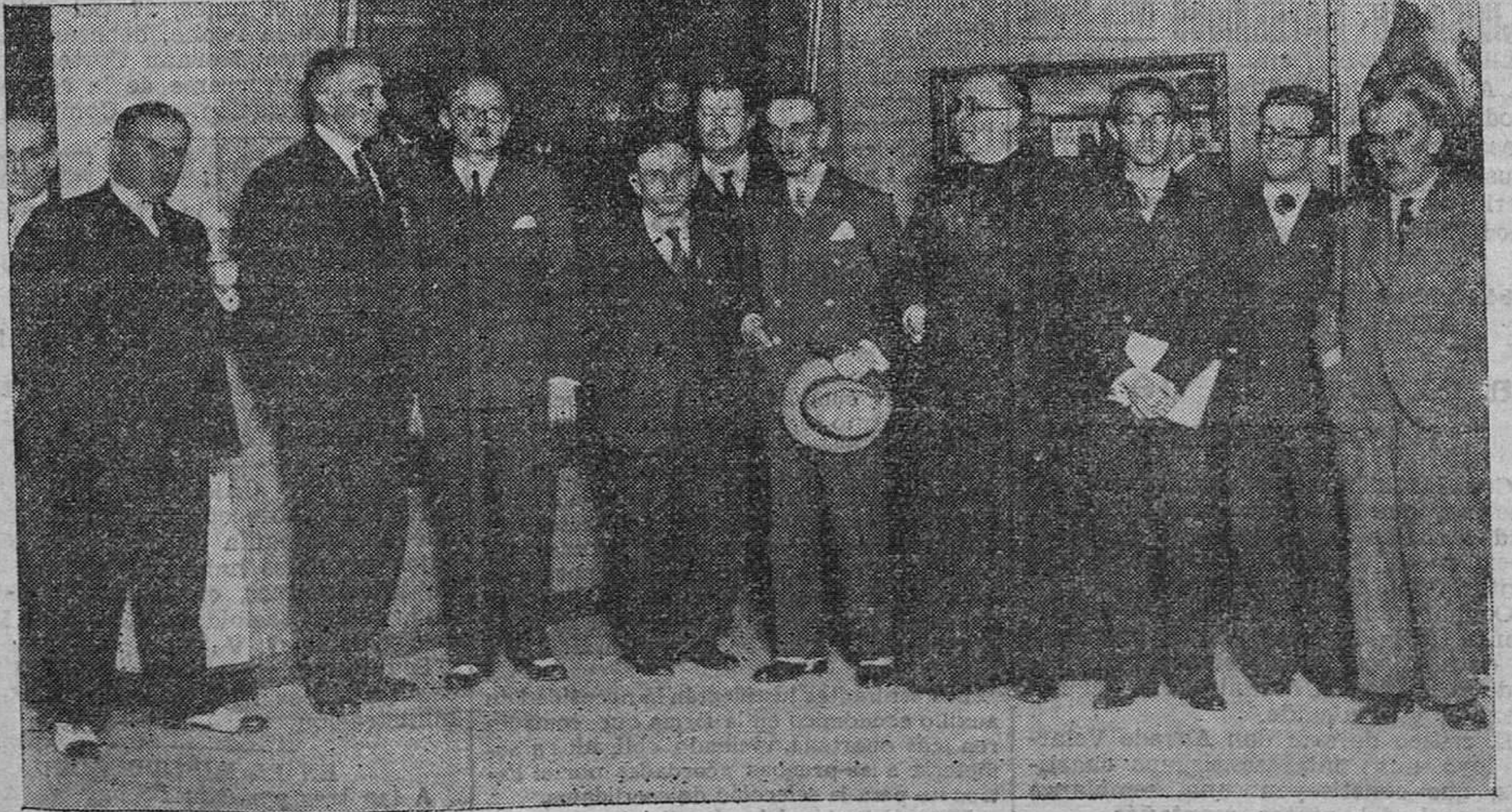
LA EXPOSICIÓN DE SOLANA.—Con gran concurrencia se celebró ayer la inauguración de la exposición de cuadros del genial pintor don José Gutiérrez Soana. Las salas del Ateneo, con este simpático motivo, se vieron llenas de gente que admiró una vez más el genio innovador y originalísimo de uno de nuestros primeros pintores.