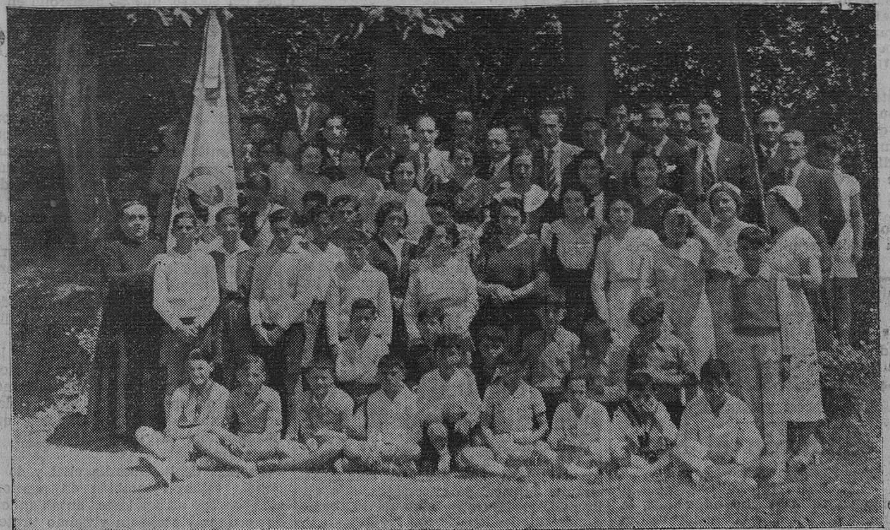
Grupo de cantores de los antiguos alumnos salesianos, que tomaron parte en el festival celebrado el pasado domingo en el colegio del paseo de Sánchez de Pereda.